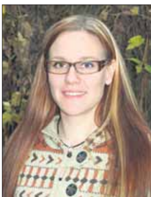
Siunausta syksyyne toivoen,

Kun asetamme omista suomalaisista lähtökohdistamme käsin huoliamme maailmanlaajuiselle asteikolle, huomaamme olevamme varsin etuoikeutettuja. Meilläkin toki