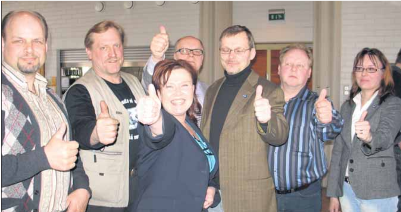
Kuvassa Pohjois-Karjalan innokkaita kansanedustajaehdokkaita.

Perussuomalaisia on aiheesta tai aiheetta rinnastettu Ruotsidemokraatteihin. Puolueiden linjaukset poikkeavat kuitenkin toisistaan melkoisesti. Tässä muutamia eroja.