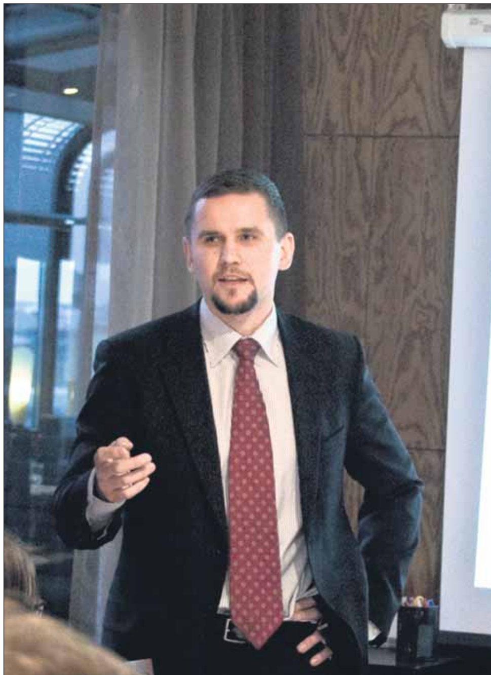
Asuntolainojen sitominen alle kymmenen vuoden viitekorkoihin heiluttelee asuntomarkkinoita.

Vielä joitakin vuosia sitten Metsola piti nykyysteemiä hyvänä ja edistykseksellisenä ja muualla yleisen lainojen sitomisen kymmenen tai jopa kolmenkymmenen vuoden korkoon vanhoillisena ja tarpeettoman jäykkänä, mutta kahden viimeisen vuoden tapahtumat ovat avanneet hänen silmänsä.