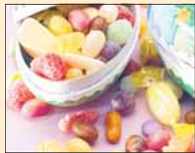
Irtokarkit 41,60 mk/kg