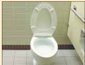
Jätevesijärjestelmä, n. 60 000 mk

Suoraan markkoiksi muutettuina monien tuotteiden ja palveluiden hinnat näyttävät hurjilta. Alla satunnaisia poimintoja kaupungilta: