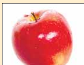
Omenat 11,90 mk/kg