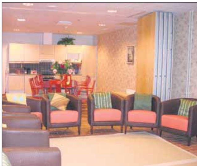
Cecilian yhteiset tilat ovat viihtyisiä ja monikäyttöisiä.

Virikkeitä ja vapaa-ajan ohjelmaa on pyritty järjestämään riittävästi. Ceciliaassa