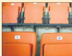
Elokuvalippu viikonloppuiltana 65,40 mk