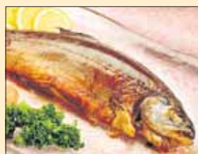
Savustettu kirjolohi 79,20 mk/kg