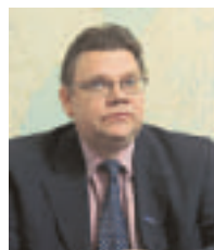
Puheenjohtaja Timo Soini