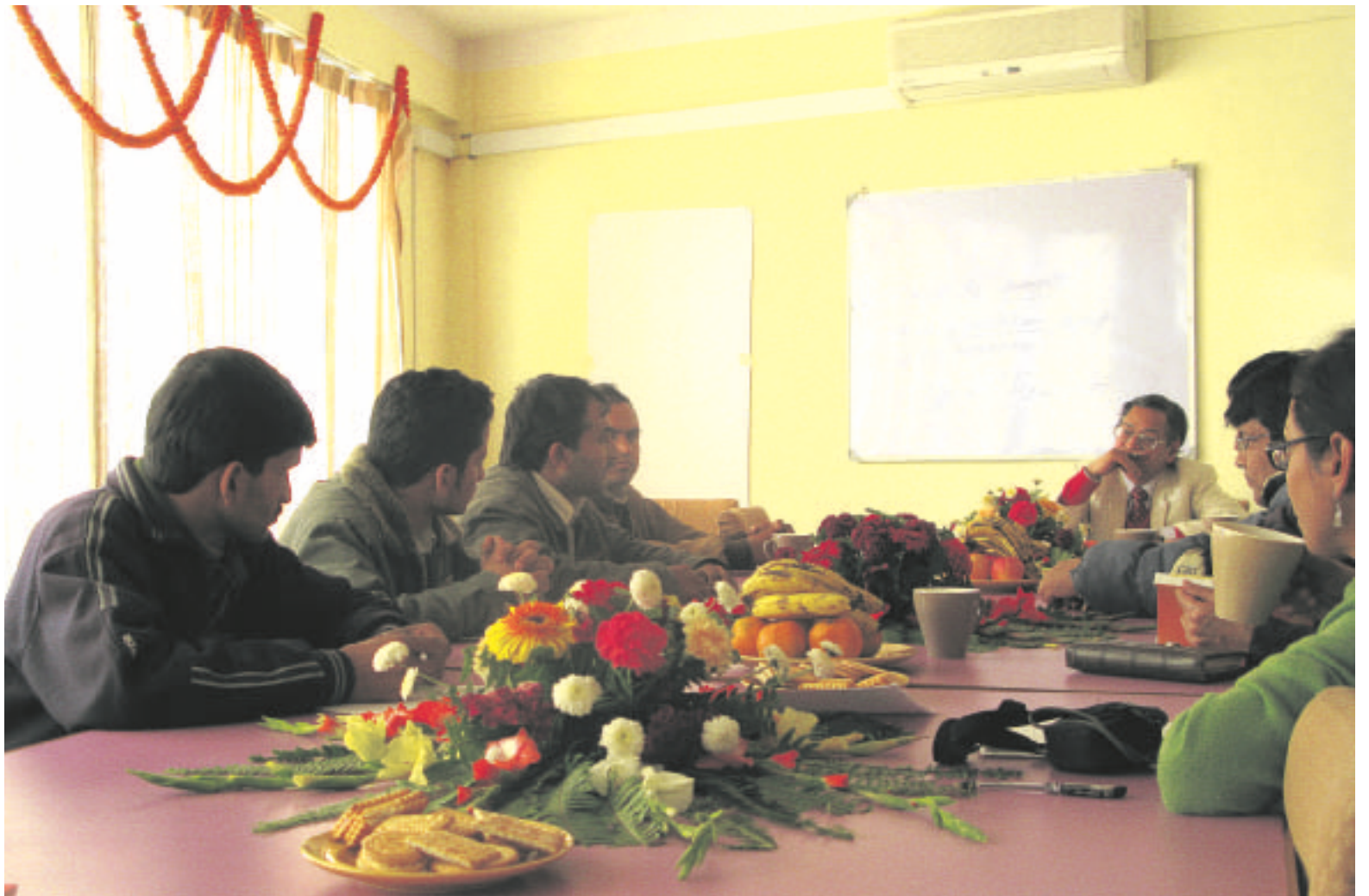
Nepalilaiset nuorisopoliitikot tekevät yhteistyötä yli puoluerajojen.

Demokratian lisäksi painopisteitä ovat koulutus kaikille, peruspalveluiden turvaaminen, nuorten osallistumismahdollisuuksien parantaminen sekä kestävä ja tasa-vertainen kehitys. Suuntaviivojen ollessa selvillä seuraavana haasteena on laajentaa hanke pääkau-