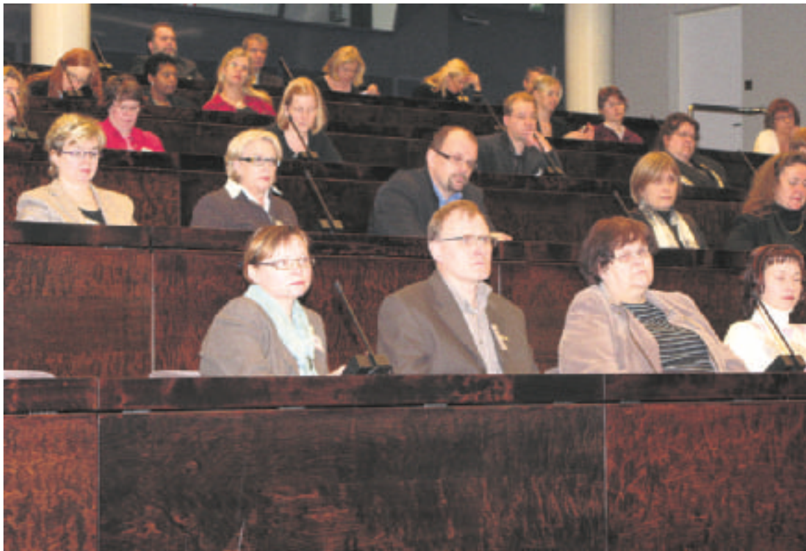
Eduskunnan auditoriossa keskusteltiin perhehoidosta. Kuuntelijoina oli alan ammattilaisia ja alasta kiinnostuneita henkilöitä. Yhtenä tapahtuman järjestäjistä oli Suomen Perhehoitoliitto ry.

Kun perhe voi huonosti, pahoinvointi heijastuu myös lapseen. Tällöin lapsi tai nuori joutuu usein kärsimään yhdessä pahoinvoivan perheen muiden jäsenten kanssa.