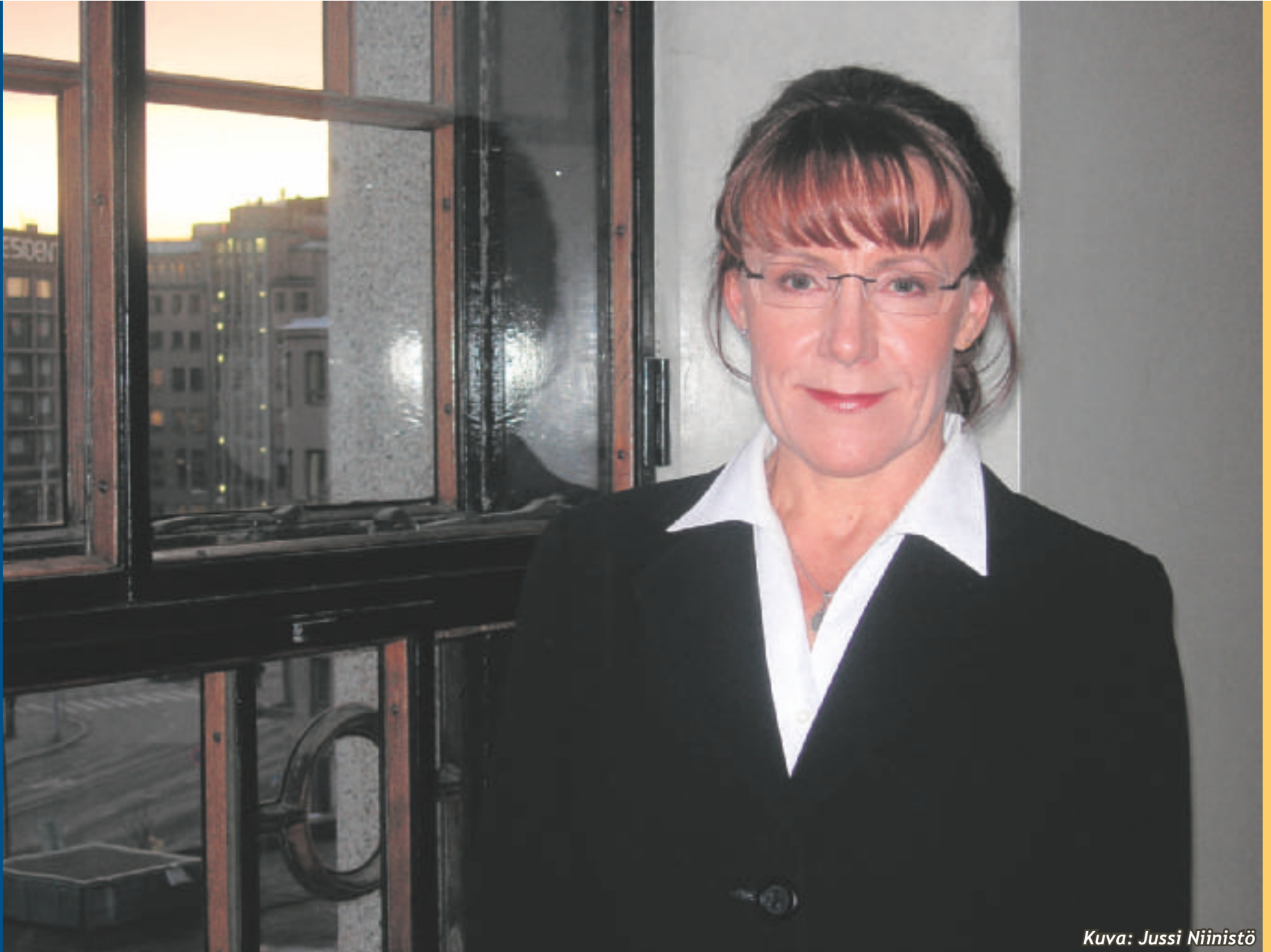
Kuva: Jussi Niinistö