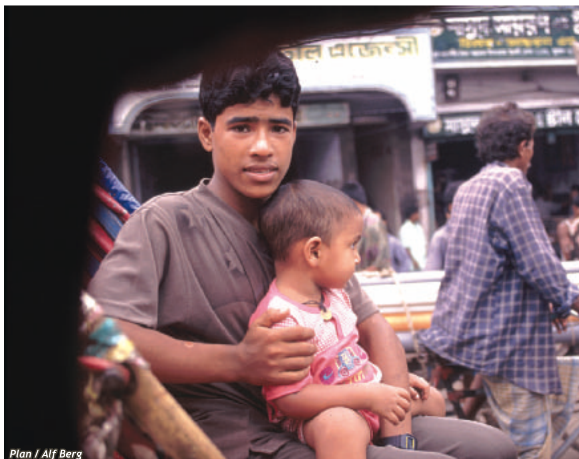
Plan / Alf Berg

Plan ehkäisee luonnonkatastrofien vaikutuksia kehitysmaiden lasten ja heidän perheidensä elämään kehittämällä paikallisten omaa toimintakykyä ja osaamista, jotta he pystyvät ehkäisemään vahinkoja ja kärsimystä. Plan kiinnittää huomiota erityisesti ilmastomuutoksen tuomin haasteisiin lasten oikeuksien toteutumise-