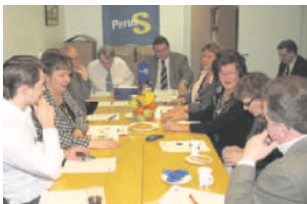
PerusS:n puoluehallitus kokoontui 21.2. Esillä oli mm. PerusSuomalainen-lehden uudistaminen.