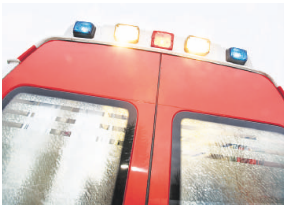
Toimitaanko tilaaja-tuottaja mallissa liukuhinna-periaatteella? Määrä laadun kustannuksella?

Jotta julkisen palvelutuotannon hinta tulisi vertailukelpoiseksi yksityisen tuotannon hinnan kanssa, tulisi tilaajan kustannukset jyvittää tarjousten hintoihin. Pelkäs-