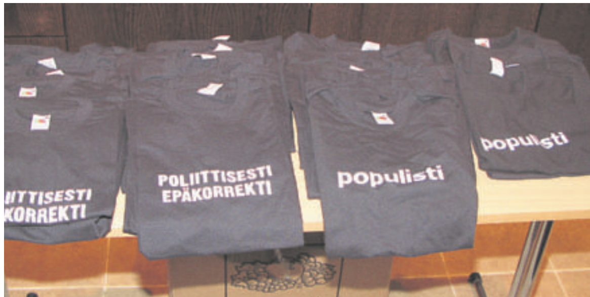
PS-nuoret kauppasivat kokousväelle aattellisia t-paitoja.