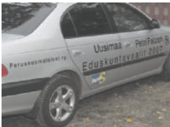
Vaalit lähestyvät, ehdokkaat voivat olla esillä monella tapaa. Tämä tapa ainakin huomataan.