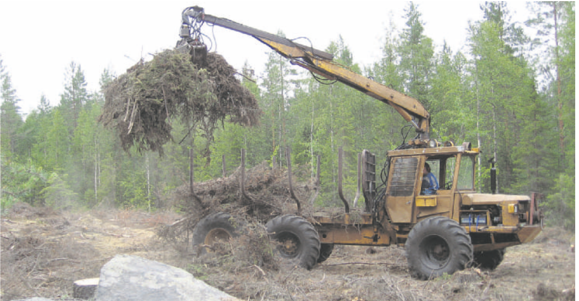
Metsähakkeen keruu on nopeaa, kun puut on karsittu kasoihin, josta hakkuutähteet kerätään niiden hieman kuivuttua. Kuvassa hakkuutähteiden keruuta Kaavin Niinivaarassa.