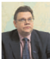
Puheenjohtaja Timo Soini

Nordea ..... 218518-148703 Sampo ..... 800013-70212996