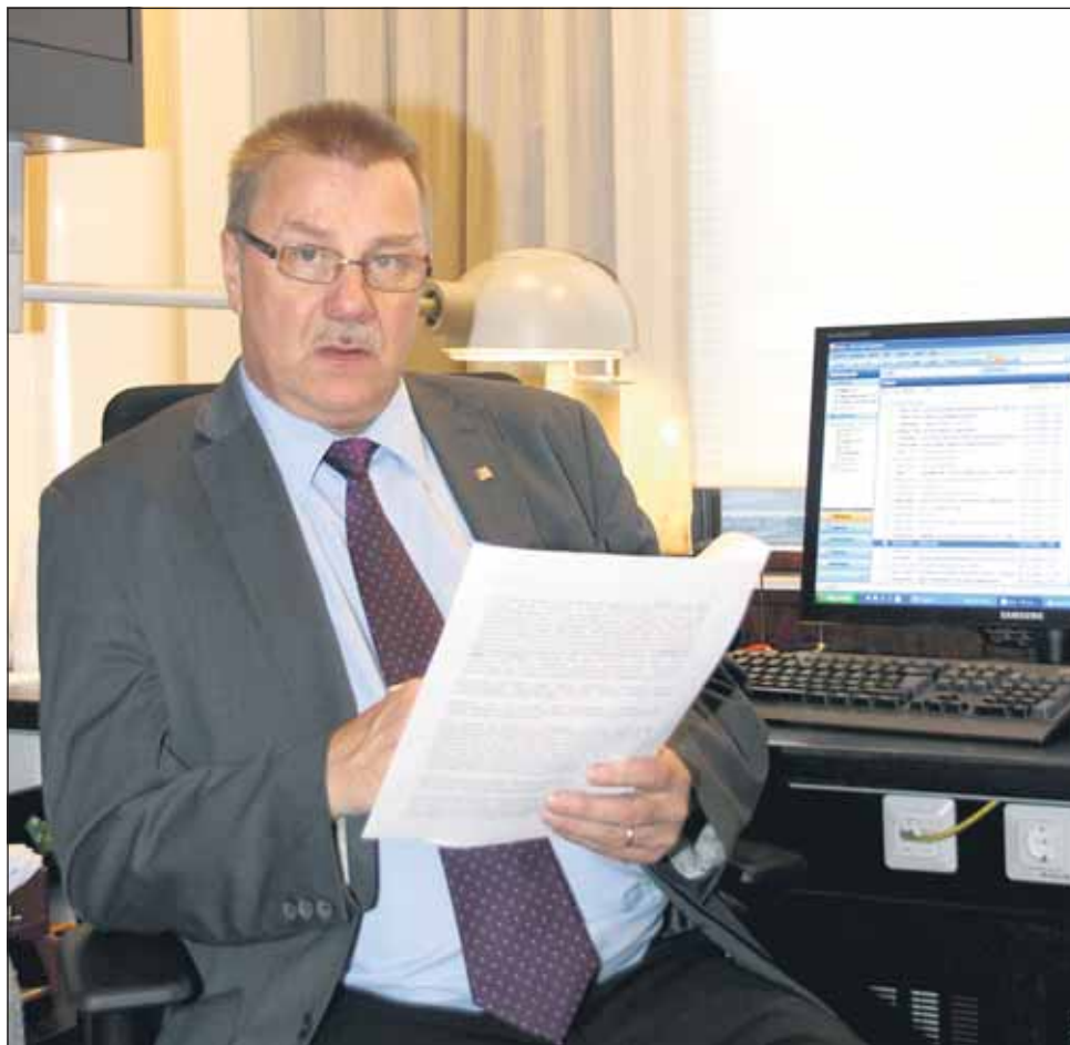
Keskustalainen kansanedustaja Markku Uusipaavalniemi ilmoitti eroavansa Keskustan eduskuntaryhmästä ja siirtyvänsä Perussuomalaisiin. Perussuomalaiset toivottavat tervetulleeksi rohkeudestaan ja suoraselkäisyydestään tunnetun Uusipaavalniemen.