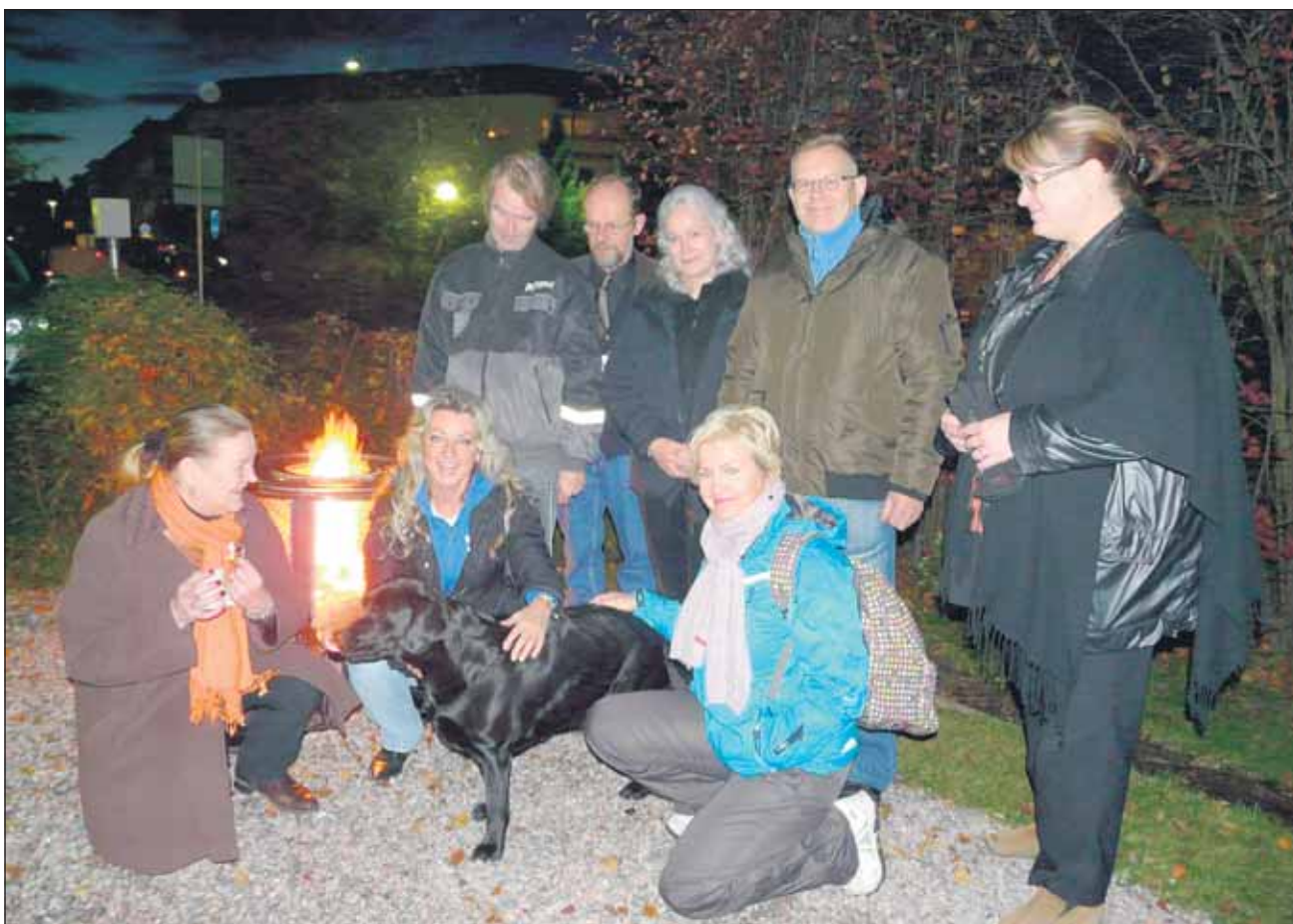
Myrriin pihalla rupateltiin rennosti nuotio loimutessa. Kuvassa myös Myrriissä toimiva terapiakoira Lellu.