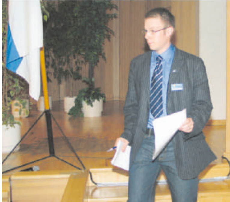
Puolueen nuorten tekemä esitys puolueen nimen muutoksesta sai rajun vastalauseiden ryöpyn kokouksalista.

Nuorten puheenjohtaja toimiva Saarakkala ei ole toimittanut puolueelle asianomaisilla allekirjoituksin varustettua esitystä (pöytäkirjaa) määräaikana puolueelle. Nuoret jättivät nimen-