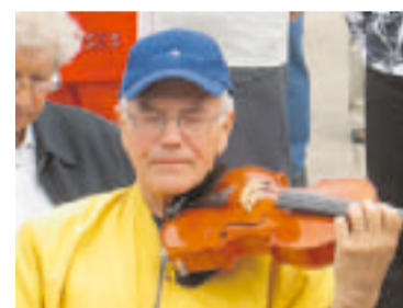
Musiikki kuuluu juhlaan.