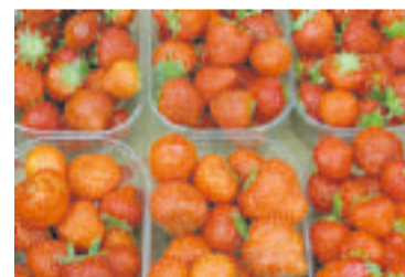
Mansikat olivat tietysti toriväen ruokalistalla keustosuosikkina.