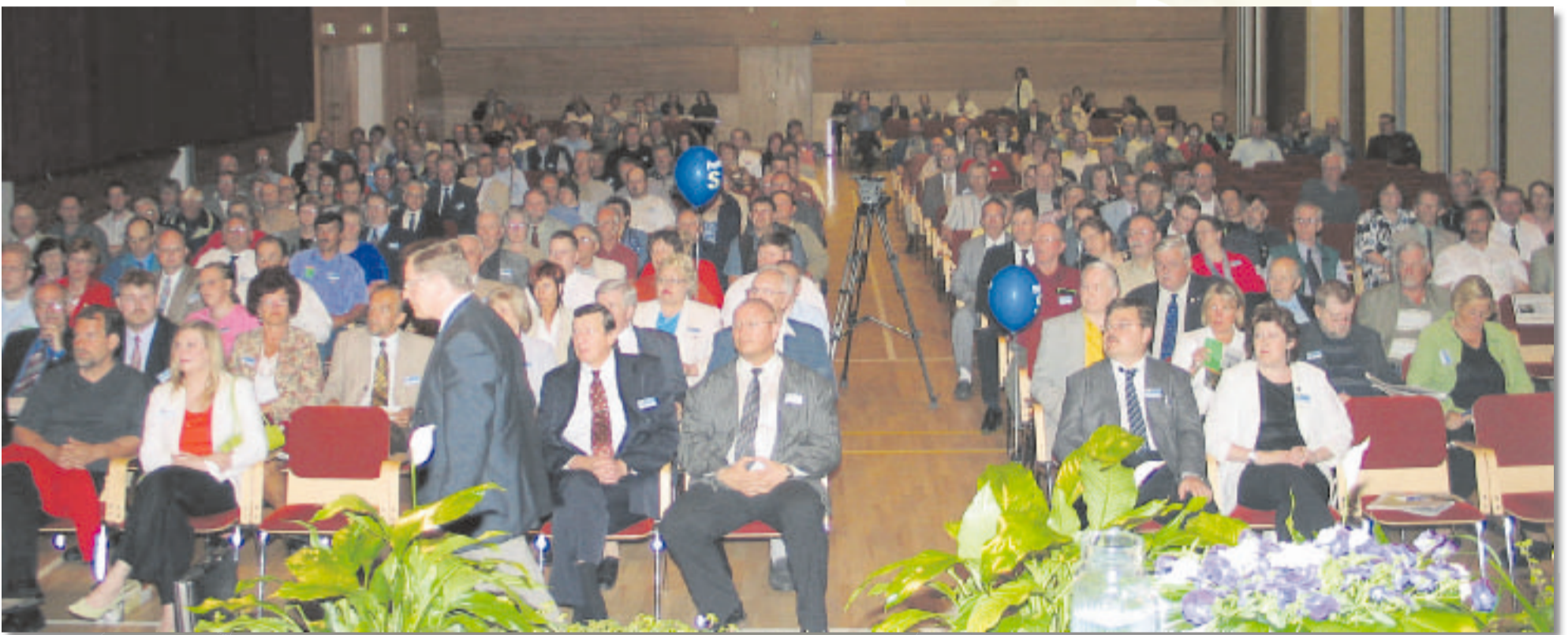
Kokouspaikkana oli Kokkolan kauppaoppilaitoksen Snellman -sali.