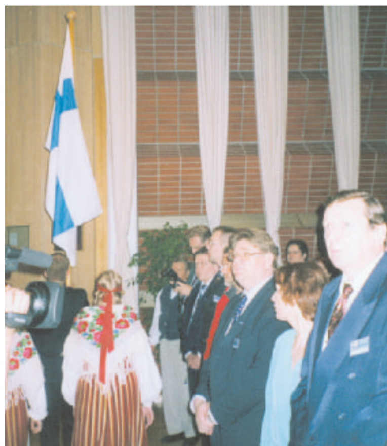
Suomen lippu tuotiin saliin juhlallisesti. Kokousväki lauloi lippulaulun seisten.