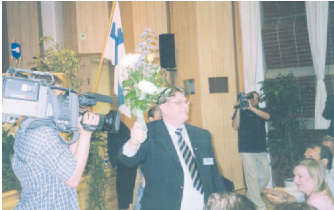
Soini valittiin tehtävään yksimielisesti, raikuvien aplodien saattelemana.

Perussuomalaisten puheenjohtajuuden hän sai, kun Rai-