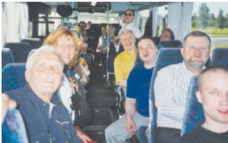
Pääkaupunkiseudulta tuli kaksi linja-autollista kokousväkeä laulaen: linja-autossa ompi tunnelmaa (kuten kuvasta näkyy).