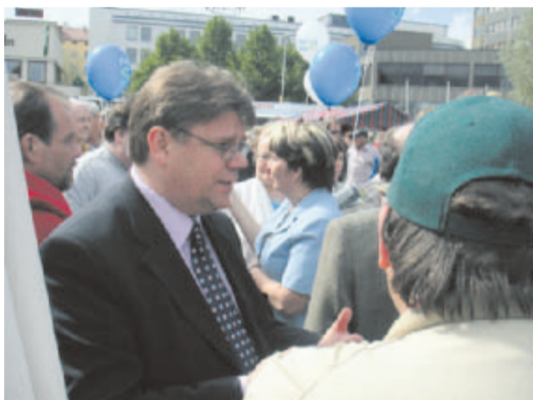
Puolueen puheenjohtajalla Timo Soinilla oli hyviä vastauksia toriväen kiperiinkin kysymyksiin.