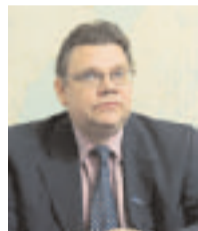
Puheenjohtaja Timo Soini