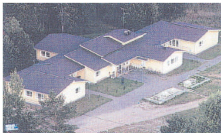
Ilmakuva lomakeskus Rauhalasta Saarijärveltä.

Onnittelut vielä Perussuomalaisten puheenjohtajalle, presidenttiehdokas Timo Soinille .