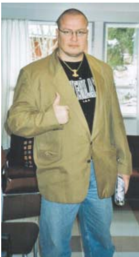
Tony Halme tervehtii Saarijärvellä lukijoitamme.

PerusS:n kaupunginvaltuustoryhmän puheenjohtaja Tony Halme 16.02.2005 Helsingin kaupunginvaltuuston lähetekeskustelussa vuoden 2006 talousarvion raamista