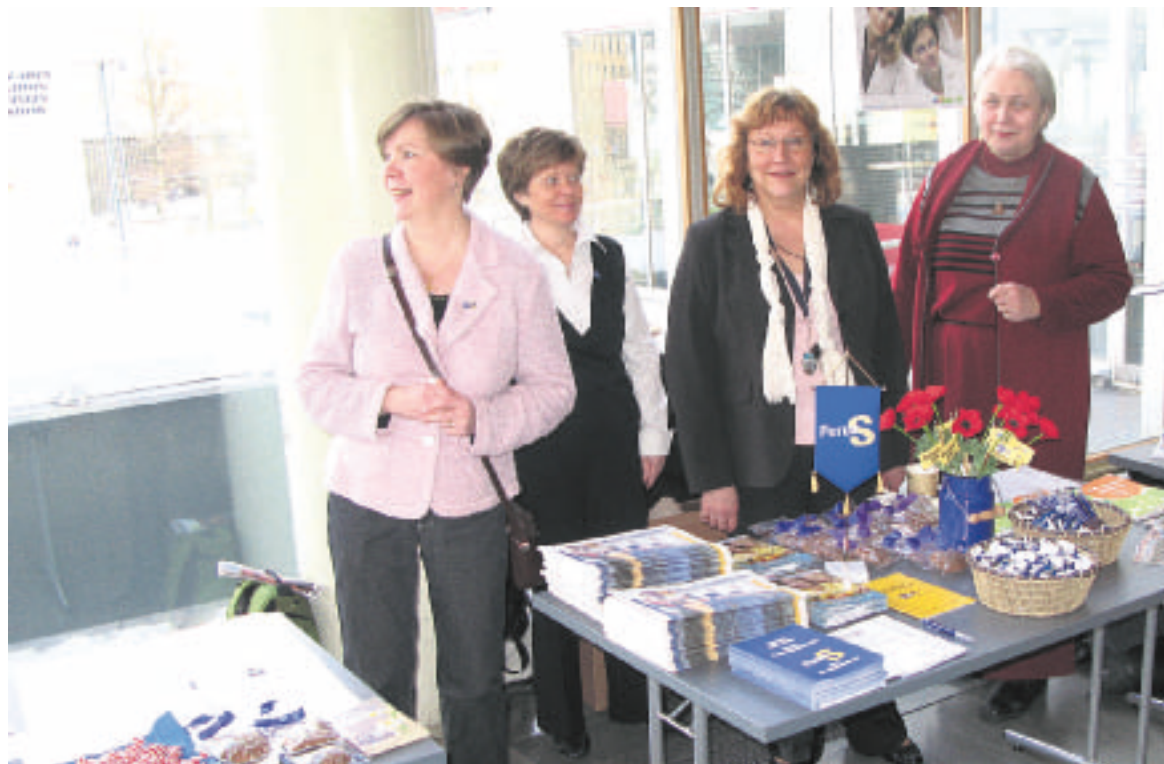
Perussuomalaisten naisten pöydässä oli paljon hyvää mukaan otettavaa.

Me Perussuomalaiset Naiset, yhtenä NYTKIS ry:n jäsenjärjestönä teimme tunnetuksi omaa puoluettaamme pitämällä tilaisuudessa esittelypöytää ja keskuste-