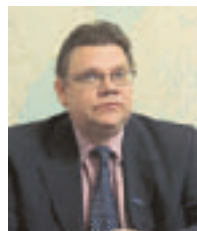
Puheenjohtaja Timo Soini

Nordea ..... 218518-148703 Sampo ..... 800013-70212996