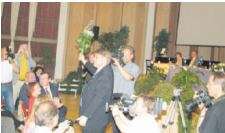
Kameramiehet piirittävät tuoretta presidentinvaaliehdokasta; Perussuomalaisten tv- julkisuus alkaa rytinällä.