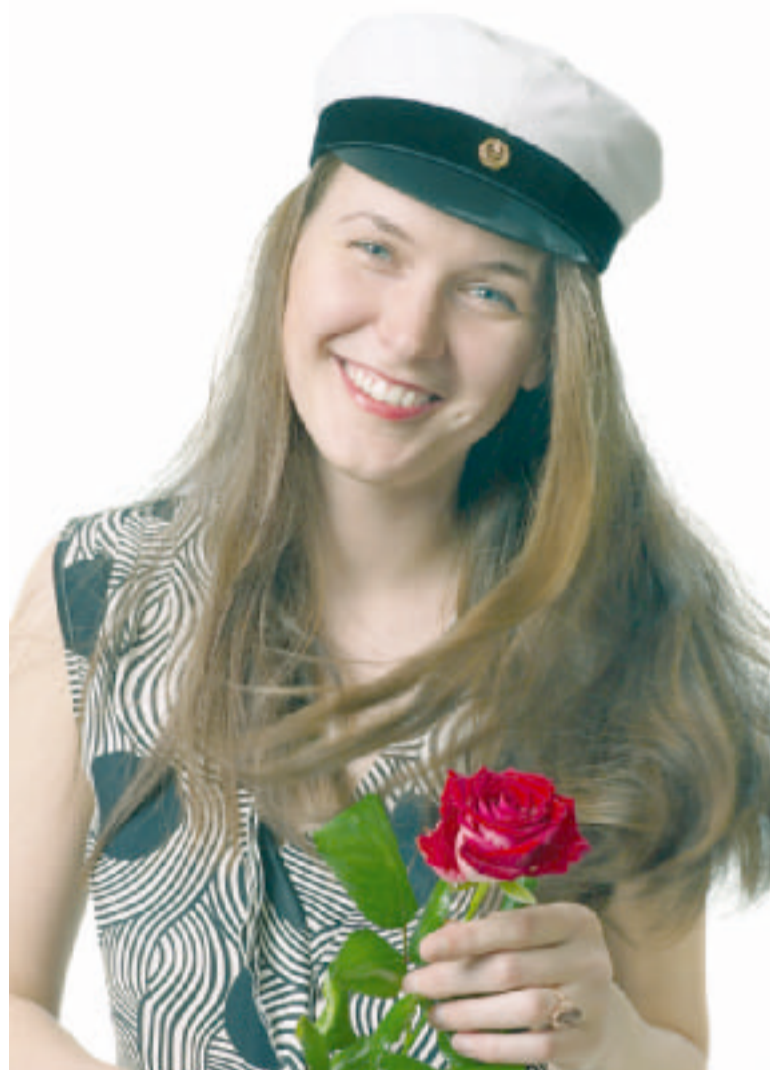
Lukiolaiset ovat kiinnostuneita Perussuomalaisista ja heidän mielipiteistään.

Suomessa on tällä hetkellä suhteellisen vähän pakolaisia ja maahanmuuttajia. Heidän