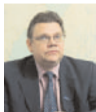
Puheenjohtaja Timo Soini

Nordea ..... 218518-148703 Sampo ..... 800013-70212996