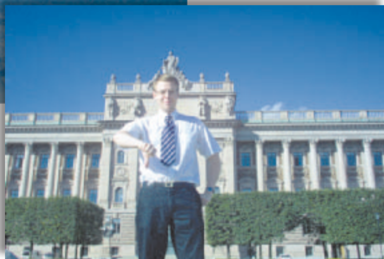
Muuten hyvä, mutta Ruotsin valtiopäivien harjoittama maahanmuuttopolitiikka ei todennäköisesti nauttisi perussuomalaisten luottamusta jos olisimme edustettuina.

Ruotsiin aikoessa kannattaa viimeistään laivalta vaihtaa eurot kruunuihin, sillä ruotsalaiset torjuivat eurot pari vuotta siten järjestetyssä kansanäänestyksestä. Ruotsissa poliittinen keskustelukulttuuri on Suomessa avoimempi, mikä antaa mahdollisuuden eri poliittisille