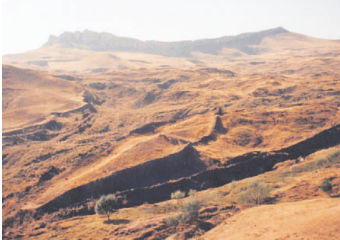
14 vuoden odotuksen ja rukoilun tulos. Nooan arki vuonna 2005.

Epäilevin mielin lähestyin Mardinia, paljon puhuttua Syy-