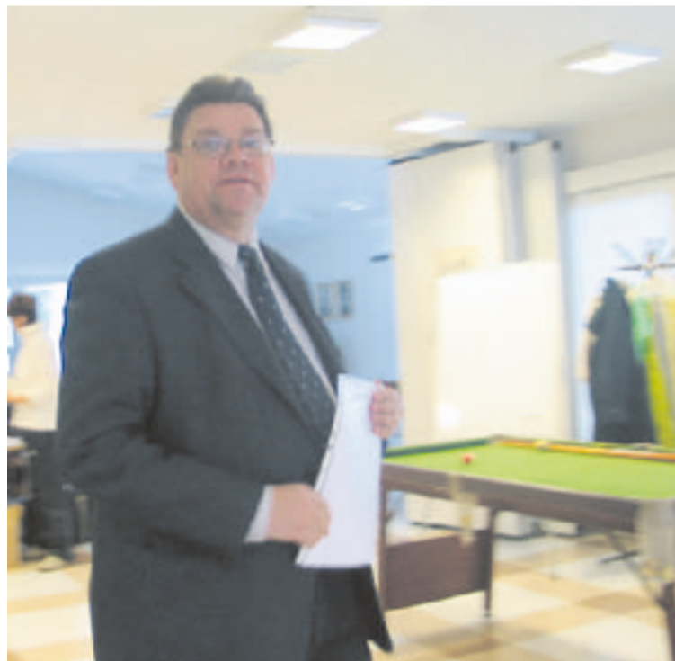
Türkissä uskonnollisen vapautta ei kunnioiteta ihmisten perusoikeutena.

Uskonnonvapaus ja oikeus harjoittaa omaa uskontoaan ovat meille kuitenkin perustavaa laatua olevia ihmisoikeuksia. Islamiuskoisissa maissa näitä perusoikeuksia ei täysin