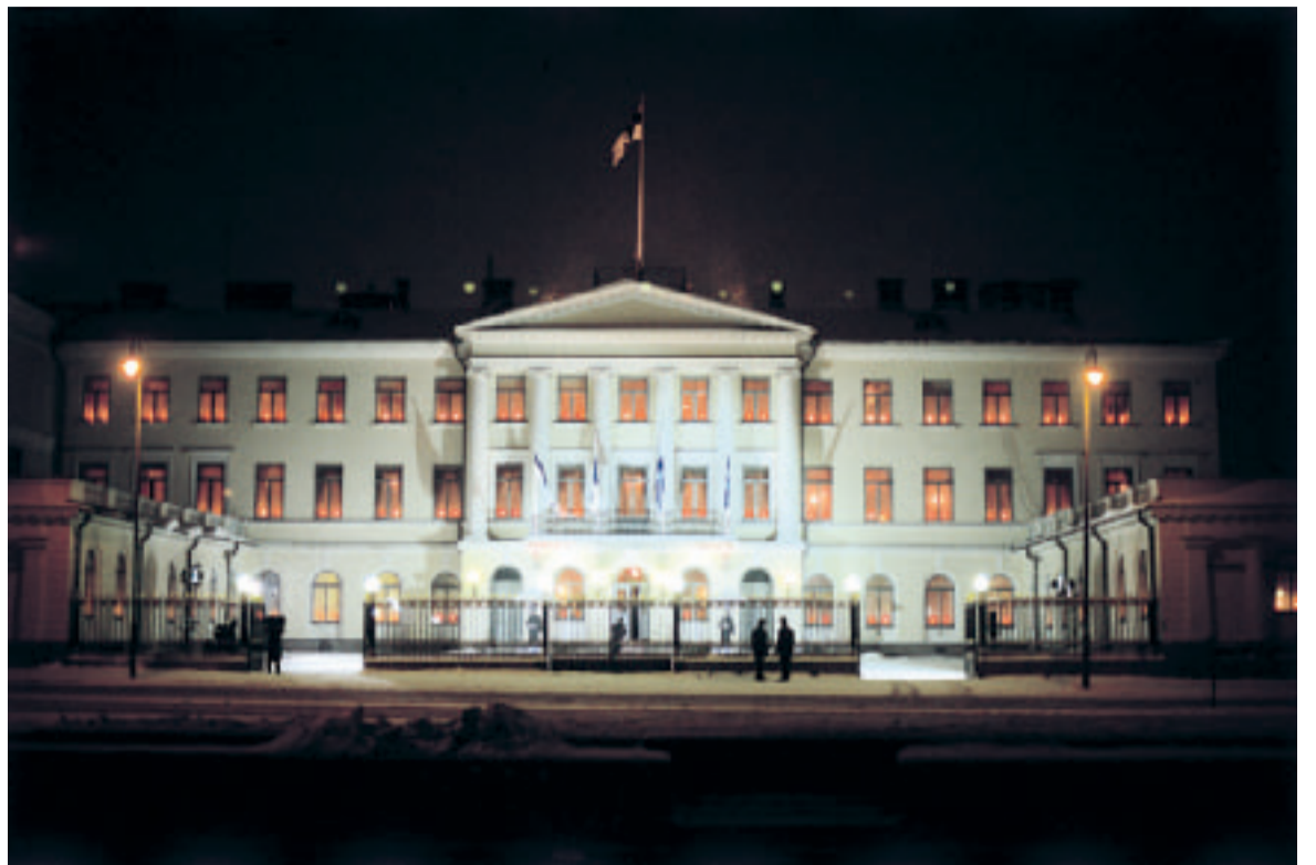
Vaihtuuko tässä linnassa isäntä?