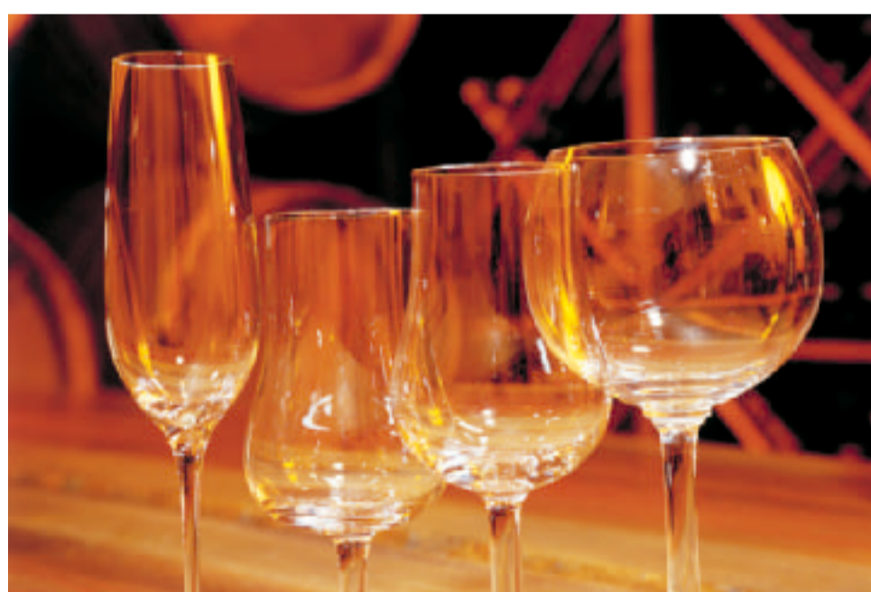
Jatkuva, liiallinen alkoholin käyttö on sairaus.

Yhteiskunnassamme on vallitsevana asenteellinen ajattelu ja juomisen mahdollistava toimintakulttuuri. Salailulla