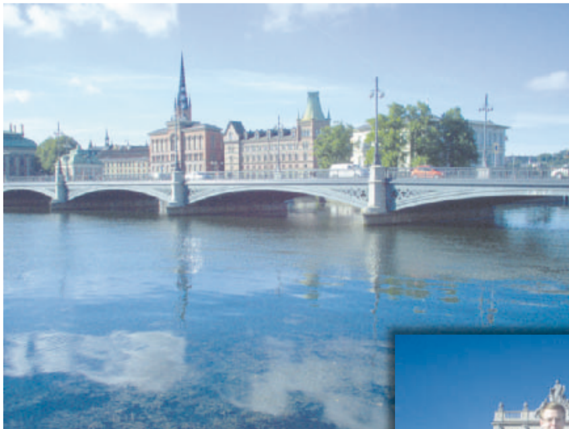
Tukholma sijaitsee vetten keskellä Mälaren-järven ja Itämeren rannoilla.

Tukholmaa tuli kierrettyä niin metrolla, bussilla kuin jalankin. Selostettu kiertoaajelu näytti kaupungin parhaat puolet. Hintaa puolentoista tunnin ajelulle tuli siedettävät 20 euroa. Samalla sai otettua joitakin hyviä valokuvia Tukholman historiallisista rakennuksista. Niitä on esimerkiksi Helsinkiin verrattuna monikertaisesti. Päivälippu metron maksoi euroissa noin kymppi. Metrolippu vapaut-