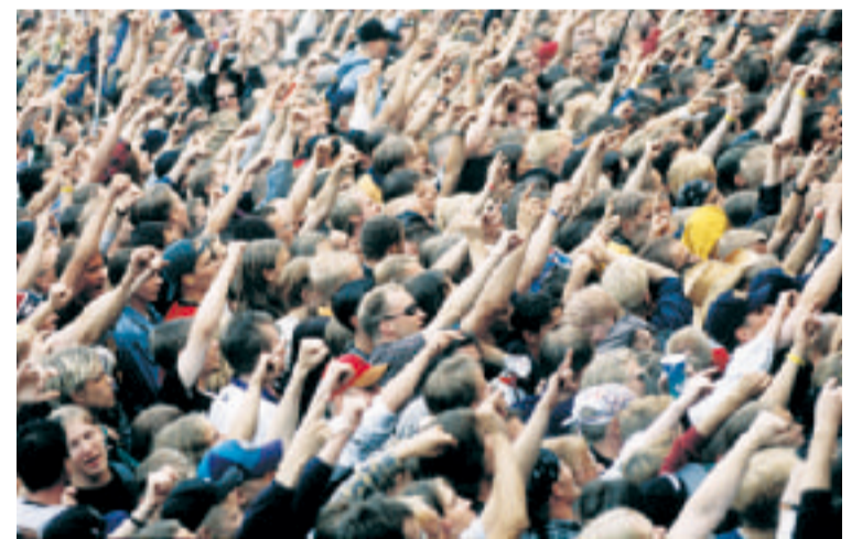
Suuret kansanjoukot haluavat keskustelua kipeistä asioista. Isot puolueet vaikenevat ja haluavat vain lyhyttä presidentinvaalikampanjaa. Äänestämällä EU-kielteisyyttä voi kanavoitua Perussuomalaisiin.

Kolmen vanhan puolueen presidenttiehdokkaat haluavat lyhyen ja mitäänsanomattoman kampanjan. On myös selvästi havaittavissa, että nämä ehdokkaat valitsijoiden enemmistöä havitellessaan haluavat välttää kansaa jakavia kipeitä kysymyksiä, kuten esim. NATO-jäsenyyden hakeminen.