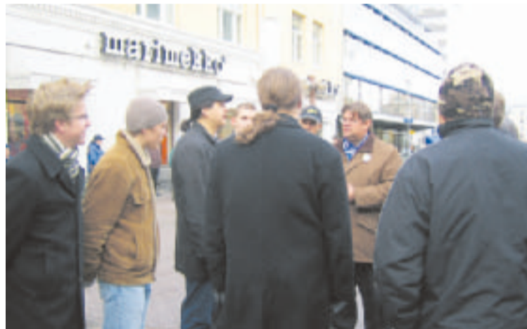
Timo Soini Oulussa Rotuaarilla 22.10.2005. Perussuomalaiseen puolueeseen on tulossa nuorta väkeä.