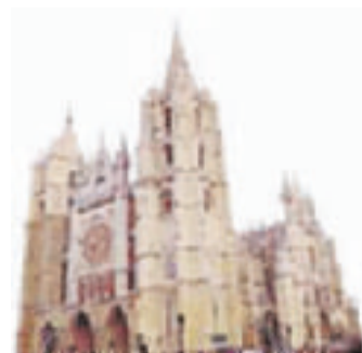
Leónin kuuluisaa katedraalia on aloitettu rakentamaan 1200-luvulla.

Yliopistot ovat joutuneet jo kuluneen kymmenen vuoden ai- kana leikkaamaan toimintojaan. Jos valtiovalta ei pysty varmis- tamaan Suomen ylimmälle ope- tukselle riittäviä toimintavaroja tulevaisuudessa, halvaantuu suomalainen tutkimus.