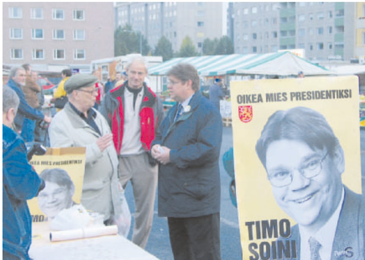
Tampereen torilla riitti juttua. Pirkanmaan piirikokouksen yhteydessä Timo Soini otti esille muun muassa naisparien adoptio-oikeuden, jota hän piti kielteisenä asiana.

Herra puhemies! Tietysti tältä osin koko yhteiskunnassa on syrjäytymisen ja laajalla rint-