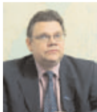
Puheenjohtaja Timo Soini

Nordea ..... 218518-148703 Sampo ..... 800013-70212996