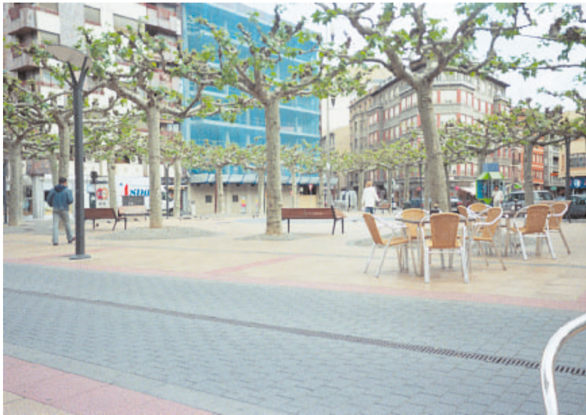
Leónin kaupungissa on paljon pieniä aukioita. Päivällä siesta tyhjentää kadut.

León the City on oikea ilmaus kuvaamaan Leónin kaupunkia Luoteis-Espanjassa. Ilmaisua ei voi kunnolla kääntää suo-