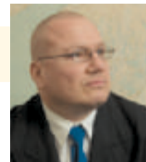
Tony Halme Kansanedustaja