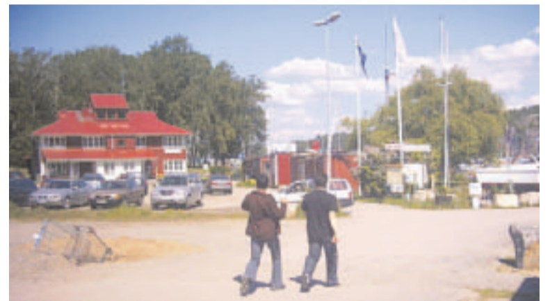
Marine Campingin alueella asuu paljon ulkomaalaisia.