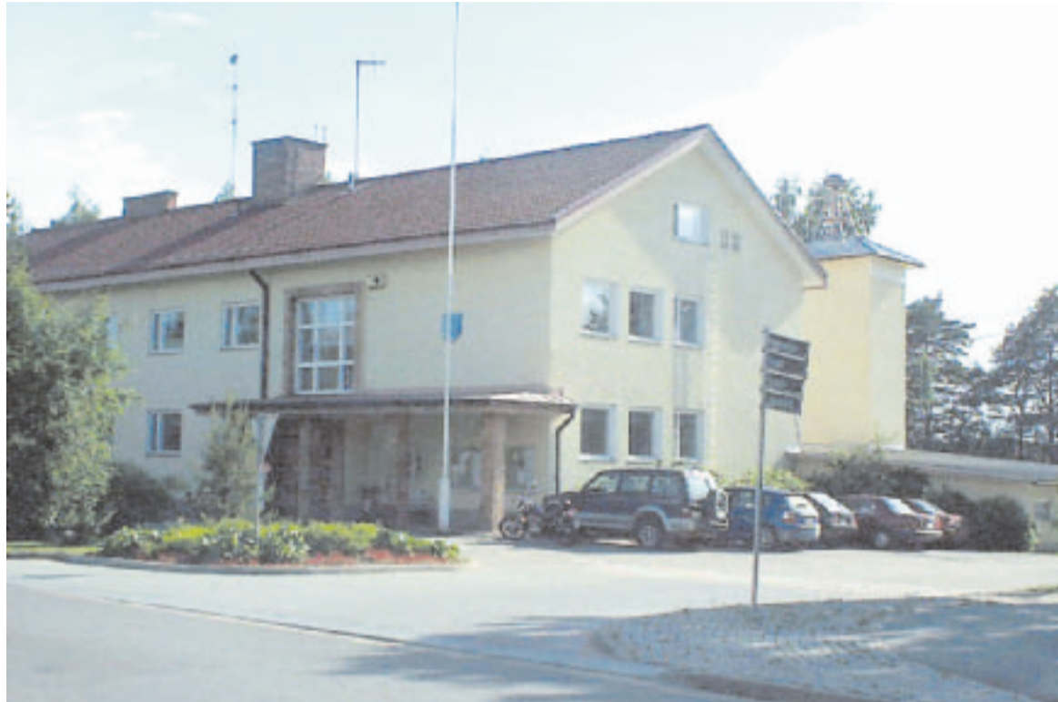
Sumiaisissa kunnantalokin on järven rannalla, keskellä kylää.