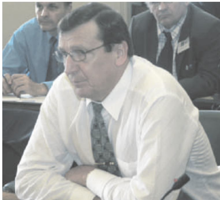
Raimo Vistbacka on huolissaan vanhus- ja vammaishuollosta.

Karmaisevimpia esimerkkejä tästä on vanhustenhoitolaitoksissa ja pitkäaikaishoidossa noudatettava virallinen vanhusten luokittelu neljään eri ryhmään, joista kahteen alimpaan ryhmään kuuluvia ei enää aktiivisesti hoideta vaan annetaan kuolla itsekseen pois. Näin menetellään julkisuudessa olleiden tietojen mukaan osissa maamme esimerkiksi toiseksi alimman luokan vanhusten osalta silloin, kun he saavat vaikkapa virtsa- tai keuhkoputkentulehduksen – elleivät sitten vanhusten omaiset ota ohjaksia käsiinsä.