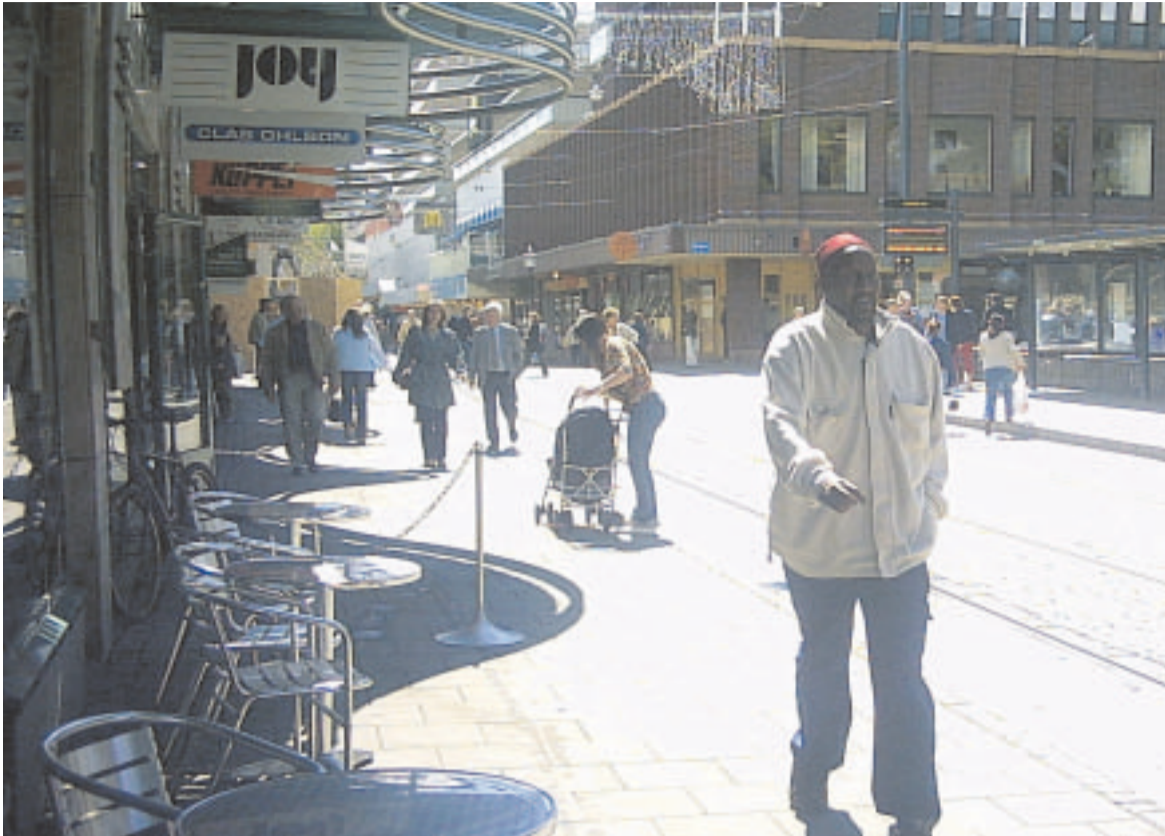
Ruotsalaista katukuvaa parhaimmillaan.

On olemassa vanha tarina Amerikan takamailta. Tuon tarinan mukaan alueen vahva mies, joka oli osallistunut aktiivisesti kotiseutunsa kulttuurin säilyttämiseen ja koko maansa talouselämän kehittämiseen, tuli haudatuksi suuren tammen alle, toiveidensa mukaan omille maille.