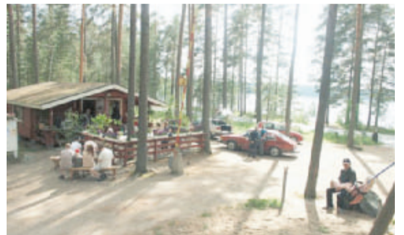
Kuokanniemen leirintäalue on myös paikallisten kokoontumispaikka. Lauluilloissa riittää tunnelmaa.

Uutena, ensimmäistä kautta istuvana valtuuston ja hallituksen jäsenenä olen saanut tämän vuoden aikana niin paljon tietoa, oppia ja näkemystä kunta-