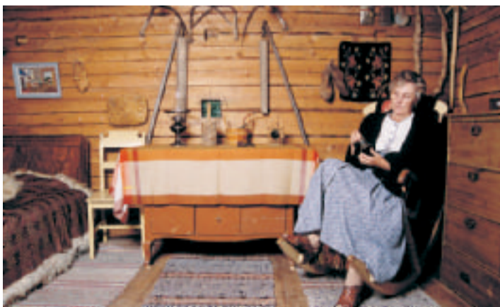
Vanhus- ja vammaishuolto puhuttaa.