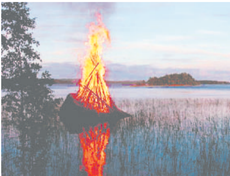
Järvi - kesä - juhannus - kokko. Se on Sumiainen!

Sumiainen ja sen monipuolinen luonto tarjoavat mieleen-painuvia elämyksiä. Sumiainen on ennen kaikkea kesäkunta, ja kesäasukkaat kuuluvat oleellisesti sen kuvaan; heitä odotetaan. Aivan kuin itse odotan pääskysten saapumista ja pesä-puuhien alkua.