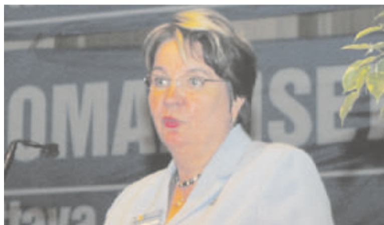
Auli Kangasmästä toinen varapuheenjohtaja.

Puoluekokousten paras anti on minulle aina ollut kuunnella erilaisten ihmisten erilaisia puheita. Ja niitähän on riittänyt. Nyt kuitenkin uusi tilanteeni vaatii minua menemään omieni eteen puheen kera. Se on paljon vaativampaa kuin mitä kotitan-