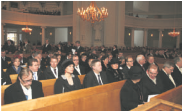
Valtiopäivien avajaiset alkavat ekumeenisella jumalanpalveluksella Helsingin tuomiokirkossa.