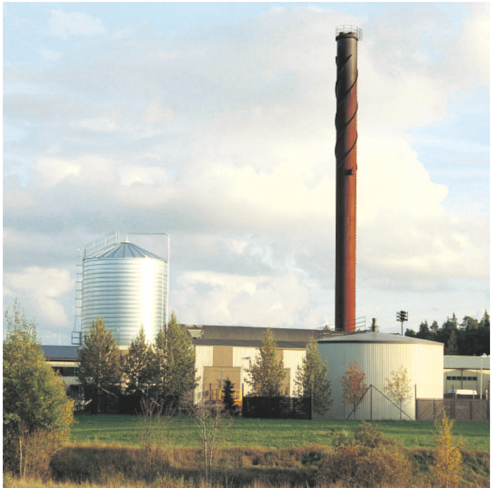
Myös Vapon Forssan kymmenen megawatin kaukolämpöä tuottava pellettilaitos lämpiää kokonaan pelleteillä.

Myös aurinkopaneelit voidaan yhdistää pellettilämmitykseen,