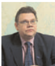
Puheenjohtaja Timo Soini

Nordea ..... 218518-148703 Sampo ..... 800013-70212996