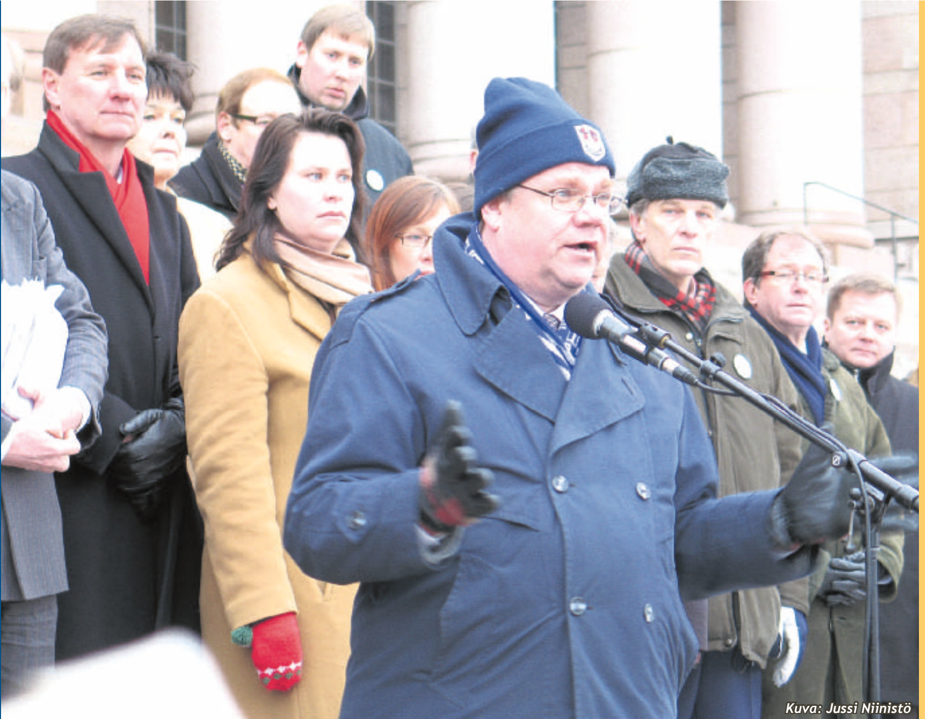
Kuva: Jussi Niinistö