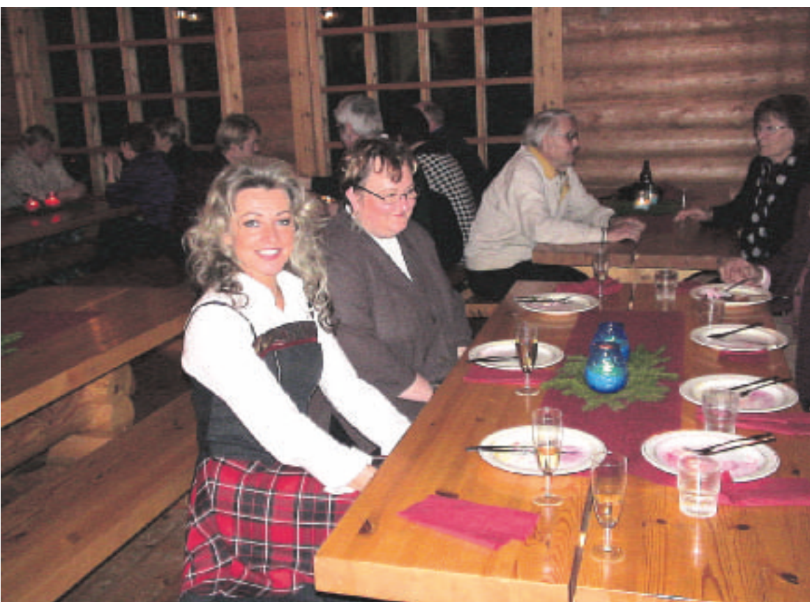
Mynämäen metsästysmaja täyttyi Juhaniin ystävästä.

Teksti: Harri Lindell