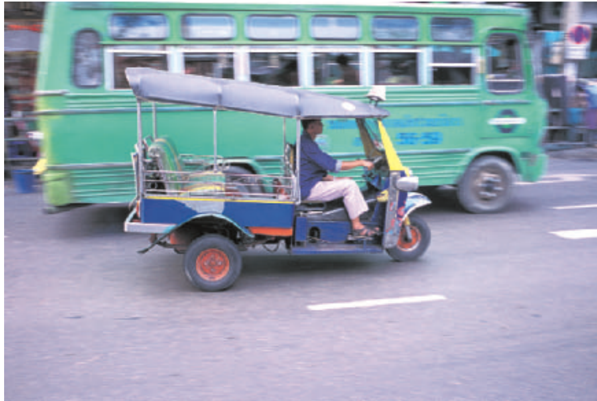
Autojen määrä lisääntyy Aasian maissa vauhdilla. Hiilidioksin määrä on rajussa kasvussa.

Joka hetki yli 5000 lentokonetta on ilmassa. Miljoonia laivoja seilaa merellä, jopa miljardi autoa liikkuu jatkuvasti maanteil-