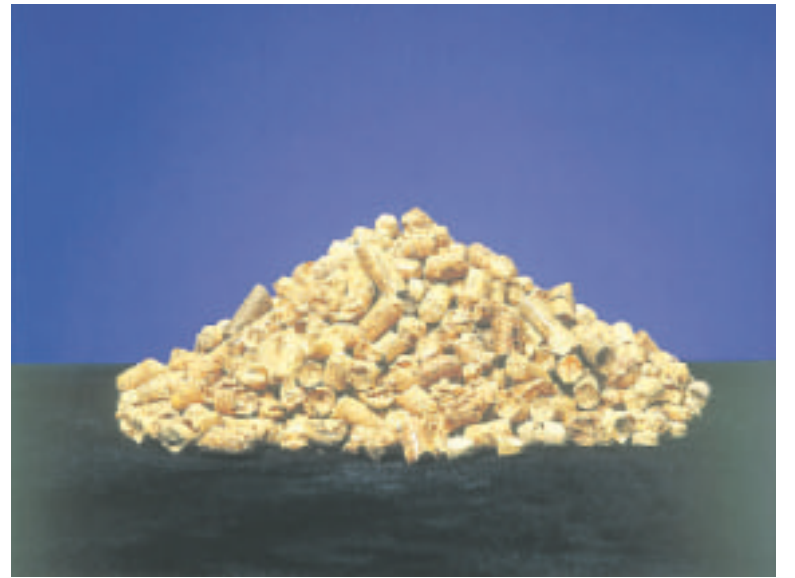
Pelletti on edullinen, ympäristöystävällinen ja täysin kotimainen polttoaine, jonka enempi käyttö vähentäisi myös Suomen riippuvuutta ulkomaisesta tuontienergiasta.