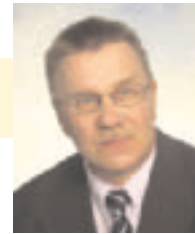
Pentti Oinonen kansanedustaja 1. varapj PerusSuomalaiset

Suomalainen metsäteollisuus on viime vuosina painanut historiansa pahimmassa kriisissä. Perinteisesti metsäteollisuus ja sen tuotteet ovat olleet suomalaisten hyvinvoinnille merkittävä tulonlähde. Kuitenkin viime vuosien aikana valtio on myynyt enemmistöomistuksiaan näissä yhtiöissä ja uusia ulkomaisia omistajia on tullut tilalle keräämään miljardivoittoja sekä kultaisia kädenpuristuksia.