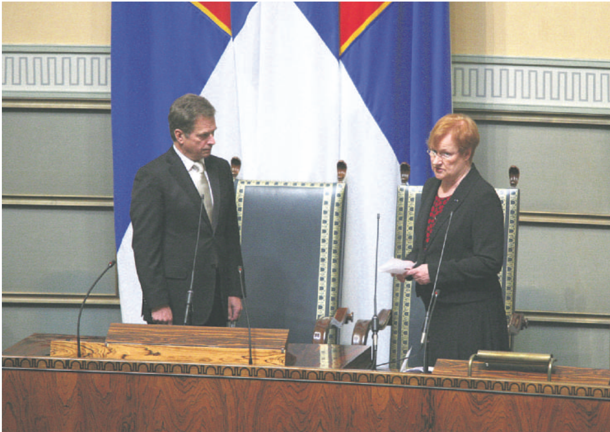
Valtiopäivien avajaiset noudattavat perinteistä kaavaa. Osana niihin kuuluvat tasavallan presidentin ja eduskunnan puhemiehen pitämät puheet.

Suomen valtiopäivien historia on pitkä ja mielenkiintoinen. Suomi saa kiittää suurvaltapolitiikkaa omasta kansanedustuslaitoksestaan yhtä hyvin kuin koko valtiollisesta olemassaolostaan.