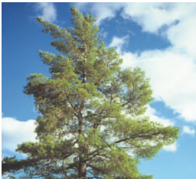
Keskustelu puukuidusta saa uusia muotoja.