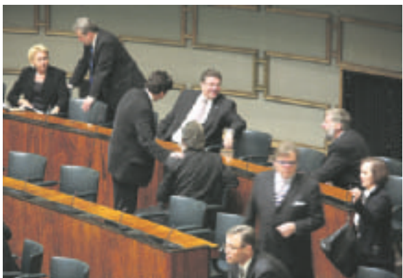
Valtiopäivien avajaisia vietettiin 4.2.