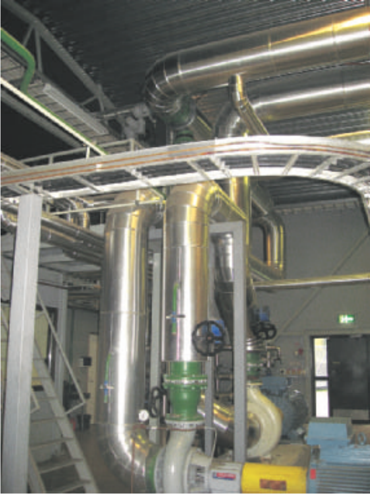
Suuren kokoluokan lämpölaitoksissa pelletti vähentää huoltotarvetta ja parantaa palotulosta.

räseinäjoella, Haapavedellä, Kärämäellä ja Ylistarossa. Lisäksi Vapolla on sopimuskumppanivalmistajia Keminmaalla, Juupajoella ja Parkanossa. Ruotsissa Vapolla on neljä omaa tehdasta, Puolasassa kaksi ja Tanskassa sekä Virossa yksi kummassakin.