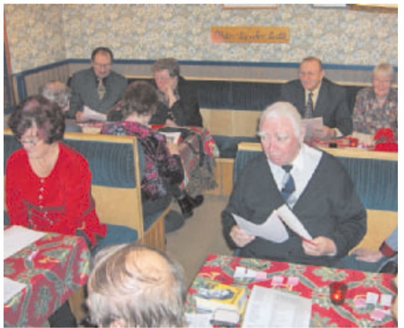
Joululauluja laulettiin ennen arpajaisia.