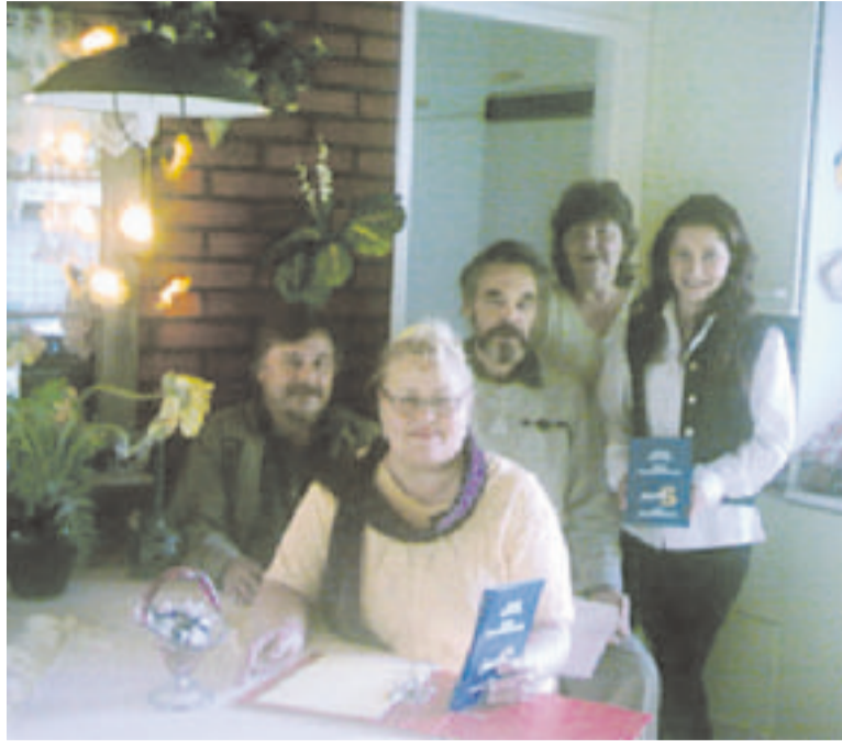
Kunnallisjärjestön perustajilla oli hymy herkässä.