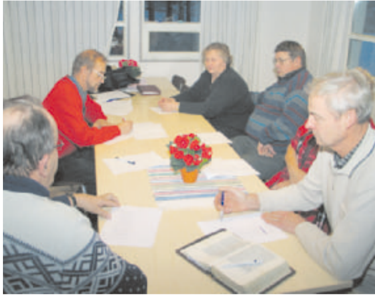
Puolueen kristillinen toimikunta kokoontui leppoisassa tunnelmassa Rauhalan kokoustiloissa.

Kristillisen toimikunnan mielestä nykyinen eläkeläisiä kurjistava politiikka, taloudellisen aseman heikkeneminen ja palveluiden karsiminen sotii