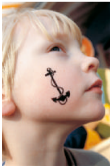
Niin sanotut ankkurilapset ovat yksi ongelma pakolaispolitiikassa.

Meillä oli myös viime vuonna yhteensä 1100 henkilöä, jotka Suomeen päästyään jossakin vaiheessa katosivat jäljettömiin ja viranomaisten tavoittamattomiin. Sopivasti ennen kuin 365