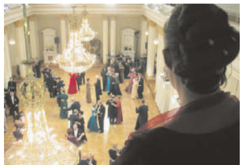
Loppuillasta linnan juhlien parketilla oli tilaa.