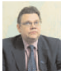
Puheenjohtaja Timo Soini

Nordea ..... 218518-148703 Sampo ..... 800013-70212996