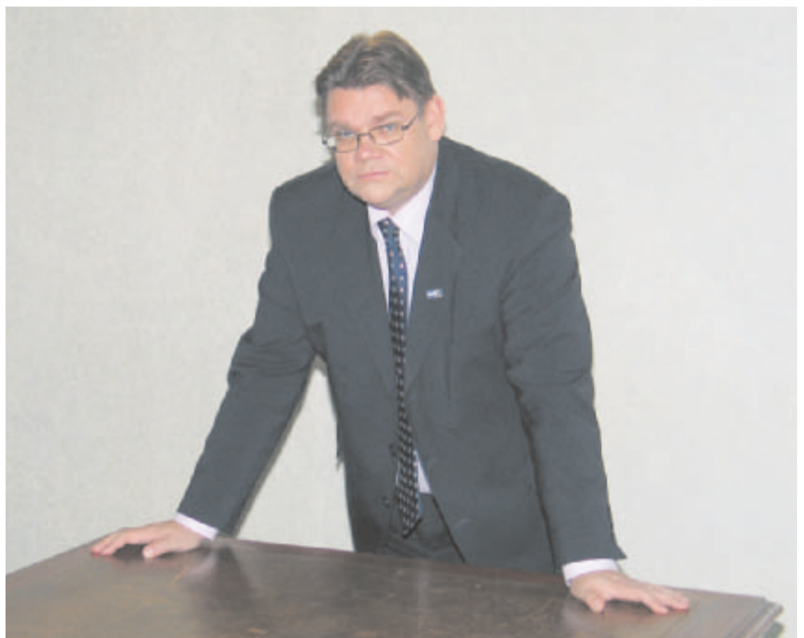
Suomeen pitäisi perustaa perustuslakituomioistuin, toteaa Timo Soini.

Suomessa pitäisi olla poliittisesti riippumaton perustuslakituomioistuin, joka ratkaisee lakien perustuslakienmukaisuuden. Tämä tuomioistuin olisi selkeästi päivän politiikan ulko- ja yläpuolella ja toimisi siten todella riippumattomana tuomioistuimena.