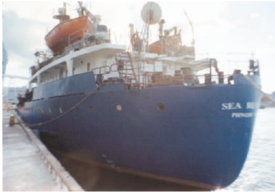
Kuvan mukavuuslippulaiva ei liity tapaukseen.

Pian he huomaavat, ettei heidän asiansa ole kiinnostunut ajamaan kukaan. Siitä eivät ole kiinnostuneet yksityiset asianajajat, yleiset syyttäjät eikä liioin