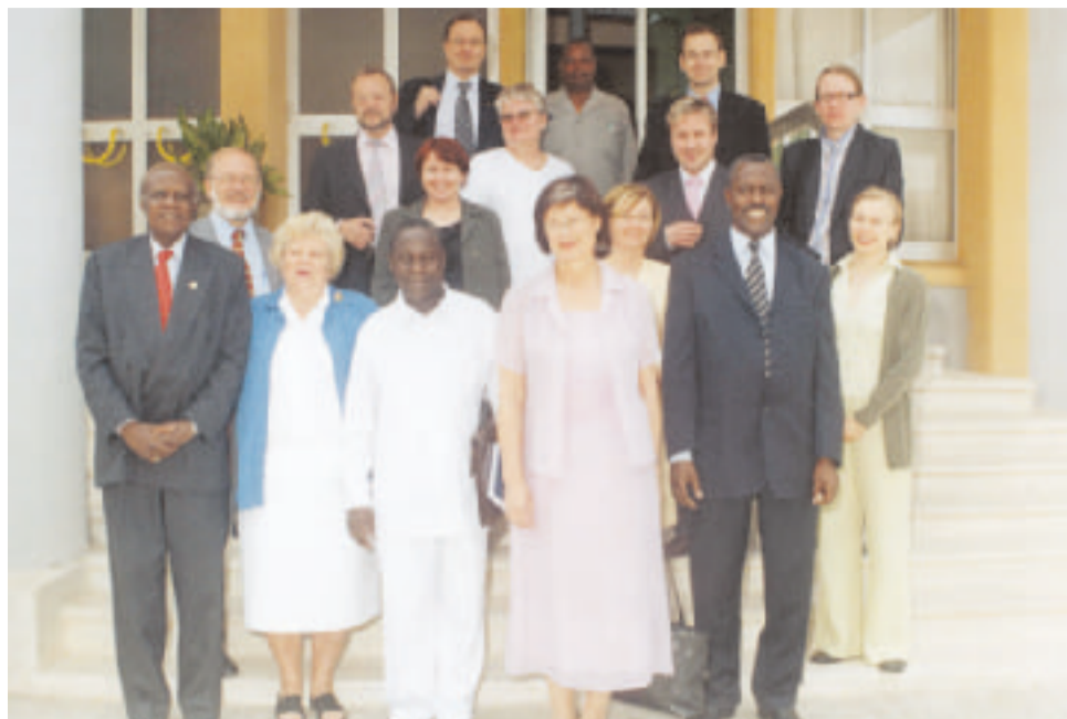
Ryhmämme Tansanian parlamenttitalon edessä.

Viime kunnallisvaalien aikana kävivät tansanialaiset poliitikot aloittamassa eduskuntiemme yhteisen demokratiahankkeen. Heille oli käsittämätöntä, että vaalipaikoilla Suomessa ei ollut sotilaita aseineen valvomassa ja että ehdokkaat olivat itse vaalipaikoilla vaalityöntekijöi-