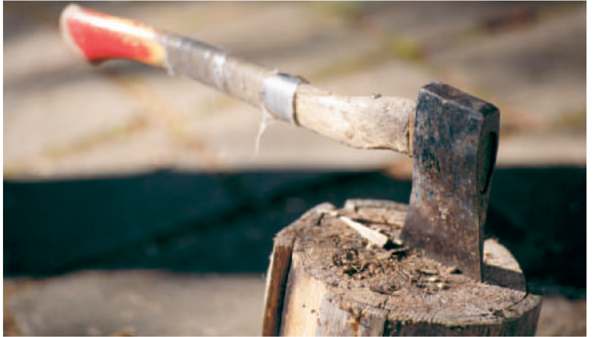
Kirveellä riittää töitä näin koneistettunakin aikana.

Suomen EU-jäsenyys on täynnä erilaisia ns. torjuntavoittoja. Viimeinen torjuntavoitto oli sokerintuotannon puolittaminen Suomessa. Samanlainen ns. torjuntavoitto oli tämä nyt käsitellyssä oleva kahteen kertaan hylätty perustuslakiluonnos, jossa jyrättiin kaikki Suomen keskeiset neuvottelutavoitteet. Seuraavakin torjuntavoitto on