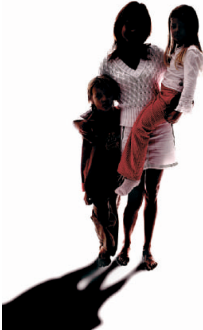
Ovatko hekin kadonneet Suomen pakolaiskeskuksesta?

Kun te nyt niin paljon siitä EU:sta aina vouhotatte, niin voisiko nyt olla kerrankin niin,