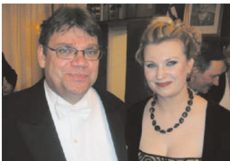
Aviopari Timo ja Tiina Soini viihtyivät hyvin linnan juhlissa.

Juhlimassa olivat myös Raimo Vistbacka puolisoineen, Tony Halme ja kampanjapäällikkö Jussi Niinistö , joka näppäsi oheisen kuvan Linnan kirjastohuoneen tungoksessa.