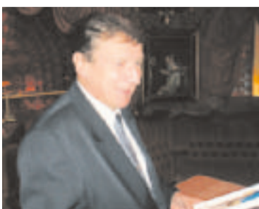
Raimolla kunnioitettavat 60 ikävuotta täynnä.

Perussuomalaisten eduskuntaryhmän puheenjohtaja, kansanedustaja Raimo Vistbacka täytti lokakuussa 60 vuotta. Sen kunniaksi järjestetyillä päivällisillä puolueen puheenjohtaja Timo Soini luovutti hänelle Peruss-standaarin numeroidulla hopealaatalla. Vistbackan standardin numero on luonnollisesti yksi.