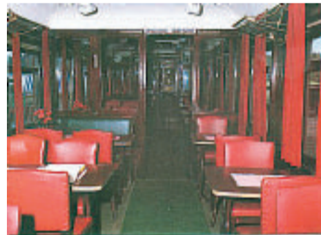
Vasemmalla olevan pöydän ääressä neuvottelivat Mannerheim ja Hitler 4.6.1942.