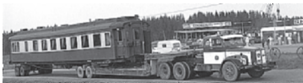
Näin saapui Marskin salonkivaunu Keihäsen pihalle 1969.