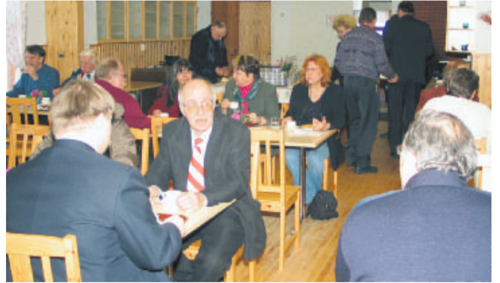
Koulustilaisuuden väliaikoina ruokasalin maittavat kattaukset saavat veden nousemaan kielelle.