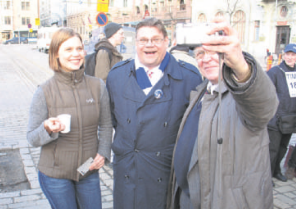
Timo Soinin oli helppo hymyillä, kun Perussuomalaisten kannatus oli nousussa ennen vaaleja.