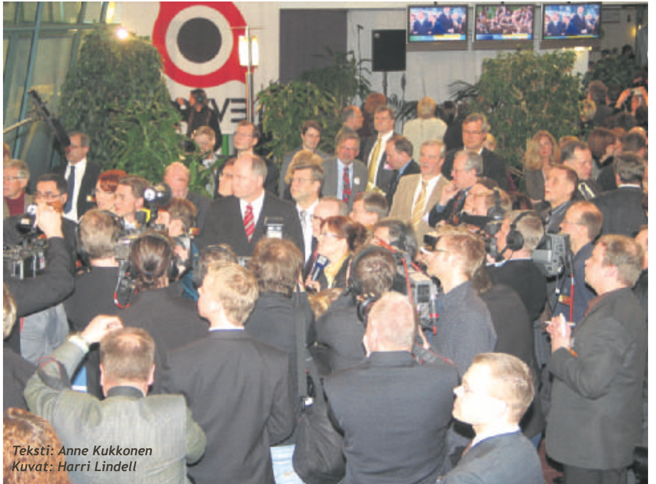
Teksti: Anne Kukkonen

PerusSuomalaiset juhlivat ja vaaleja käytiin läpi moneen kertaan. Usko puolueen tulevaisuuteen ja vahvaan nousujohteeseen oli käsinkosketeltavaa.