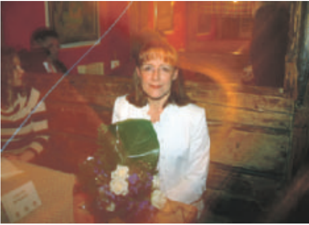
Uutta naisenergiaa eduskuntaan: Pirkko Ruohonen-Lerner Uudeltamaalta.