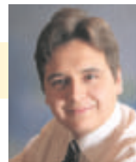
V-P Kortelainen tiedotussihteeri Oulun ja Kainuun piiri ry.

Perussuomalaisten Oulun ja Kainuun piiri lähti vaalivaiheeseen hyvin vähällä eväillä. Vaalivaiheeseen lähdettiin varsin ohuella kärjellä. Sekä toimijoita että rahaa puuttui, mutta väki teki parhaansa. Rahoitusta ei alkuun ollut nimeksikään, eikä puolueeltakaan paljoa liennyt, mutta loppujen lopuksi ehdokkaat ja heidän tukijansa saivat kuin saivatkin raavittua kassaan riittävästi rahaa. Vähäiset resurssit näkyivät kuitenkin mm. näkyvyysongelmina ja organisaation puutteina, sillä omien kampanjoitensa ohella ehdokkaista monet olivat myös piirin toimihenkilöitä.