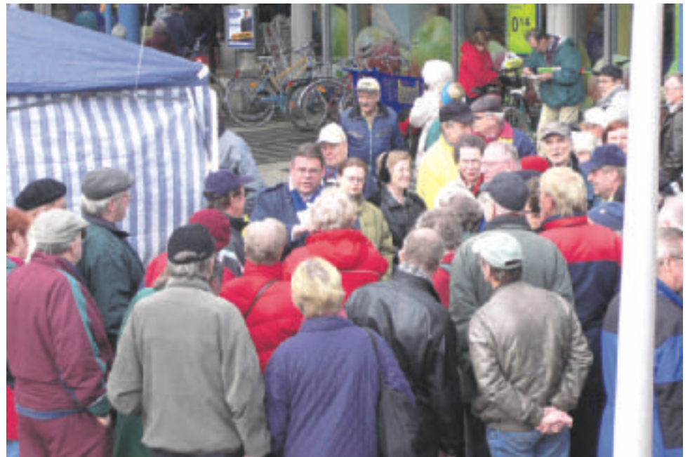
Puheenjohtaja Timo Soinin sanoma kiinnosti äänestäjiä Vantaan Myyrmäessä 16.3.2007.