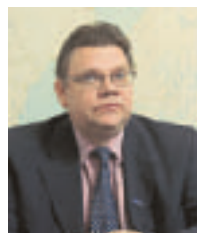
Puheenjohtaja Timo Soini

Nordea ..... 218518-148703 Sampo ..... 800013-70212996