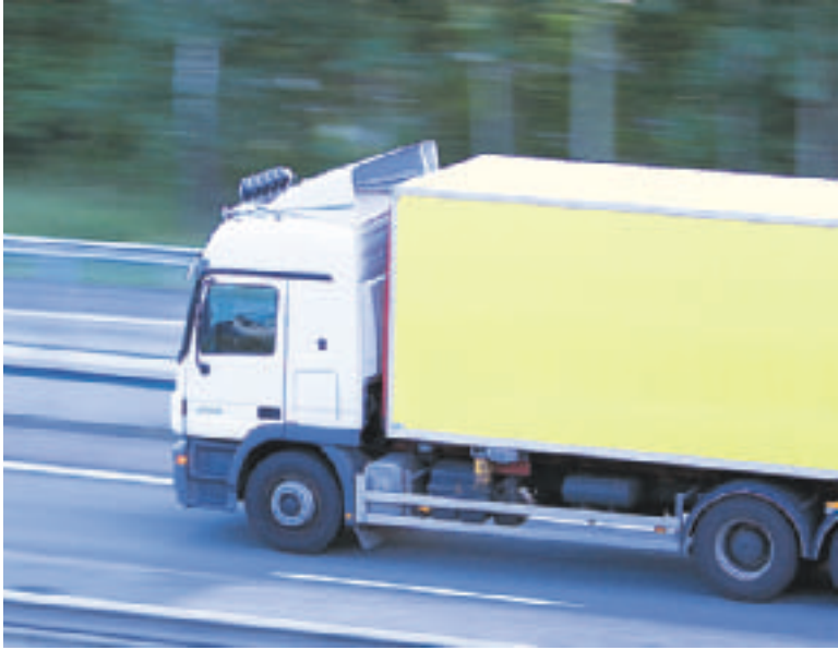
Ovatko rekkaparkit ilmainen lahja Venäjälle?