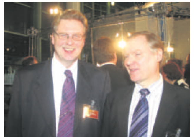
Päätoimittajat iloitsevat hyvästä vaalituloksesta.