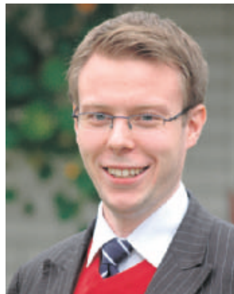
Vesa-Matti Saarakkala Perussuomalaisten 1. varapuheenjohtaja

Saimme varmasti herätettyä näissä vaaleissa myös muutaman nukkuvan ja luulensa, että moni niistä, jotka näissä vaaleissa eivät vielä heränneet, virkoavat jatkossa uurnille äänestämään Perussuomalaisia. Valtakunnallisissa Nuorisovaaleissa Perussuomalaisten saama 7,7 prosentin kannatus kertoo siitä, että tulevaisuuden näkymät ovat siltäkin osin entistä valoisimmat.