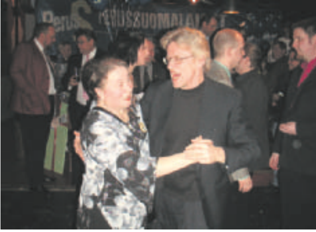
Illanvietossa laitettiin jalalle koreasti.