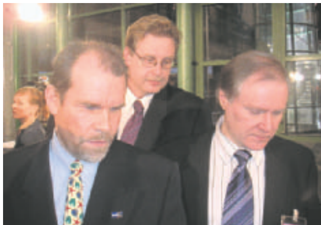
Vaalituloksen seuraaminen jännitti.