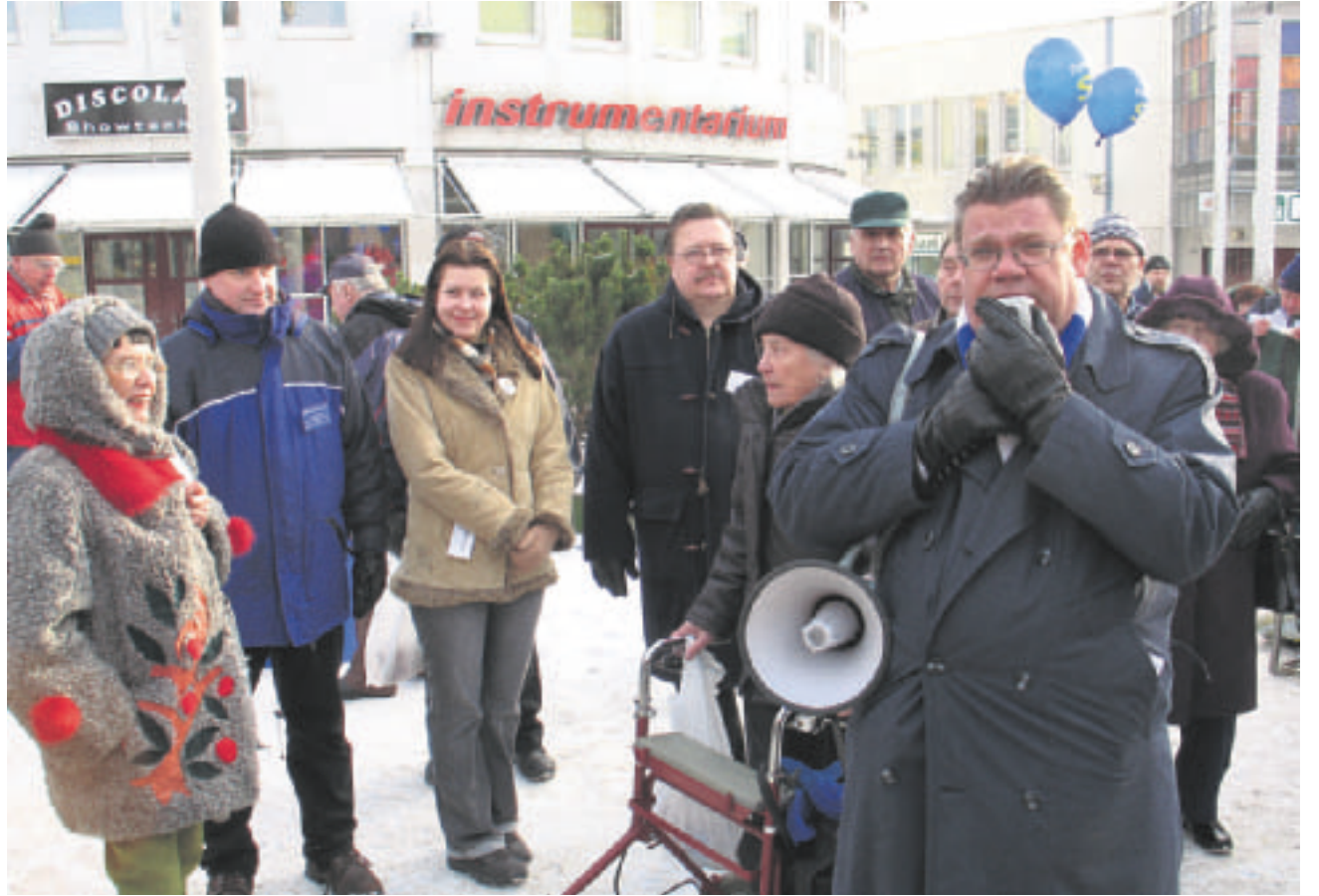
Perussuomalaisten vaalikampanja käynnissä. Puheenjohtaja Timo Soini ja helsinkiläisiä PerusS-ehdokkaita Kontulassa 17.2.2007.