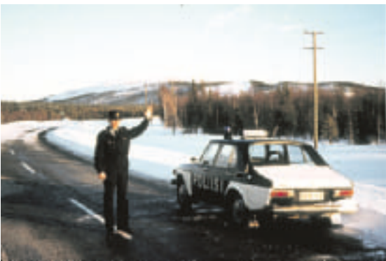
Poliisimuseo avaa ovensa ensi vuonna Tampereella. Tähän asti Suomi onkin ollut ainoa läntinen maa, jossa ei ole omaa poliisimuseota.