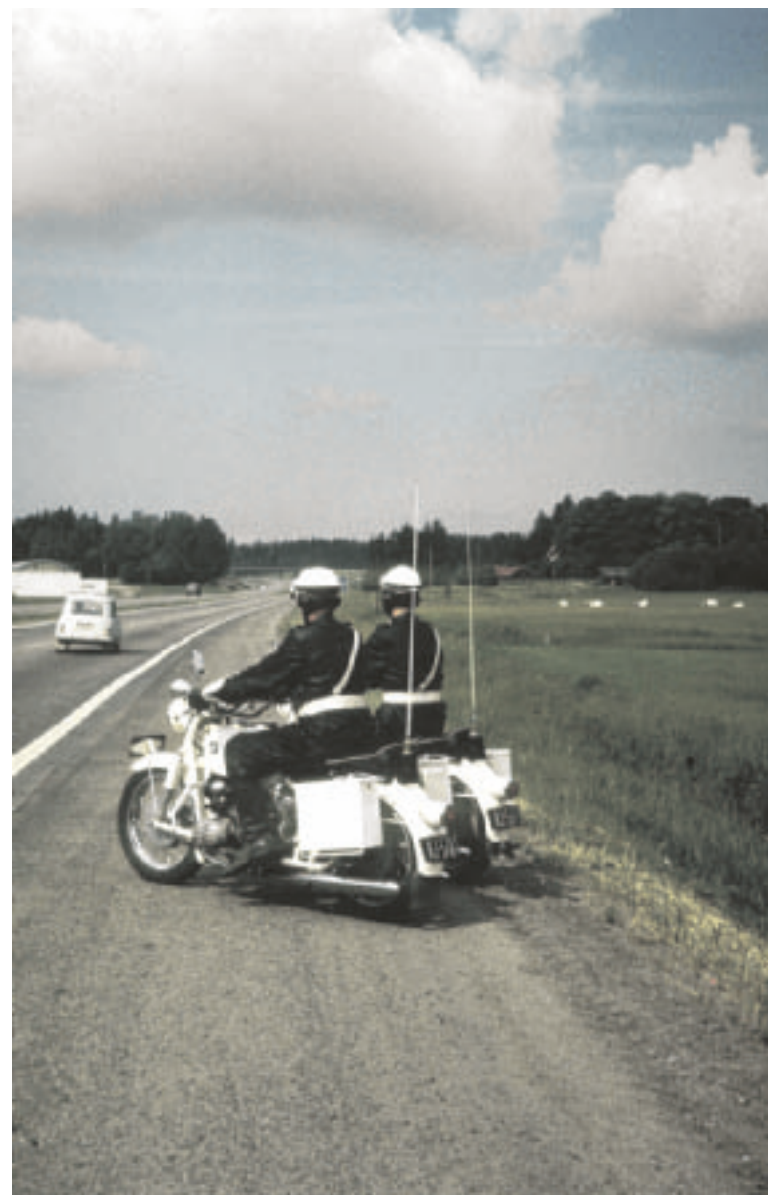
Nopeita poliiseja. Muistattehan nämä valkeat enkelit?