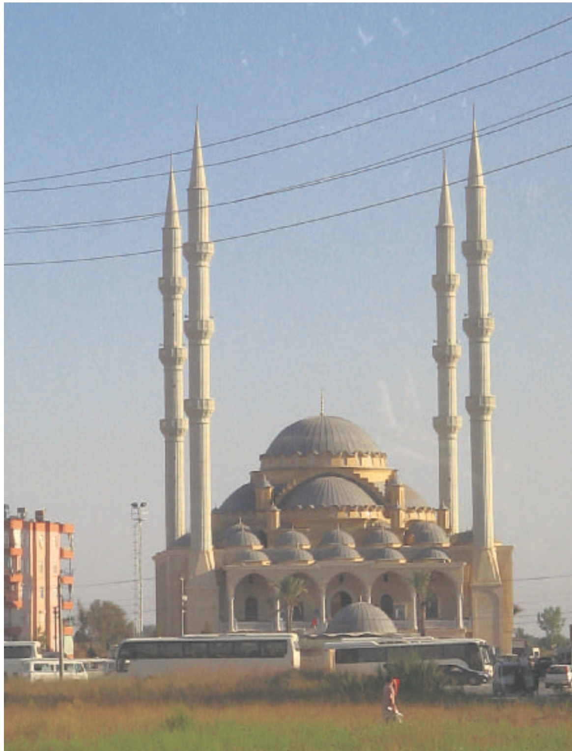
Maailman kolmanneksi suurin moskeija Mangvatin kaupungissa.

Melkein puolet Turkin asukkaista työskentelee maataloudessa. Perhemaatalous hyvin alkeellisilla välineillä on varsinkin sisämaassa hyvin tavallista. Valtio oli 90-luvulle saakka lähes monopolioimistaja teollisuusyrityksissä. Sen jälkeen yksityiset ovat voi-