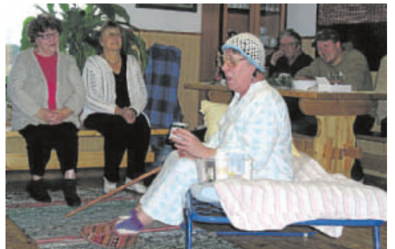
Illan ohjelmassa oli myös huumoria.