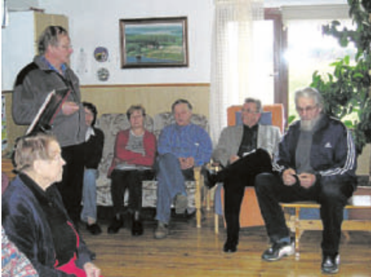
Tupaillan isäntä toivotti väen tervetulleiksi.