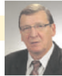
Raimo Vistbacka kansanedustaja Perussuomalaiset

Kuluvana vuonna ja erityisesti viime aikoina metsät, metsäteollisuus ja sen puuhuolto ovat olleet toistuvasti esillä – välillä myönteisessä, välillä kielteisessä sävyssä. Ilmassa on lennellyt syytöksiä suuntaan jos toiseenkin.