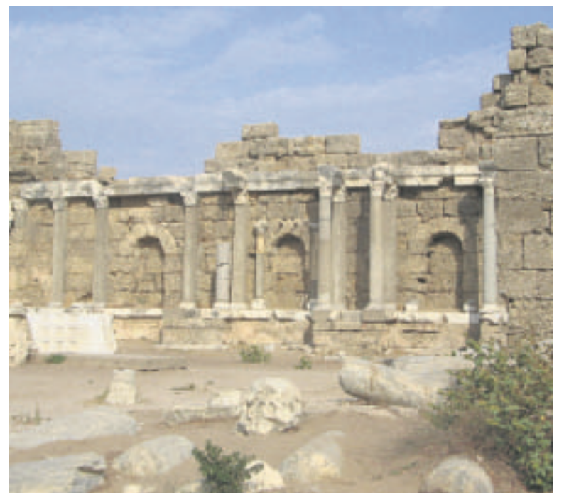
Siden kaupungissa on runsaasti jopa 1200-luvulta saakka säilyneitä linnoitusten raunioita.

tinusko ovat alunperin sukulaisuuskontoja. Molemmilla on monia yhteisiä arvostuksen kohteita. Allah on ainoa Jumala ja Muhammed hänen profeettansa. Jeesusta kunnioitetaan yhtenä Jumalan profeettana.