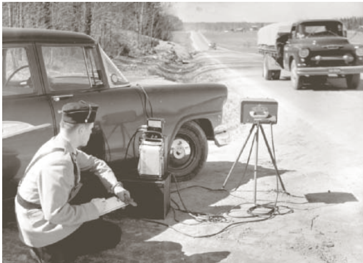
Poliisi "puskassa". Tällaisessa tilanteessa melkein jokainen suomalainen on kohdannut vuosien varrella poliisiin.