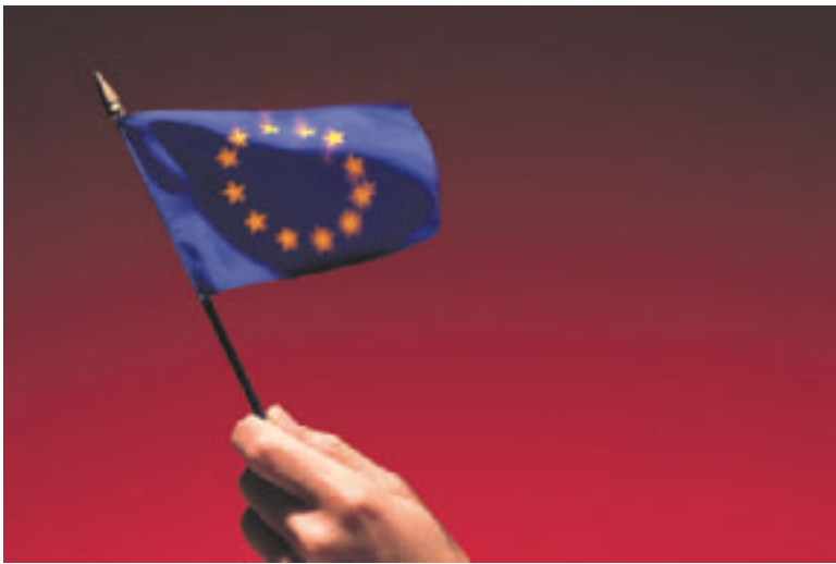
Monen lukijamme mielestä EU:n lippua ei kannata kovin ylväästi heilutella.