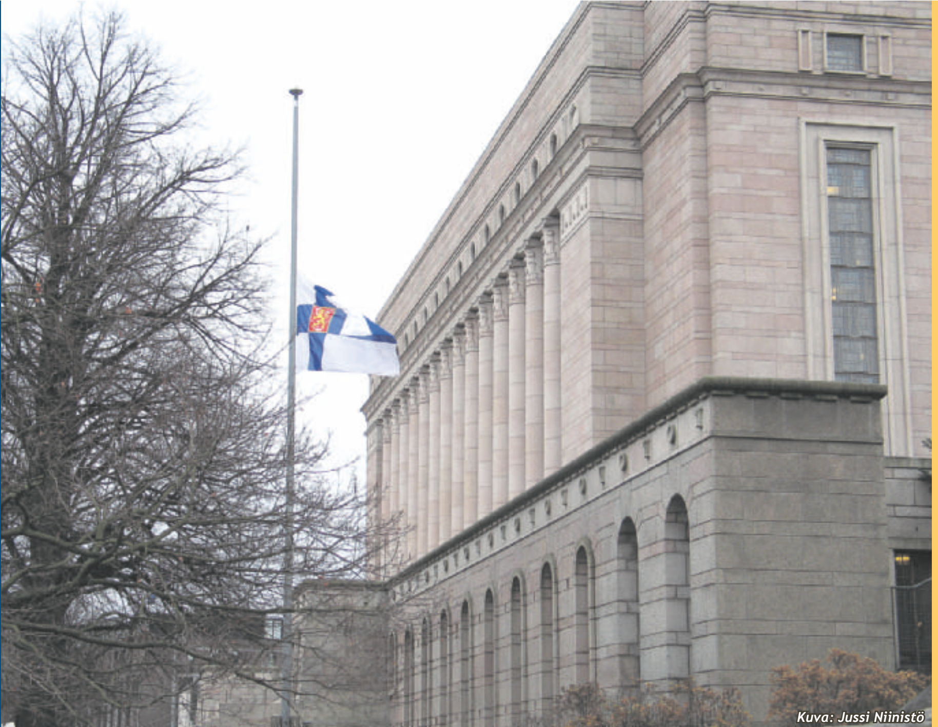
Kuva: Jussi Niinistö