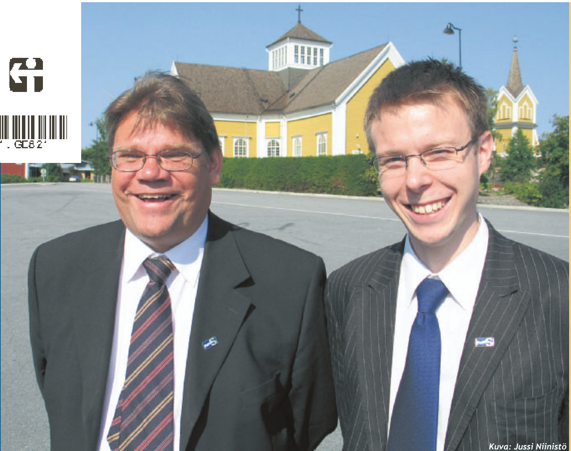
Kuva: Jussi Niinistö