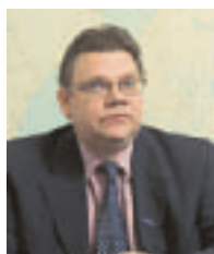
Puheenjohtaja Timo Soini

Nordea ..... 218518-148703 Sampo ..... 800013-70212996