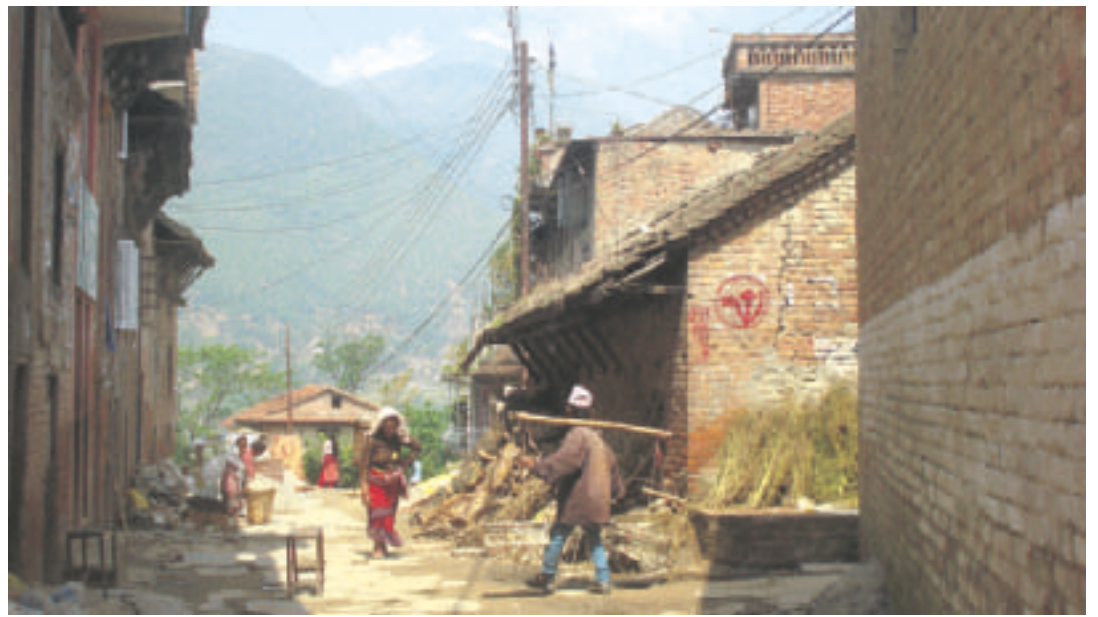
Khokana. Kylään tulee jo sähkö, kuten kuvasta näkyy (sähköä saa vain 20% maan asukkaista).