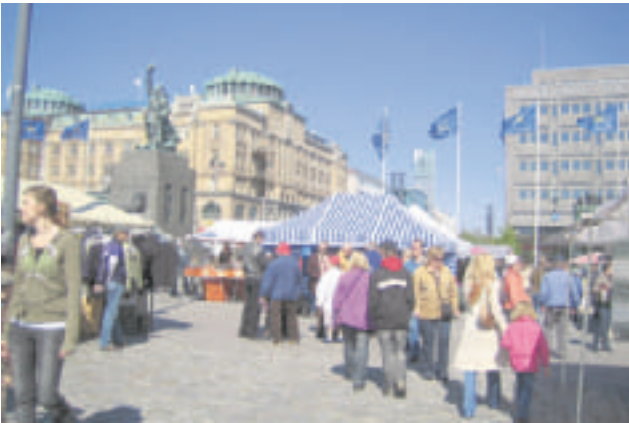
- Yleiskuva Vaasan torilta 24.5. Perussuomalaisten sinivalkoinen teltta näkyy taustalla.