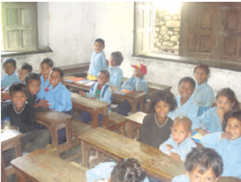
Ekaluokkalaisia vuoristokylässä. Nepalissa puolet väestöstä osaa lukea. Osa kylän lapsista ei käy koulua, sillä vanhemmilla ei ole varaa maksaa kolmen euron arvoisia kuluja koko ala-asteesta.

Lauantaina 10.5. kävin ennen lähtöä kiertelemässä muutaman kaupan, jos olisin jotain mielenkiintoista löytänyt. Hyvin vähän oli yleensäkin mitään ostettavaa turistikrääsää ja kankaita lukuun ottamatta. Edessä oli vielä vuorokauden pituinen matka toiseen kulttuuriin, kotoisaan ja puhtaaseen Suomeen, jonne oli antoisan viikon jälkeen mukava palata.