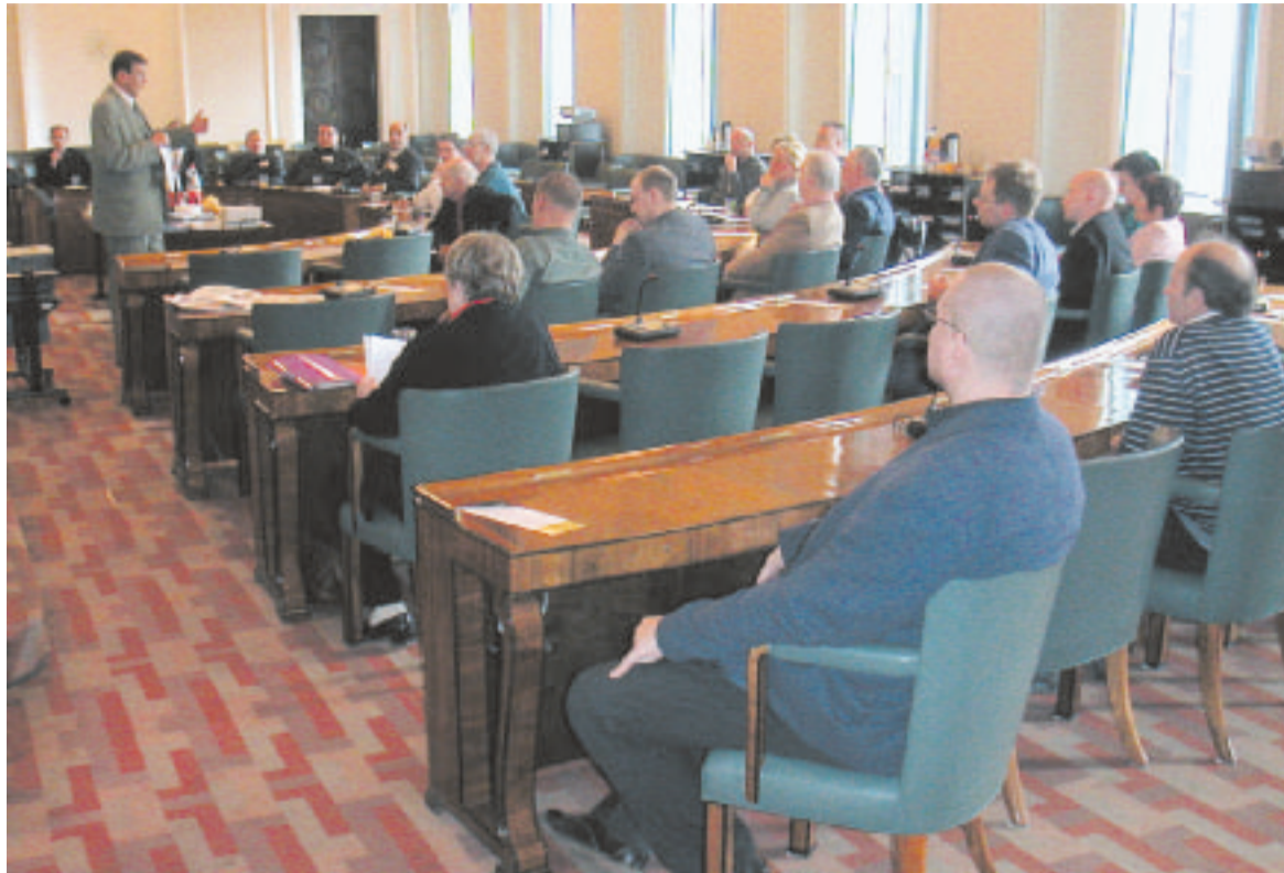
Uudenmaanpiirin kokouksessa Raimo Vistbacka kertoi ajankohtaista asiaa Eduskunnasta.