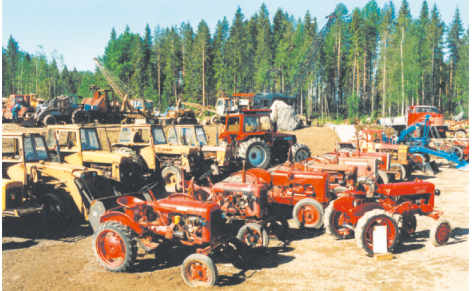
Kuvassa Jehu -Valmetin ensimmäinen traktori sekä Valmetin mallisto aina 70-luvun loppuun saakka.