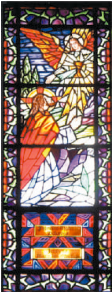
Fortalzan katedraalissa on upeita lasimaalauksia

Brasilia on monen kaukomatkaajan unelmakohde. Sitä se oli myöskin allekirjoittaneen ja vaimoni osalta. Monet unelmat karisevat silloin kun todellisuus lyö kättä unelmien kanssa.