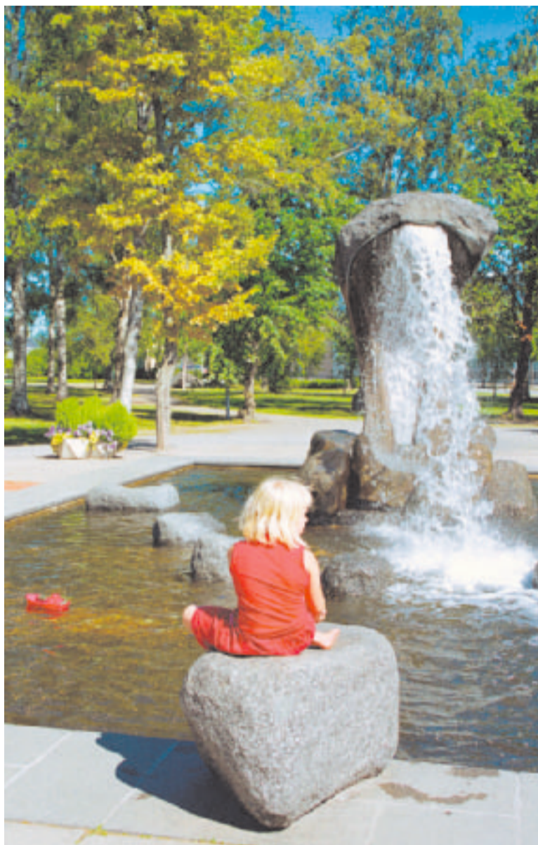
Kokkola on hyvä paikka asua ja yrittää.

Kokkolan rannikon erittäin runsas ja moni-ilmeinen saa-