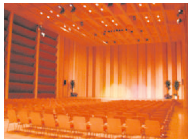
Tässä salissa tehdään tärkeitä henkilövalintoja 18.-19.6.2005.

Huom! Kokouksen puheenjohtajan harkinnan mukaan voidaan tarpeen vaatiessa poiketa käsittelylistan järjestyksestä paitsi henkilövalintojen valintajärjestysten kohdissa.