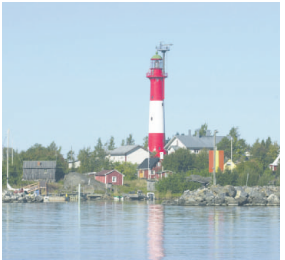
Kuva Tankarin majakkasaaren satamasta.