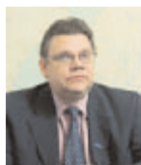
Puheenjohtaja Timo Soini

Nordea ..... 218518-148703 Sampo ..... 800013-70212996