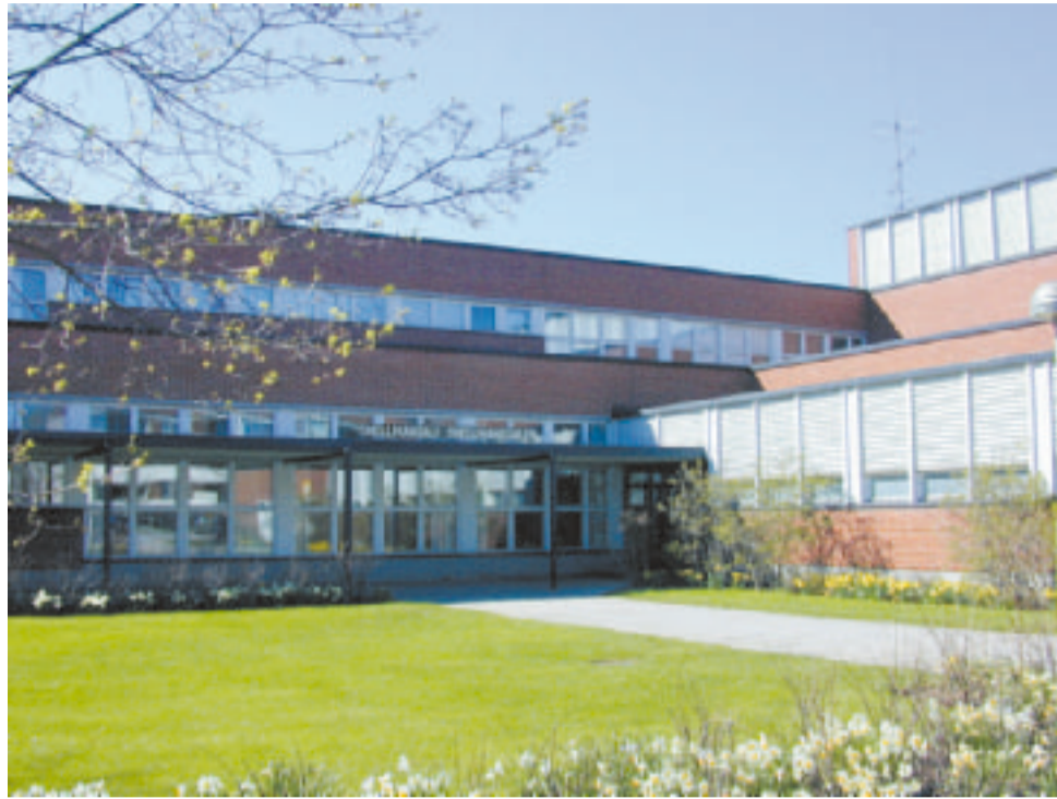
Snellman -sali kutsuu puoluekokousväkeä.

Tervetuloa kaikki jäsenet läheltä ja kaukaa.