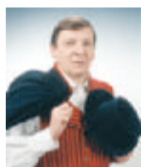
1. varapuheenjohtaja Raimo Vistbacka