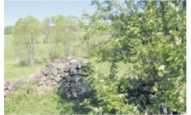
Karjalaan jäi yli 39 000 rekisteröityä suomalaistilaa tai maa-aluetta. Viljelyn puutteessa osa pelloista on pusikoitunut. Kuvan maisema on Heinjoen pitäjän Koprulan kylästä, Teivosen talon pihasta, noin 40 kilometriä Viipurista kaakkoon.

Palautuksen myötä Laatokasta on saatavissa huomattava matkailukohde koko Eurooppaa ajatellen. Euroopan suu-