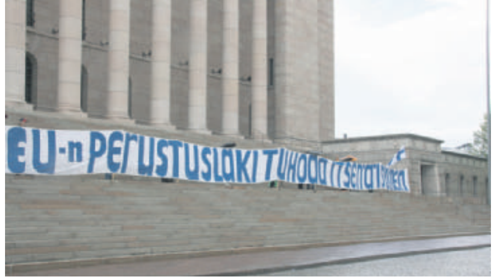
Eduskunnan edessä oli mielenilmaisu sopimuksen hylkäämisen puolesta.