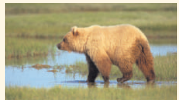
(Kuvan karhu ei liity Heinjoella nähtyyn otukseen.)

Hollolassa asuva Terhi Koivisto valokuvasi samalla matkalla jäljen, joka kokonsa ja muotonsa mukaan näyttää suden jäljeltä. Tarkemmin asiaa ei voinut varmentaa paikan päällä.