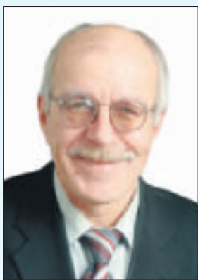
Jorma Uski kaupunginvaltuutettu Jyväskylässä