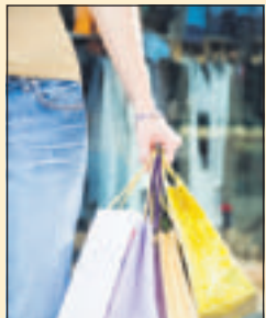
Farkut 470 mk

Suoraan markkoiksi muutettuina monien tuotteiden ja palveluiden hinnat näyttävät hurjilta. Alla satunnaisia poimintoja kaupungilta: