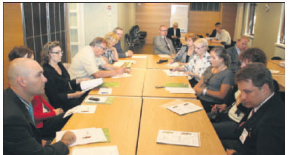
Miksi sonninliha maksaa kaupoissa enemmän kuin lehmänliha? Tähän ei oikein löytynyt vastausta, sukupuolisesta epätasa-arvosta ei varmaankaan tässä ole kysymys.

epäreilu kilpailu. Vapaa markkinatalous liha-alalla tulee jatkossa nostamaan entisestään lihan hintaa, yleisössä arvioitiin. Pitäisiköhän nyt Suomessa noudattaa Ranskan esimerkkiä?