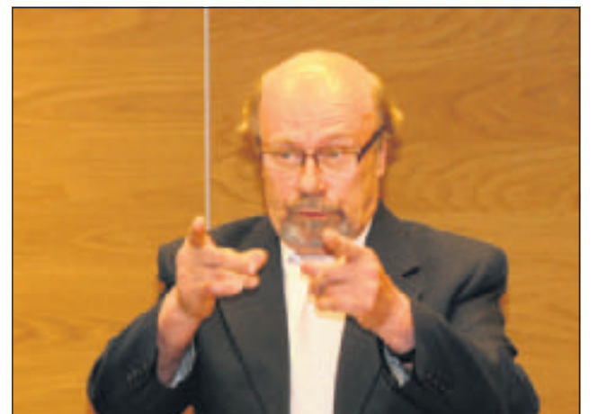
Juha Väättäinen täytti 70 vuotta.

Kansanedustajien eduskuntatyö jatkuu tiistaina 6.9., jolloin istuntokausi eduskunnassa alkaa.