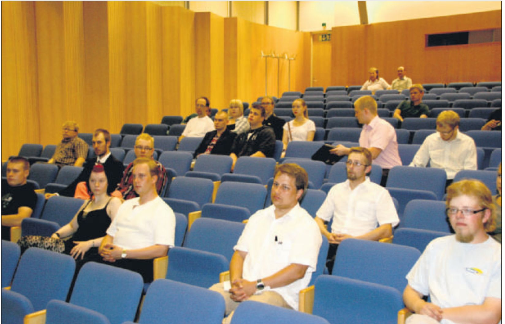
Perussuomalaiset Nuoret kokoontuivat Oulun kaupunginkirjaston auditorioon.

Turvallisuus on yhteiskunnassa perusoikeus. Maan turvallisuus jaetaan sisäiseen ja ulkoiseen turvallisuuteen. Sisäisen turvallisuuden tarkoitus on suojella väestöä rajojen sisäpuolella, ja siihen kuuluvat esimerkiksi poliisi ja palo- sekä pelastustoimi.