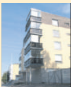
Asuntojen keskihinta Pirkanmaalla 11 594 mk/m 2