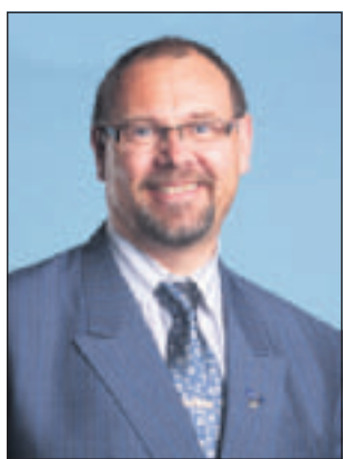
Reijo Hongisto kansanedustaja

Kataisen sateenkaarihallitus linjasi tavoitteensa ja ohjelmansa näyttävästi. Meille luvataan avoin, oikeudenmukainen ja rohkea Suomi.