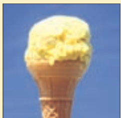
Jäätelöpallo kioskilta 16 mk