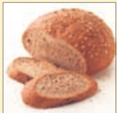
Moniviljaleipä 350g 16 mk