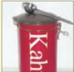
Kahvipaketti 29 mk

Suoraan markkoiksi muutettuina monien tuotteiden ja palveluiden hinnat näyttävät hurjilta. Alla satunnaisia poimintoja kaupungilta: