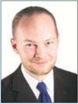
Sampo Terho europarlamentaarikko

Euroopassa etsitään kiivaasti pelastusta taloudelliselta perikadolta, joka hämmöittää jo kaikkein optimistisimpienkin poliitikkojen peloissa. Keinojen vähetessä on viime aikoina velkakriisin ratkaisuksi yhä useammin alettu esittää eurobondeja. Mitä ne ovat ja mikä niiden vaikutus olisi Suomelle?