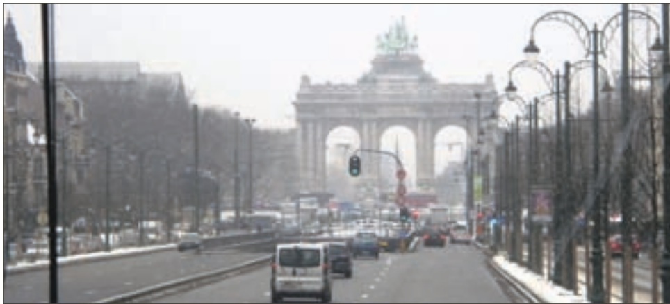
Belgijalla oli orjatyömaat Afrikassa ja niillä rahoilla on rakennettu Brysselin palatsit.

Kyllä, minä olen sitä mieltä, että heikompa tulee