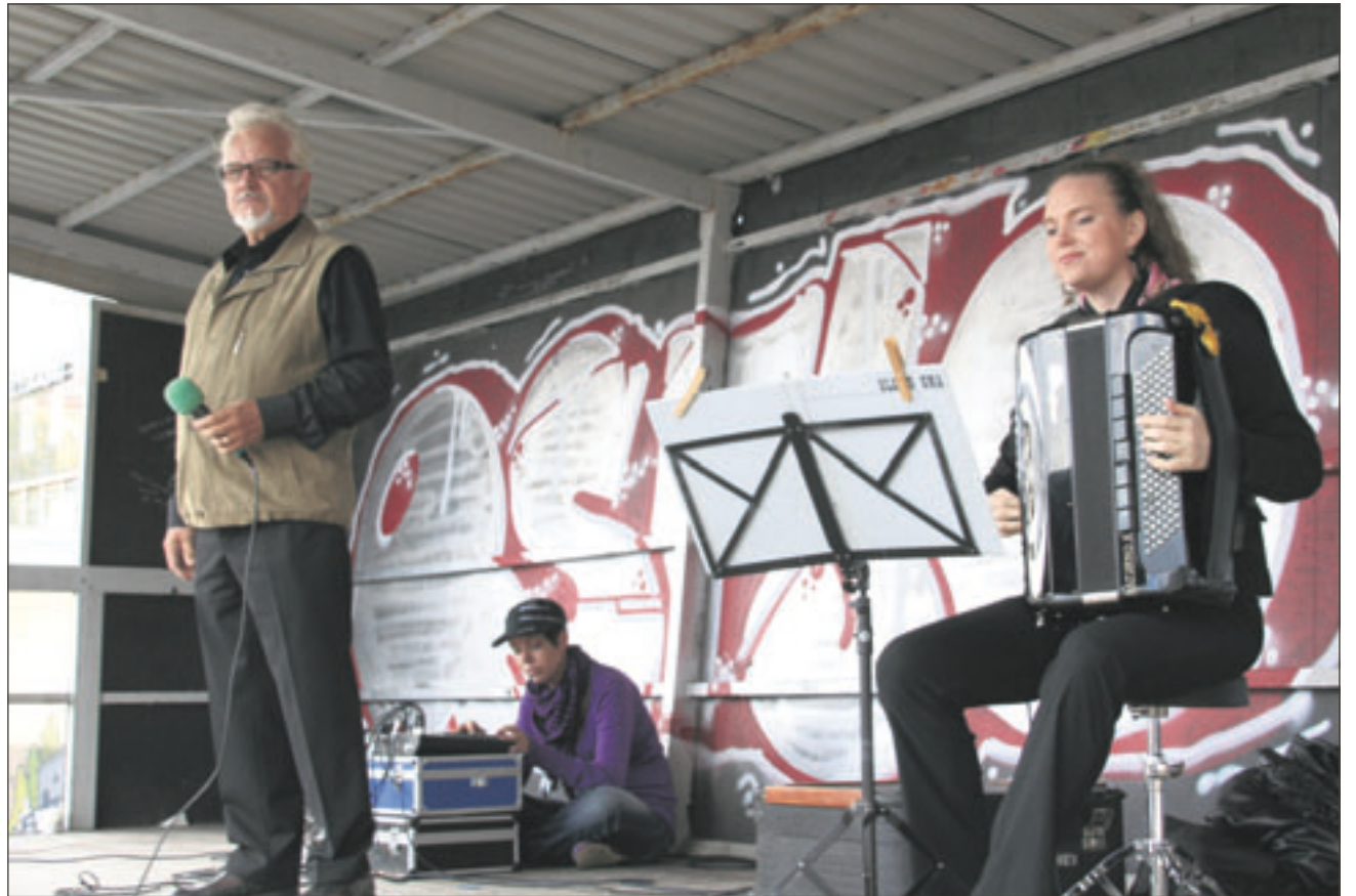
Yhteislauluna laulettiin Mun sydämeni tänne jää.