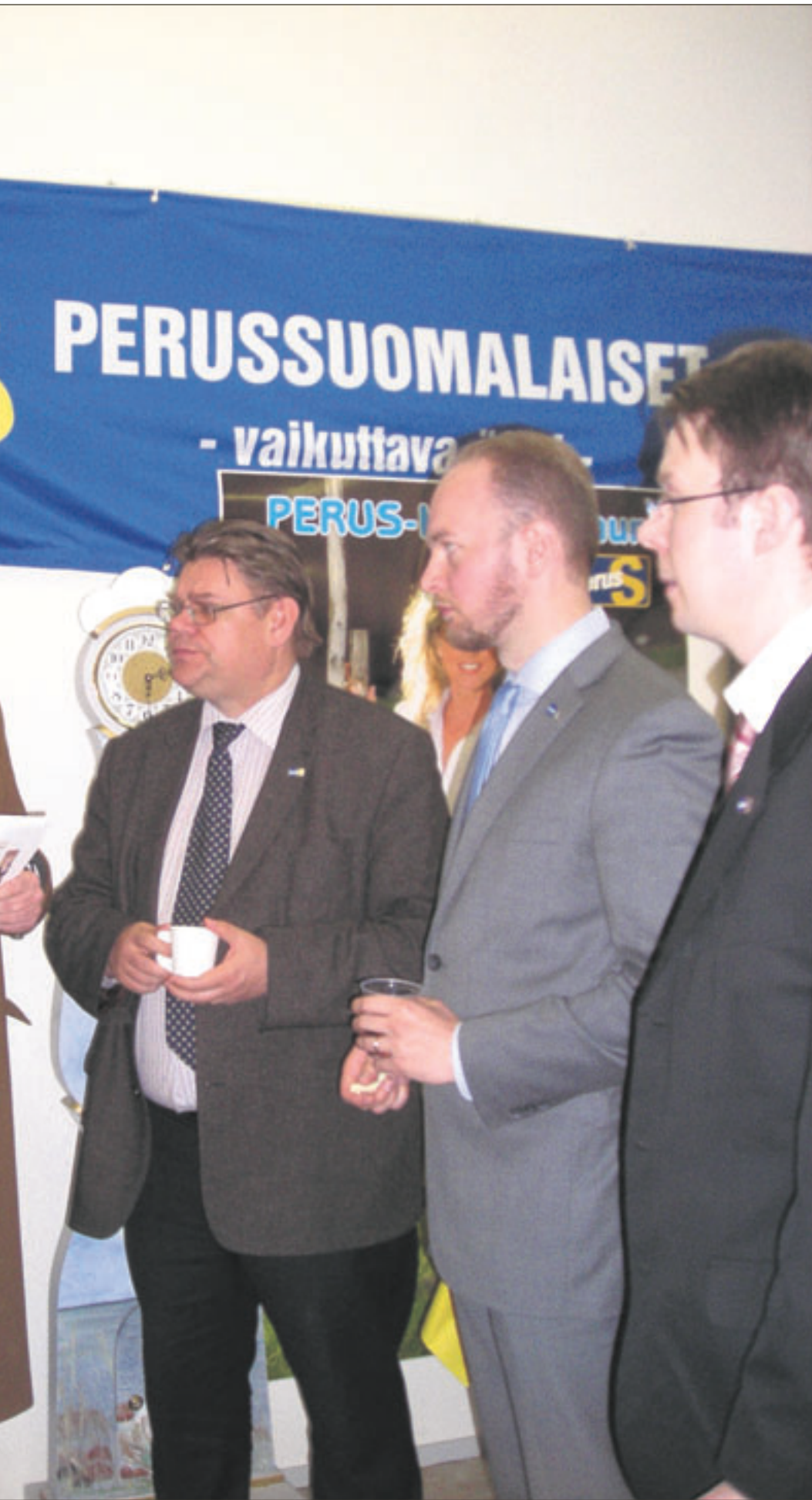
Jokaiset vaalit vaativat aikaa ja energiaa koko tiimiltä. Tässä juttuhetki Eu-vaalitoimistolla EU vaalien aikaan. Miettikääpäs, missä kuvan ihmiset tänään vaikuttavat. – Arkadianmäellä ja Brysselissä!

julkinen esiintyminen. Viime kunnallisvaalien aikaan törmäsin muutamaan viinalle tai vanhalle viinalle haisevaan ehdokkaaseen ja oman ryhmänsä muodostivat myös ne, jotka eivät osanneet suodattaa jatkuvaa kiroilua ja v-sanoja pois puheestaan edes vaalitelletulla. Hävetti. Eduskuntavaalien alla kuulin, miten toisen ehdokkaan vaali-