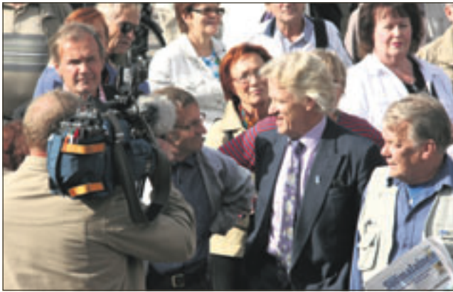
Perussuomalaisten edustajat saivat reilusti huomiota.

Turun Perussuomalaiset järjestivät Turun torilla suur-tapahtuman 30.-31.8.2011. Tapahtuma oli suunniteltu pidettäväksi samana ajankohtana kun Perussuomalaiset kansanedustajat pitivät kokousta Turussa.