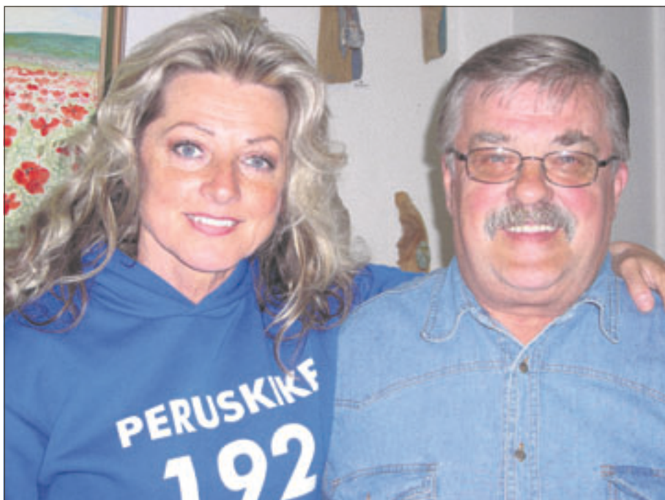
Joskus vaalityö voi olla hauskaakin. Eki pääsi Kiken kanssa samaan kuvaan.

toihin. Kaikki materiaali tulee verkkoon, josta se on osattava poimia ja istunnon aikana myös sieltä seurata asialistaa. Sama tilanne on kaikissa lautakunnissa. Enää ei jaeta paperikasoja ennen kokouksia. Nyt kaikki tapahtuu verkossa. Jos siis tietokoneen käyttö on kovin puutteellista, kannattaa ensin opetella sen käyttö kunnolla ja vasta sitten ilmoittautua ehdokkaaksi kunnallisvaaleihin.