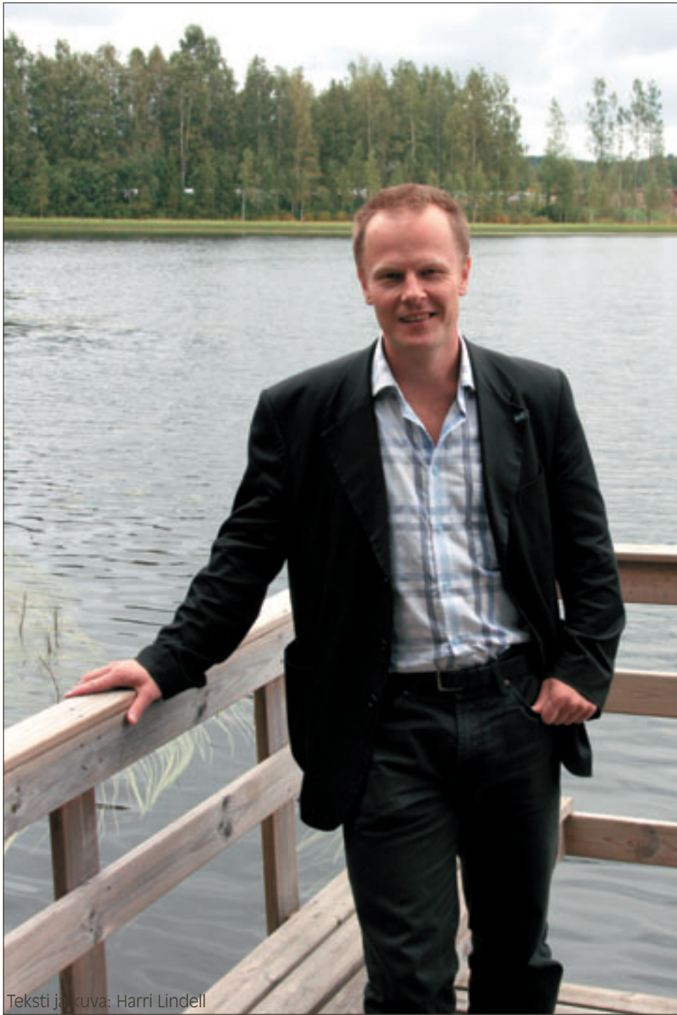
Teksti ja kuva: Harri Lindell

- Ole sinäkin mies ja seuraa perässä. Kansalle annetut lupaukset kuuluu pitää.