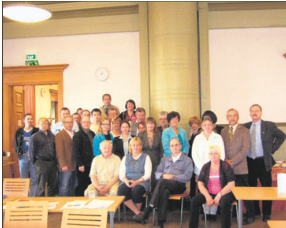
Seminaariin osallistuneet yhteispotretissa.