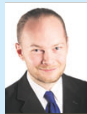
Sampo Terho europarlamentaarikko

Europarlamentti hyväksyi 28.9. talousvalvontaan liittyvän kuusiosaisen paketin, joka mediassa on saanut saman nimen kuin kotimainen hallituksemme: six-pack. Itse äänestin pakettia vastaan.