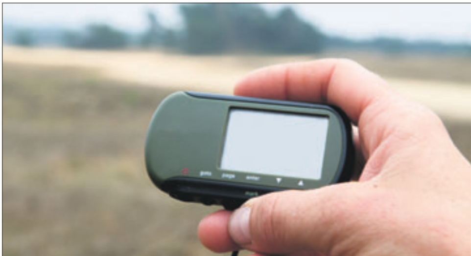
GPS-laitteiden hyödyllisyyttä ei voi kiistää, autoilijoiden seuranta onkin sitten asia erikseen.

Tämä ministeri Kyllösen ehdottama järjestelmä vaatii lain säätämistä. Teknisesti tällaisten seurantalaitteiden valmistaminen ei ole ongelma. Ongelma on se, voidaanko nyky-Suomessa ihmiset noin vain pistää tällaiseen kontrolliin. Neuvostoliitossa se olisi onnistunut.