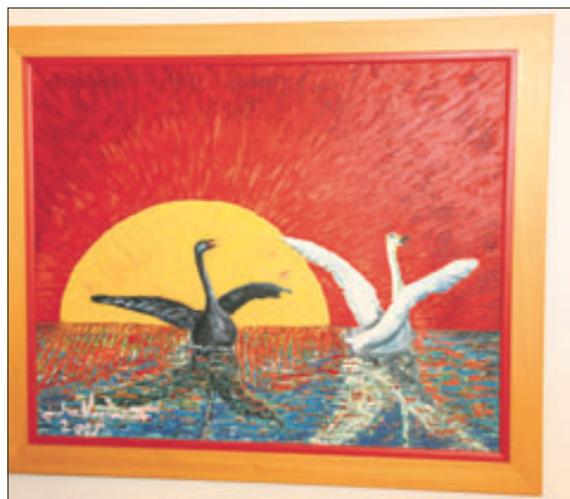
Päivänsankarin maalauksia: yllä Kielletty rakkaus, alapuolella Andalusialainen maisema.