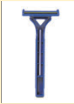
Partakoneen teriä 4 kpl 38 mk

Suoraan markkoiksi muutettuina monien tuotteiden ja palveluiden hinnat näyttävät hurjilta. Alla satunnaisia poimintoja kaupungilta: