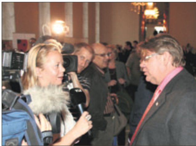
Timo Soini oli median kiinnostuksen keskipisteenä avoimien ovien päivänä.

Politiikan torilla valtiosalissa oli tavattavissa kansanedustajia ja eduskuntaryhmät esittelivät toimintaansa. Avoimien ovien päivän vierailijoille tarjottiin myös kahvit eduskunnan kahvilassa.