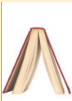
Kirja (pokkari) 73 mk