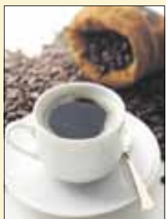
Kahvipaketti 32 mk