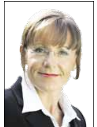
Pirkko Ruuhonen-Lerner kansanedustaja Perussuomalaiset

Kun eri tahoilla myönnetään, että Suomen taloudessa on edessä ajautuminen jopa taantumaa, on vaarana työllisyyden heikkeneminen lähivuosina. Jos liikaa kerättyä tasoitusvastuuta palautettaisiin pienille ja keskiuurille yrityksille työeläkemaksujen alennuksena esimerkiksi 800 miljoonaa euroa vuodessa kahden vuoden ajan, helpottaisi se kyseisten yritysten edellytyksiä pitää työvoimaansa palveluksessaan pahimman taantumajakson yli. Palautuksen