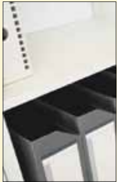
Hyllypaperi (0,7x2,0m) 32 mk

Suoraan markkoiksi muutettuina monien tuotteiden ja palveluiden hinnat näyttävät hurjilta. Alla satunnaisia poimintoja kaupungilta: