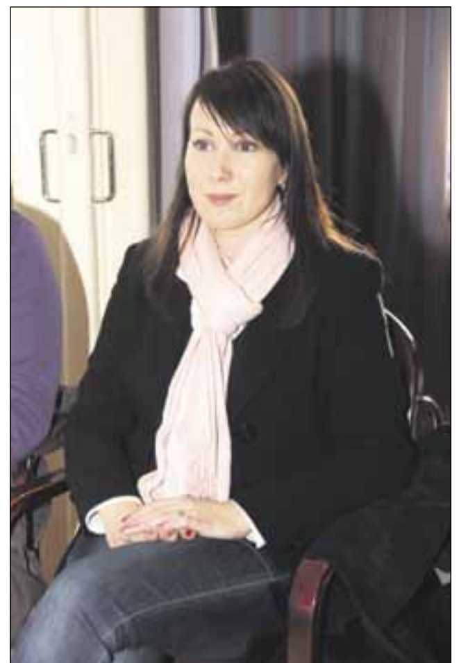
Kansanedustaja Hanna Mäntykä osallistui myös Lapin piirin kokoukseen.