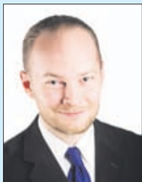
Sampo Terho europarlamentaarikko

Euroopan vakausmekanismi (EVM) on kerännyt erityistä huomiota vahvan laillisen koskemattomuutensa takia. Monet kansalaiset ovat närkästyneet kun julkisuudessa on kerrottu, ettei organisaatiota voi haastaa oikeuteen, ettei työntekijöitä voida haastaa virkatehtävissään tekemistä teoista oikeuteen, ettei EVM:n asiakirjoja tai arkistoja saa alistaa tutkimuksille, sen rakennukset ja muu omaisuus ovat koskemattomia jne.