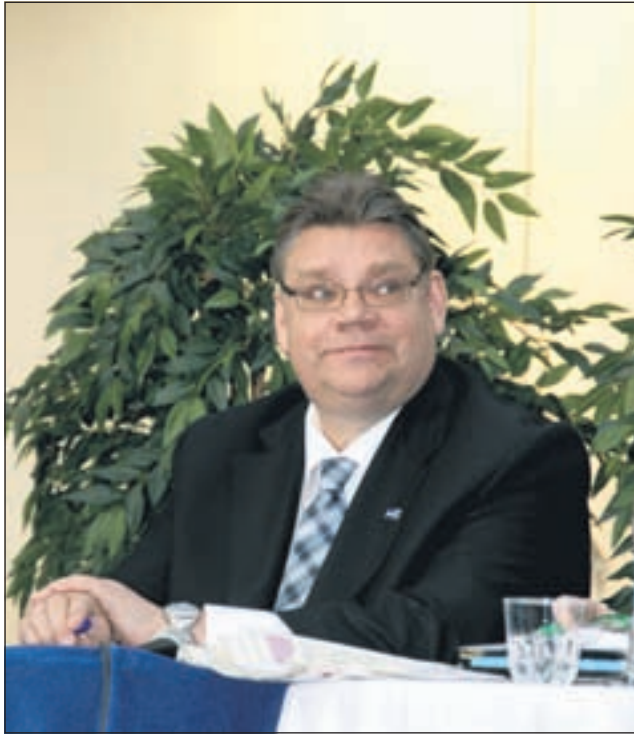
Soinilla oli hymy herkässä onnistuneessa vaalitulaisuudessa.