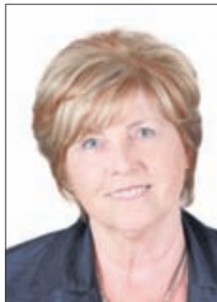
Lea Mäkipää kansanedustaja Perussuomalaiset

Suomen hallitus ja eduskunta, hyväksyessään maamiinojen kieltolain teki todellisen karhunpalveluksen suomalaiselle maanpuolustukselle.