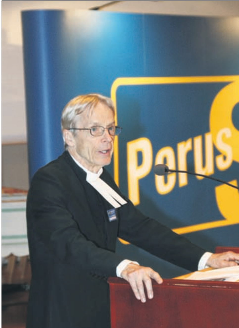
Kansanedustaja Anssi Joutsenlahti on eduskunnan 2. varapuhemies. Koko Suomen historian aikana puhemieshistoriaan on hyväksytty vain suurpuolueiden edustajia, jollaiseksi Perussuomalaisetkin on nyt siis ensimmäistä kertaa noteerattu.

Eduskunnan puhemiehet muodostavat puhemieshistorian sekä puhemiesneuvoston, johon kuuluvat myös kaikkien valiokuntien johtajat. Puhemiesneuvosto päättää eduskuntatyöstä, kuten mitä asioita eduskunnan käsiteltäväksi tulee ja missä järjestyksessä. Perussuomalaisilla on puhemiesneuvostossa peräti neljä jäsentä, Joutsenlahden lisäksi omien valiokuntien-