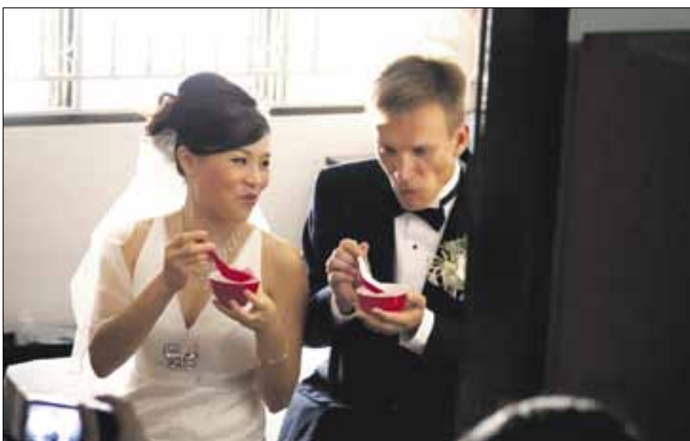
Kun sulhanen oli saanut morsiamensa, heille tarjottiin vaaleanpunaista riisipalokeittoa. Kaksi palloa piti jättää syömättä pahan päivän varalle.