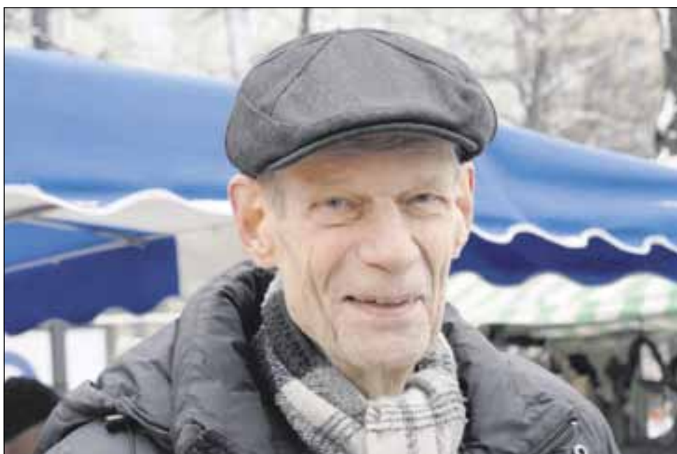
Taloustieteilijä, professori ja tietokirjailija Tauno Tiisanen on huolestunut vientisuhteen epätasapainosta. Hän korostaa, että Suomen pitää valmistautua Venäjän muutoksiin.

poikkiesi myös Lahden kauppatorilla perussuomalaisten teltaosastolla. Eurooppalainen talouskriisi on vetänyt Suomen mukaansa ja Tiisanen sanoo maamme olevan niin vientivetoisen, että kauppataseen alijäämäiseksi kääntymisen on huolestuttavaa.