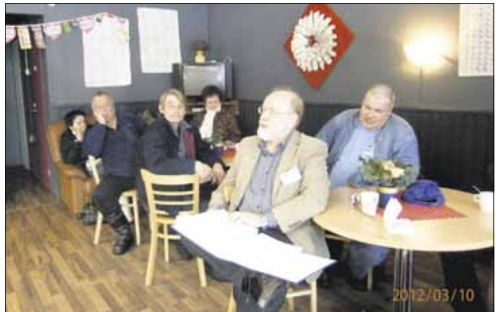
Perussuomalaisia Rautjärvellä kahvila Tariinassa.

Rautjärven Perussuomalaiset käynnistivät lauantaina 10.3. ja Ruokolahden Perussuomalaiset maanantaina 19.3. konkreettisesti kuntavaalimopedin. Rautjärveläiset järjestivät kuntalaisille tilaisuuden Asemansseudun kahvila Tariinassa ja ruokolahtelaiset vastaavanlaisen tilaisuuden Huhtasen kylän koululla.