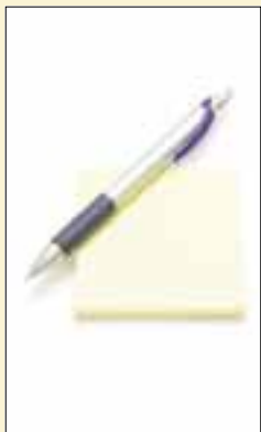
Kuulakärki- kynä 29 mk