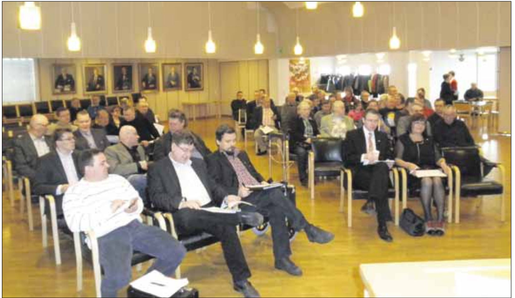
Yleiskuva EP:n piiri ry:n kevätkokouksesta.