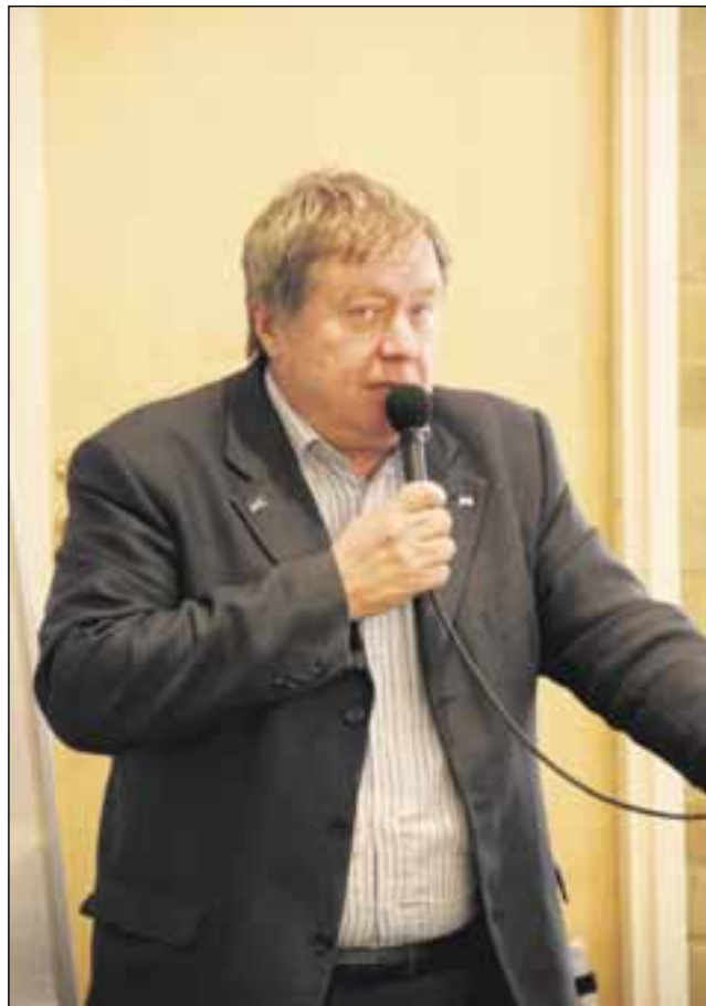
- Enää ei käy, että paikallisyhdistys herää henkiin neljän vuoden välein, totesi Lasse Lehtinen.

Vaalipiirin kansanedustajat Reijo Hongisto, Vesa-Matti Saarakkala ja Maria Tolppanen olivat myös paikalla. He toivat kukin vuorollaan terveiset eduskunnasta ja antoivat poliittisen tilannekatsauksen.