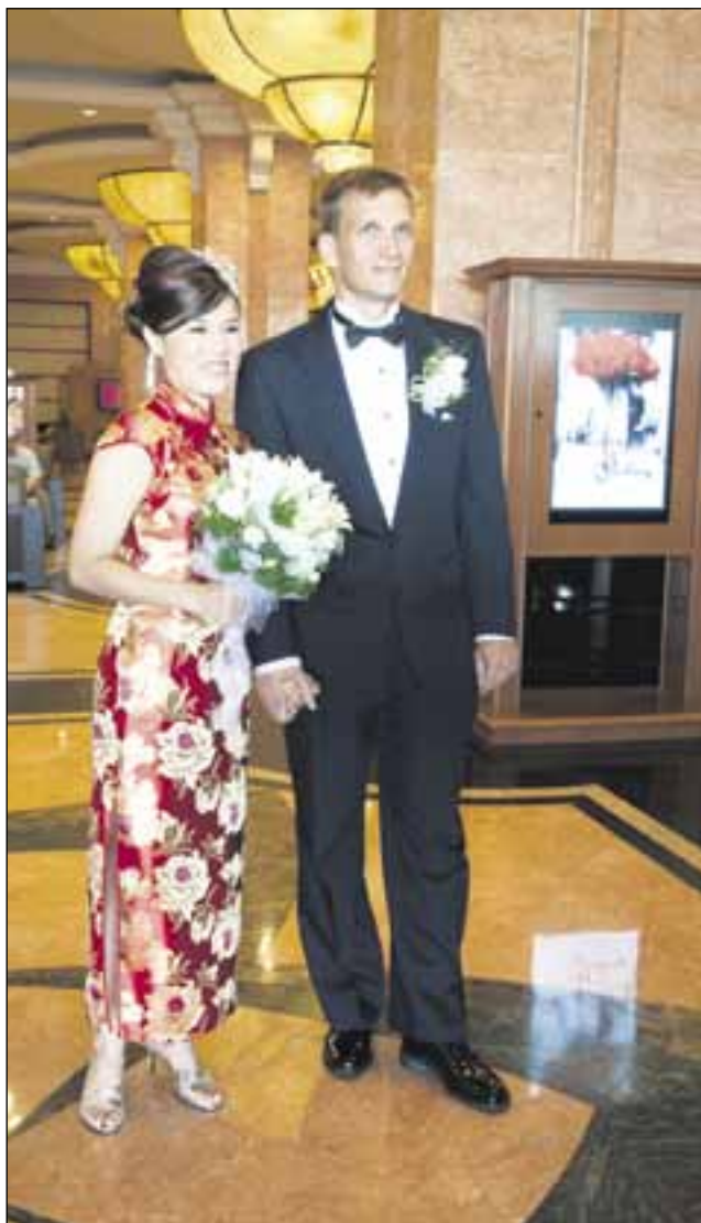
Kiinalaisten juhlaväri on punainen. Morsian vaihtoi pukua neljä kertaa päivän aikana ja sulhanen kahdesti.

Isot kakut ja isot aseet, mutta jalalle polkeminen puuttui.