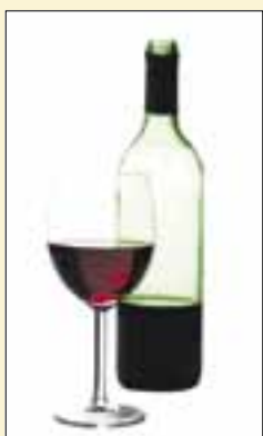
Viinilasi 42 mk