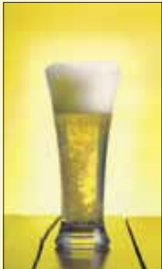
Olut terassilla 41 mk

Suoraan markkoiksi muutettuina monet hinnat näyttävät hurjilta. Alla satunnaisia poimintoja kaupungilta: