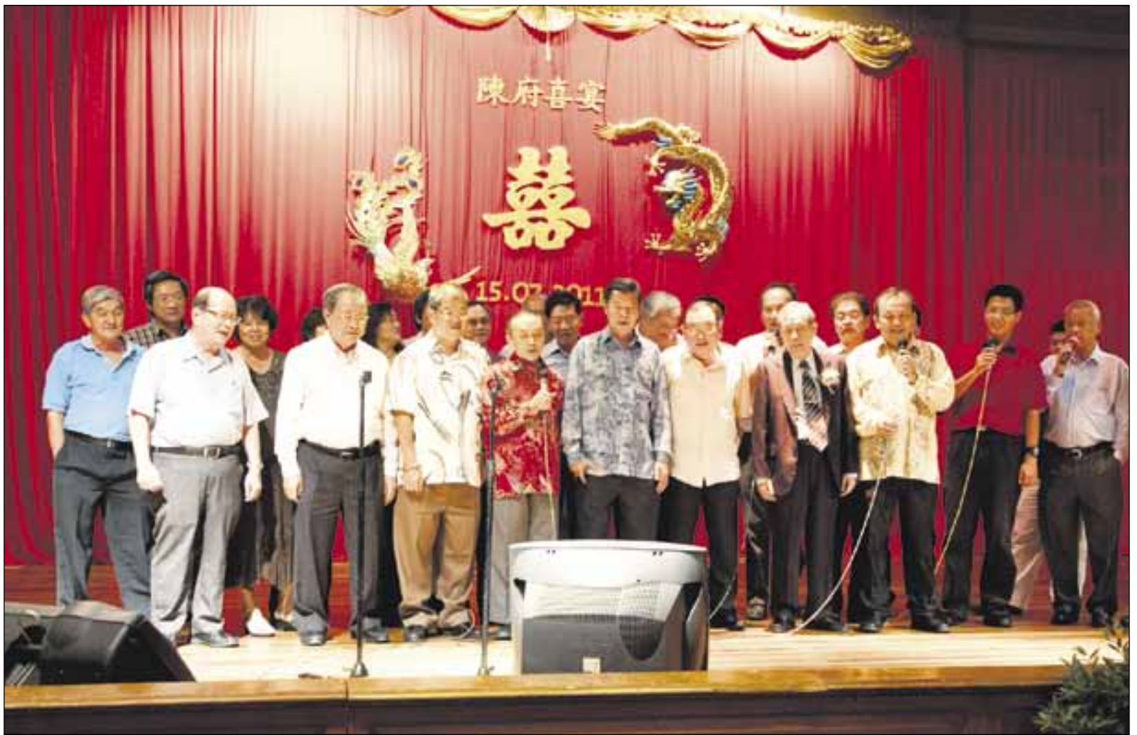
Mahtavat karaokekuorot lauloivat kaikkialla tunnettuja ikivihreitä pikkutunneille saakka.

Tasan klo 20.00 valot himmennettiin ja hääpari asteli rauhallisesti punaista