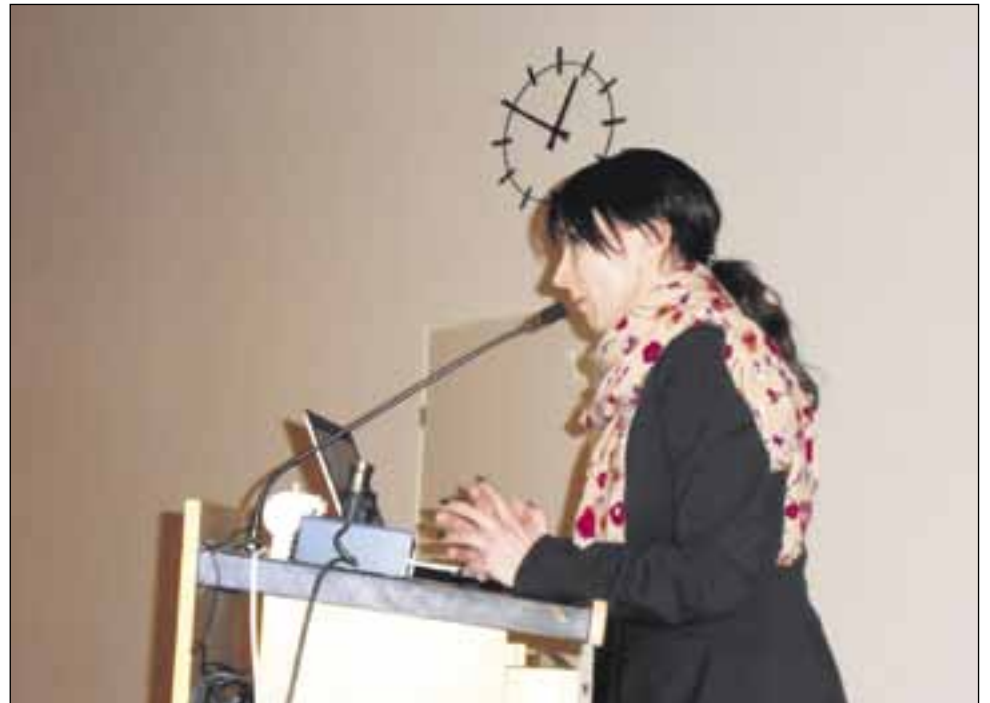
Puolueen varapuheenjohtaja, kansanedustaja Hanna Mäntylä puhuu piirikokoukselle Seinäjoen kaupungintalon valtuustosalissa.

ei ratkaise kuntien rakenteellisia ongelmia ja kuntauudistuksessa tuleekin varoa byrokratian ja hierarkisuuden lisääntymistä. Mäntylä puhui myös kunta- ja palvelujen ulkoistamisesta. Hän mainitsi esimerkkinä kodin ulkopuolelle sijoitetut lapset. Tämä maksaa yhteiskunnalle 650 miljoonaa euroa vuodessa ja rahat menevät yhä kasvavassa määrin ylikansallisille yrityksille.