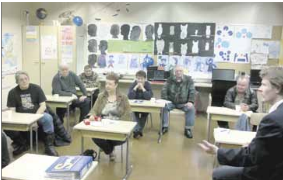
Perusleijonia Ruokolahden Huhtasen kylän koululla.