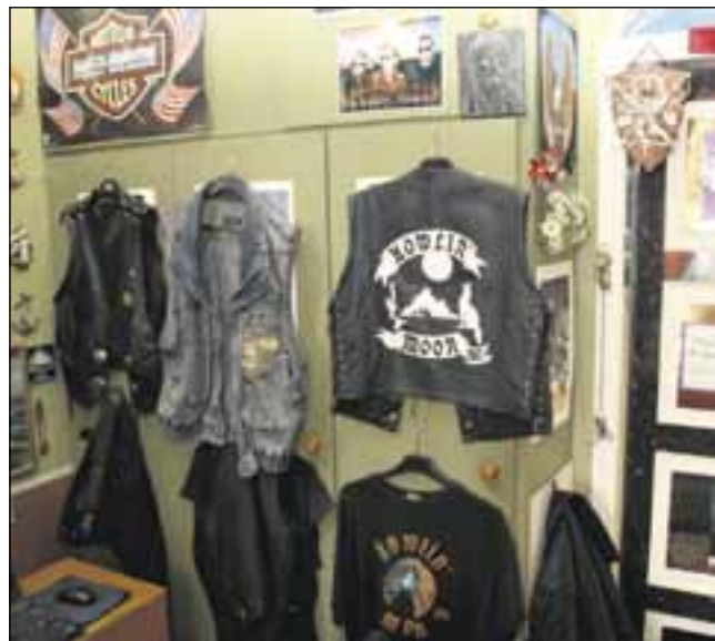
Kaikkia moottoripyörälliivejä ei voi ostaa, ne pitää ansaita.