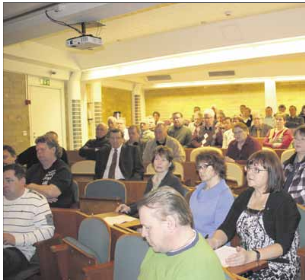
Luentosali oli täynnä aktiivisia perussuomalaisia.