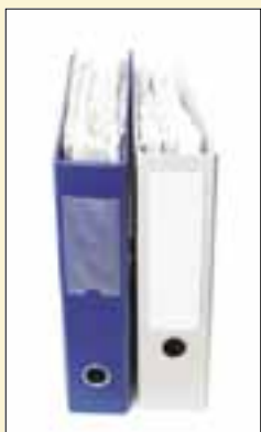
Mappi A4 23 mk