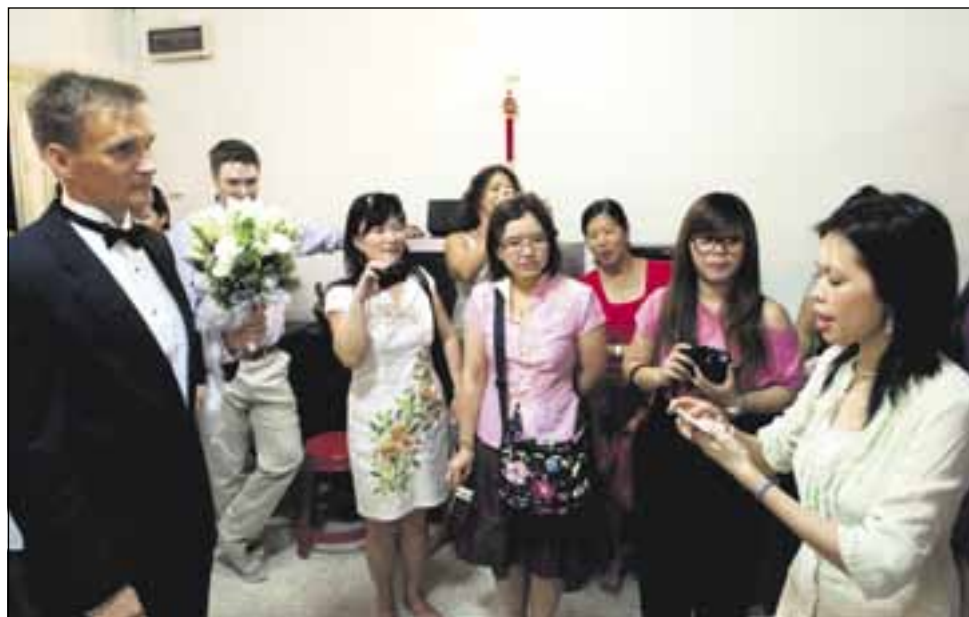
Sano: ”minä rakastan sinua” kymmenellä kielellä. Avustajien tuella löytyivät: Venäjä, Bulgaria, Hindi, Suomi, Ruotsi, Englanti, Saksa, Malei, kiina ja Viro.

Kaylla oli valkea puku ja huntu. Huntu otettiin pois, vaihdettiin sormuksia ja suudeltiin. Sitten parille tuotiin vaaleanpunainen riisipallockeitto, josta kaksi riisipalloa jätettiin syömättä pahan päivän varalle.