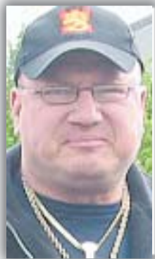
Tony Halme Kansanedustaja