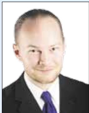
Sampo Terho europarlamentaarikko

Eurojärjestelmä luotiin viiallisena. Sen myöntävät tätä nykyä yhtä lailla euron innokkaimmat kannattajat kuin kriitikotkin. Näkemuserot alkavat siitä, mikä järjestelmän perustavanlaatuisen vika tarkkaan ottaen on. EU-liittovaltion kannattajat