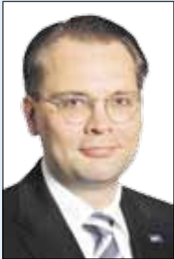
Jussi Niinistö Kirjoittaja on kansanedustaja ja puolustusvaliokunnan puheenjohtaja

Eduskunnassa käytiin eloisa keskustelu valtiontalouden kehystystä vuosille 2013-2016. Hidastuneen talouskasvun vuoksi hallitus sopi jo toisen kerran vuoden sisällä mittavista valtiontalouden sopeutustoimista tavoitteenaan kääntää valtion velkasuhde laskuun vaalikauden loppuun mennessä. Lähetekeskustelun jälkeen asia etenee valiokuntiin.