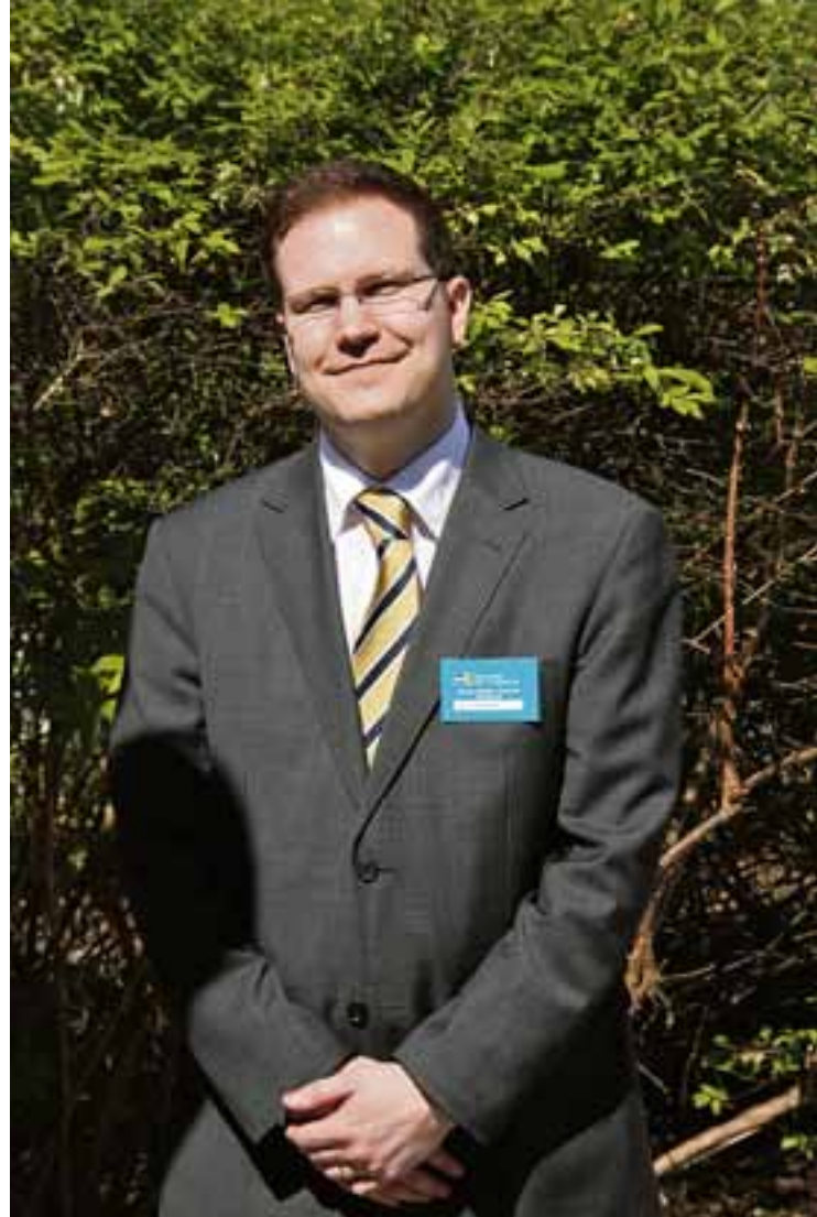
Eduskunnan nuorin kansanedustaja Olli Immonen keskustelee mielellään maahanmuutosta.