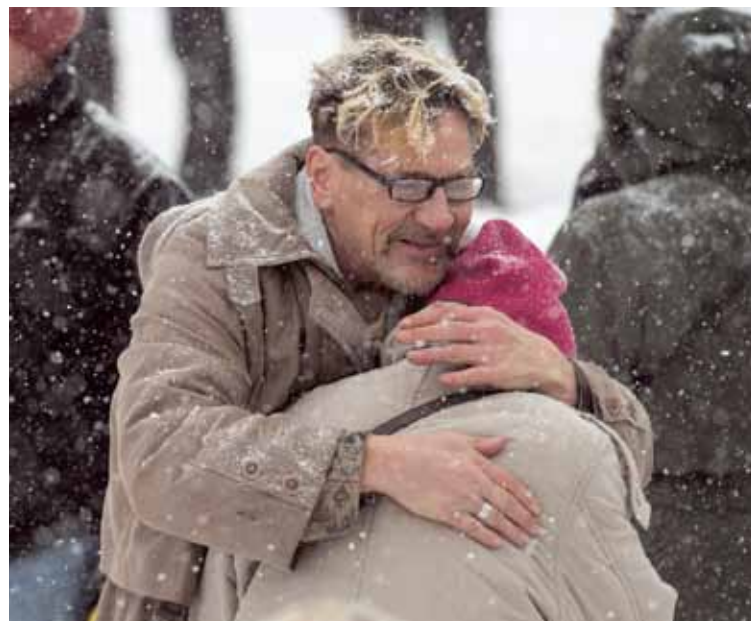
■ Halaus lämmitti lumipyryssä.