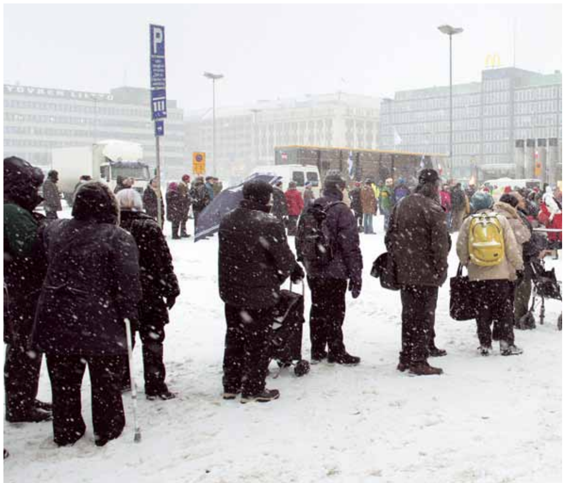
■ Köyhien juhlista monen mukaan lähti myös ruokakassi.