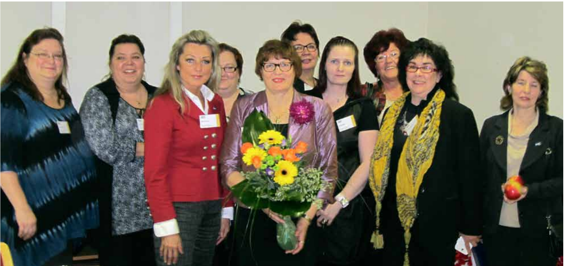
■ Paikalla olleet naisten hallituksen jäsenet ryhmäpotretissa.