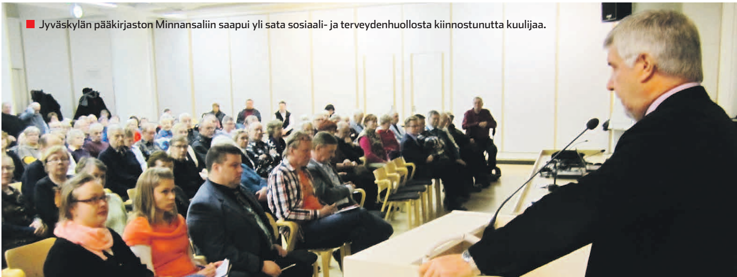
■ Jyväskylän pääkirjaston Minnansaliin saapui yli sata sosiaali- ja terveydenhuollosta kiinnostunutta kuulijaa.