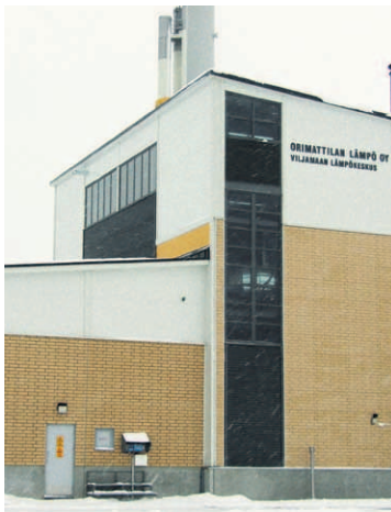
■ Orimattilan Lämpö Oy:n 10 megawatin lämpölaitos otettiin käyttöön marraskuussa 2010. Kovimilla pakkasilla poltettavaa puuta palaa kaksi rekka-autolastillista vuorokaudessa. Energiapuusta ja sen hankinnasta syntyvät tulot jäävät sadan kilometrin säteelle laitoksesta.

MARTTI LINNA KUVAT LEHTIKUVA JA MARTTI LINNA