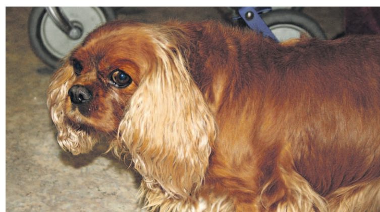
■ Saarelan palvelukodin suosituin vieras on omistajan Emmi-koira.

Vanhustenhoitoon liittyviä kauhutarinoita kansanedustaja Jurva ei halua luottamuksellisuus syistä kertoa, mutta sanoo niitä totuudenmukaisesti olevan. Pahimpia tapauksia, mitä julkisuuteen on tavalla tai toisella tullut, ovat muun muassa iäkkäiden pakkolääkitykset, sänkyyn sitomiset, välinpitämättömyys heidän hygieniastaan sekä keuhkotietrien käyttäminen pitkäaikaisessa laitoshoidossa.