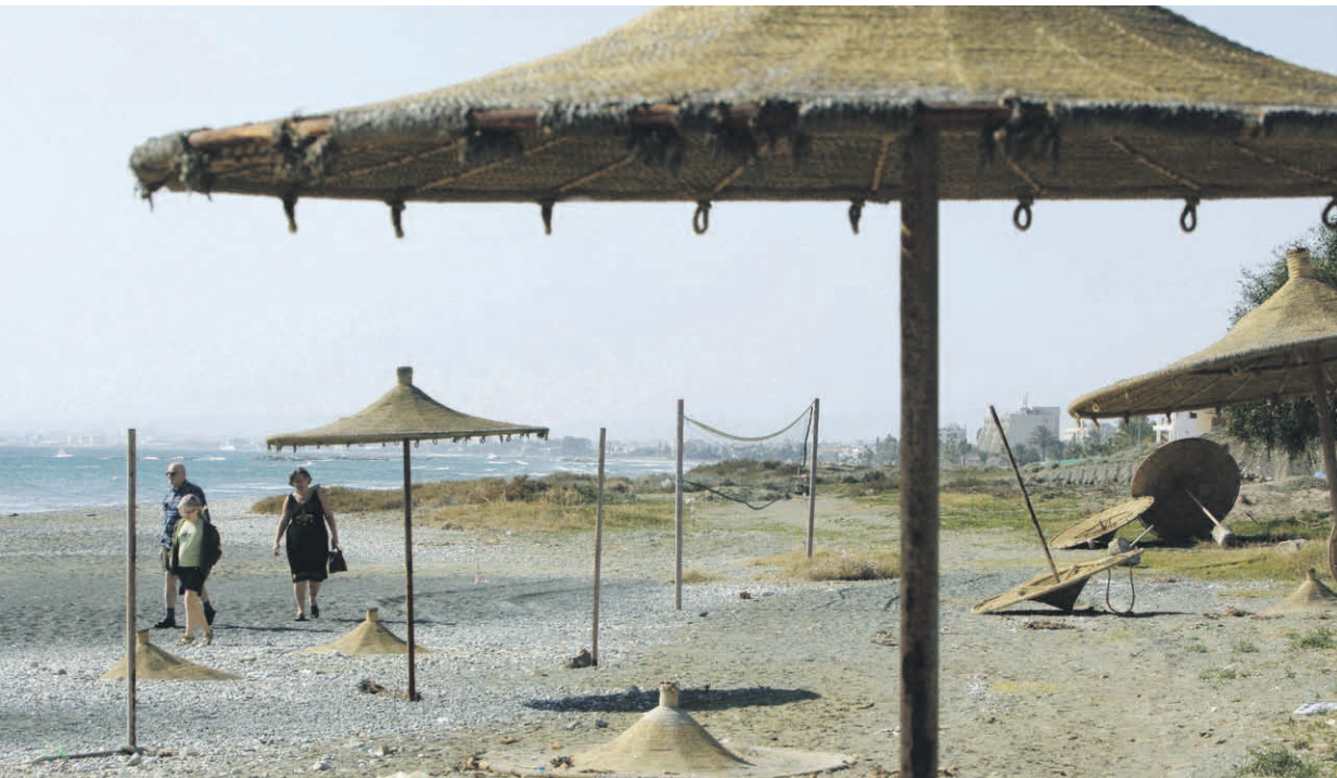
■ Lomaparatiisista on tullut venäläisten leikkikenttä.

- Ja tämä vielä samaan aikaan, kun meillä on itsellämme harmaata taloutta ja siinä tällaisia ikäviä esimerkkejä aina harmaan talouden työryhmän mi-