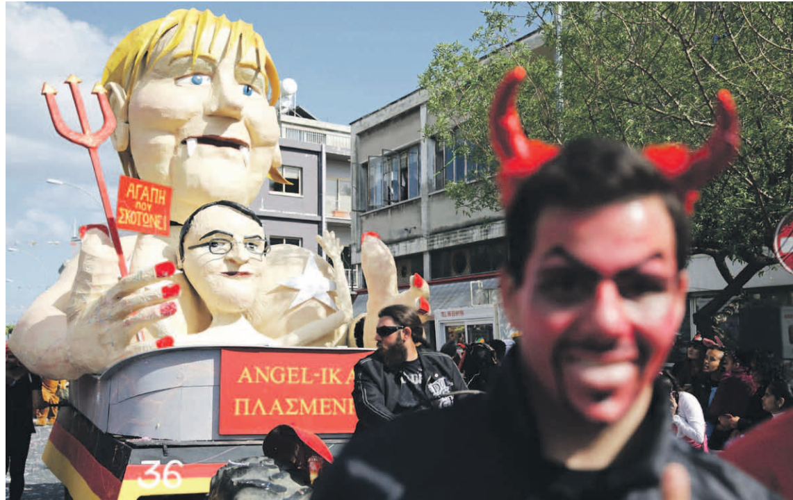
■ Kyproslaiset pilkkasivat Saksan liittokansleria ja omaa presidenttiään Limassolissa pidetyissä karnevaaleissa.

- Yhteensä laskien Kyproksen pankkisektori on peräti 800 prosenttia maan bkt:sta eli se on selvästi ylikehittynyt; Islannissa se oli jopa 12-kertainen ennen kuin maa kaatui, Hirvonen kertoo. Suomen