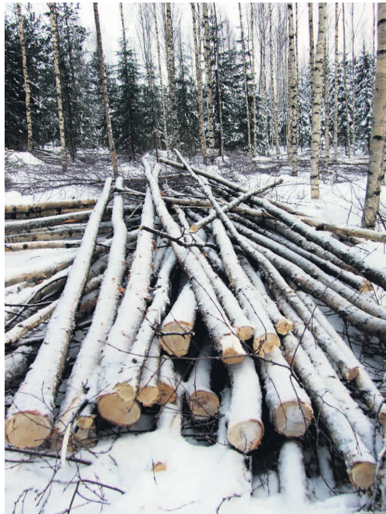
■ Nuorissa metsissä on valtava hyödynnettävissä oleva energiapotentiaali. Ajoissa tehtävä metsän harvennus auttaa jäljelle jääviä puuta kasvamaan myöhemmin hakattaviksi arvokkaiksi tukkipuiksi.