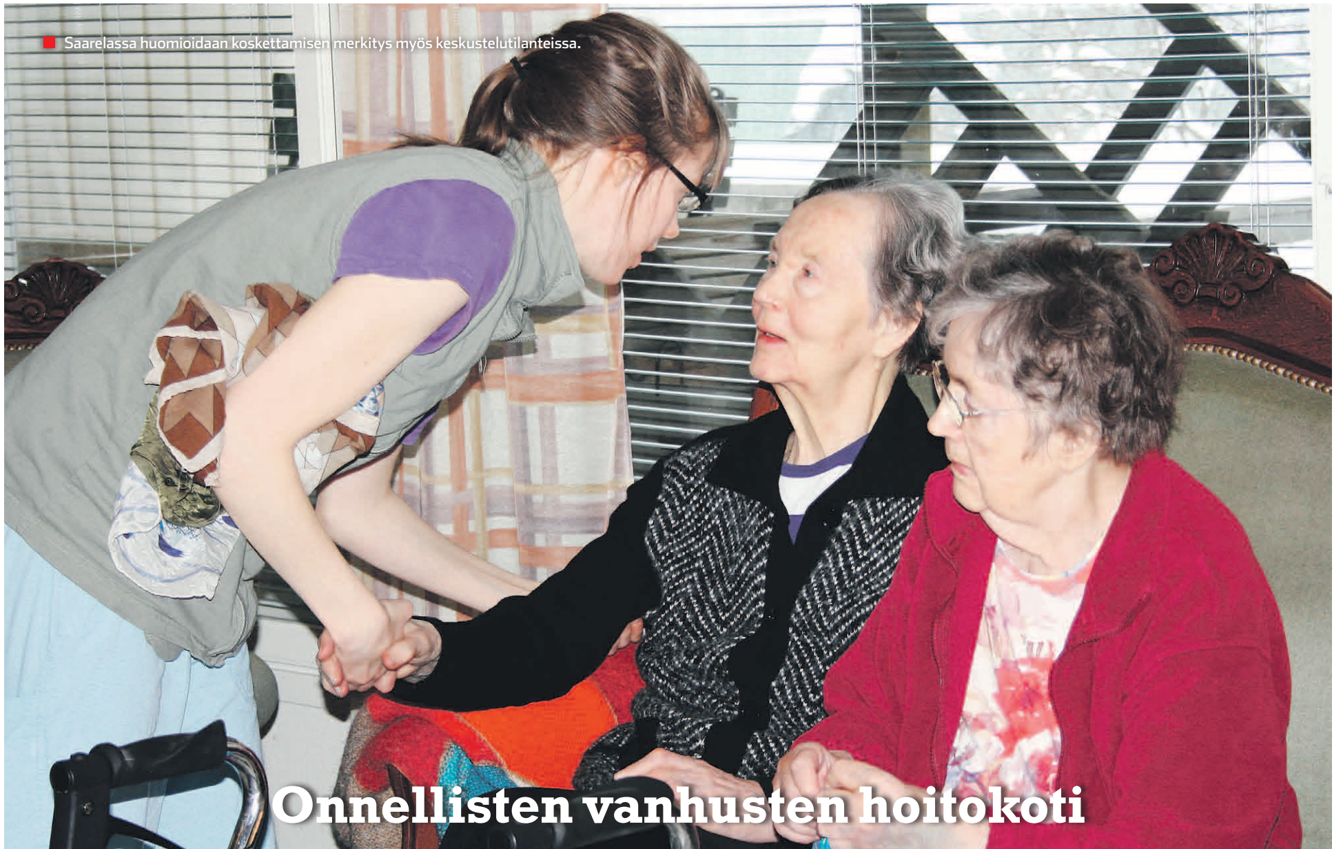
■ Saarelassa huomioidaan koskettamisen merkitys myös keskustelutilanteissa.