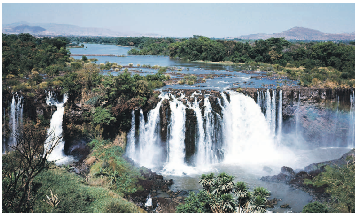
■ Sininen Niili on Etiopiaa kauneimmillaan.

ISMO SOUKOLA