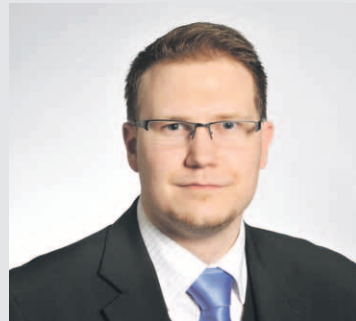
■ Olli Immonen

K iitokset asiallisesta esiintymisestä A-studiossa, kansanedustaja Olli Immonen. Keskusteltaessa maahanmuuttajien ja islaminuskosten kulttuuritaustoista, jotka todellakin loukkaavat ihmisoikeuksia, eivät maahanmuuttajakorttia heiluttelevat halua nähdä niissä mitään negatiivista. Mielestäni Kiitokset asiallisesta esiintymisestä A-studiossa, kansanedustaja Olli Immonen. Keskusteltaessa maahanmuuttajien ja islaminuskosten kulttuuritaustoista, jotka todellakin loukkaavat ihmisoikeuksia, eivät maahanmuuttajakorttia heiluttelevat halua nähdä niissä mitään negatiivista. Mielestäni olisi nostettava keskusteluun naisten ja tyttöjen asema näissä autoritäärisissä ja usein jopa