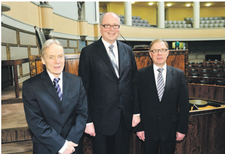
■ Eduskunnan puhemiehet: 2. varapuhemies Anssi Joutsenlahti, puhemies Eero Heinäluoma ja 1. varapuhemies Pekka Ravi.