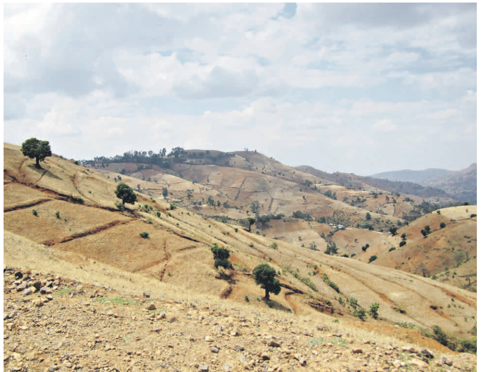
■ Pengerrettyjä rinteitä.

onkin perustellusti huolissaan Al Shabaabin värväystoiminnasta yhteisön keskuudessa.