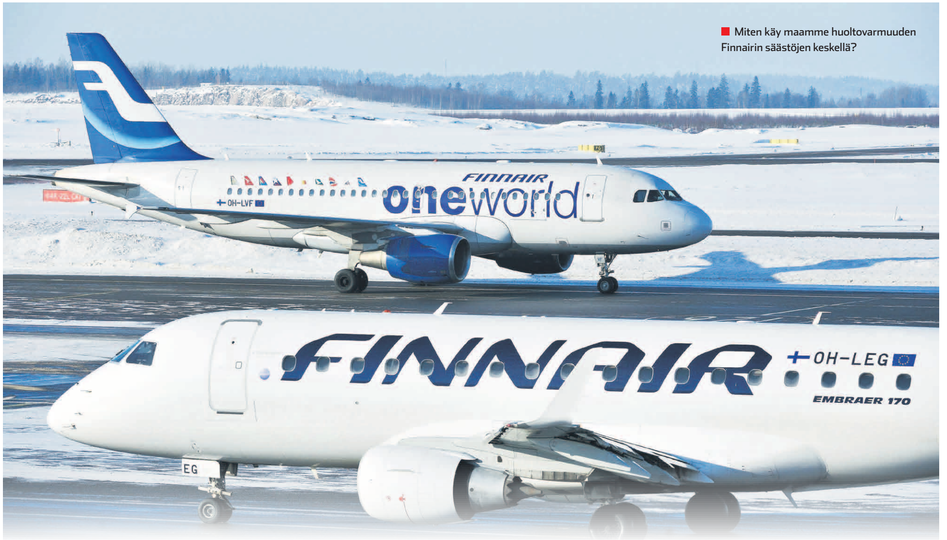
■ Miten käy maamme huoltovarmuuden Finnairin säästöjen keskellä?