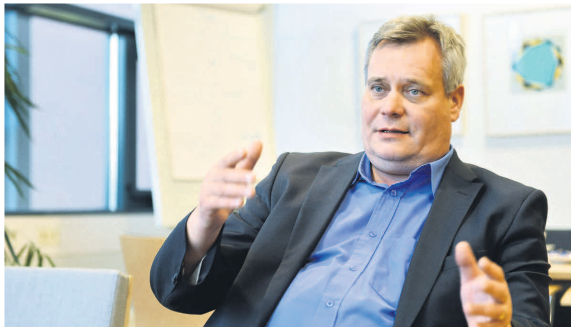
■ Finnairin palkkalistoilla olevat ihmiset ovat hämmentyneitä, vihaisia, pettyneitä ja turhautuneena valtion merkittävästi omistamaan yhtiön työnantajana, ammattiliitto Pro:n puheenjohtaja Antti Rinne myöntää.