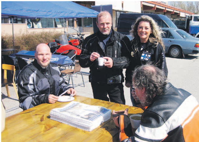
■ Kiken seurassa salolaisia motoristeja.

A urinkoinen sää ja rakas harrastus houkutteli Drive in Liedon -motoristikirkkoon satoja pyöräilijöitä. Tapahtuma on ollut jo yli 30 vuoden moottoripyöräilijöiden perinteinen ajokauden avajais-tapahtuma. Hernekeitto ja pannukakut maistuivat perussuomalaisten teltalla. Hernekeittoa kului lähes kolmesataa anosta, pannukakujen menekki oli vielä suurempi.