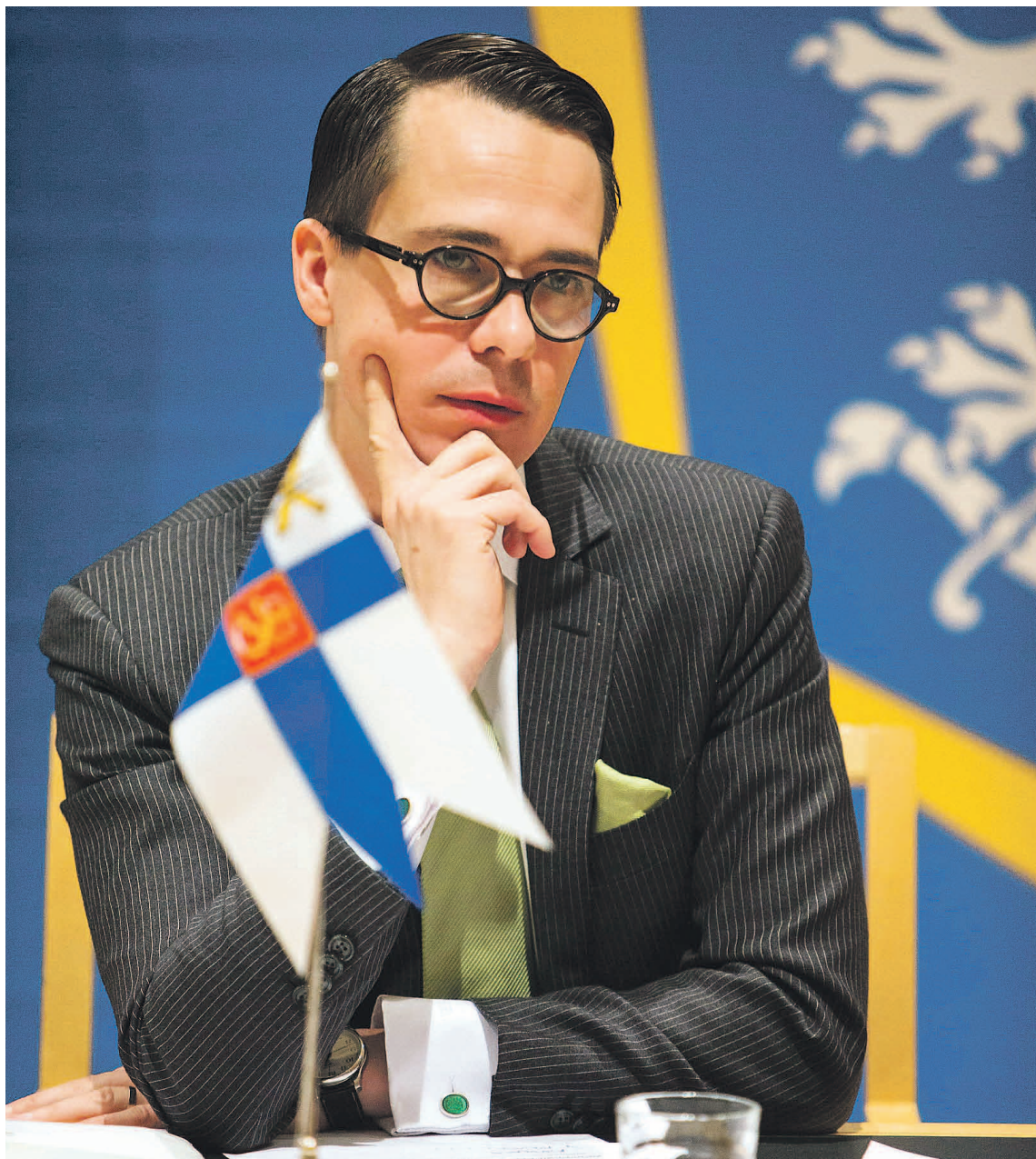
■ Ministeri Carl Haglundin selitykset eivät vakuuta kaikkia.