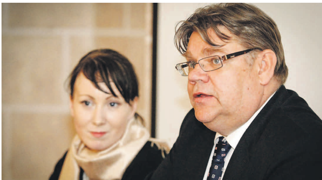
■ Perussuomalaiset vastustavat hallituksen sote-suunnitelmia varapuheenjohtaja Hanna Mäntylän ja puheenjohtaja Timo Soinin johdolla.