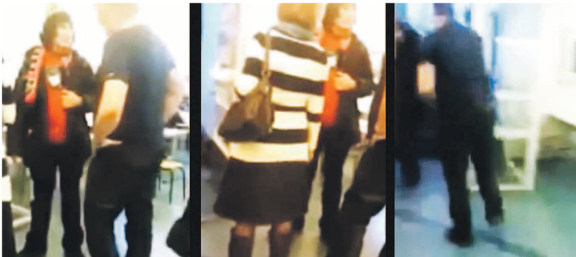
■ Nettiin levisi pian video Alppilan tapahtumista.

tapaus voi parantaa myös perussuomalaisien kannatusta opettajien keskuudessa puolueen profiloitua tapauksessa voimakkaasti. Tähän on aihettakin, koska opettajien ammattikunta tuntuu olevan kokoomuslaisten hallussa. Naisvaltaisella alalla myös vihreiden osuus on suuri.