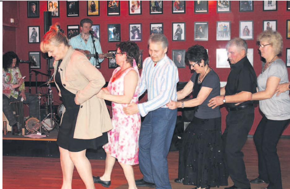
■ Letka-jenkka innosti tanssijoita perussuomalaisten iltamissa.