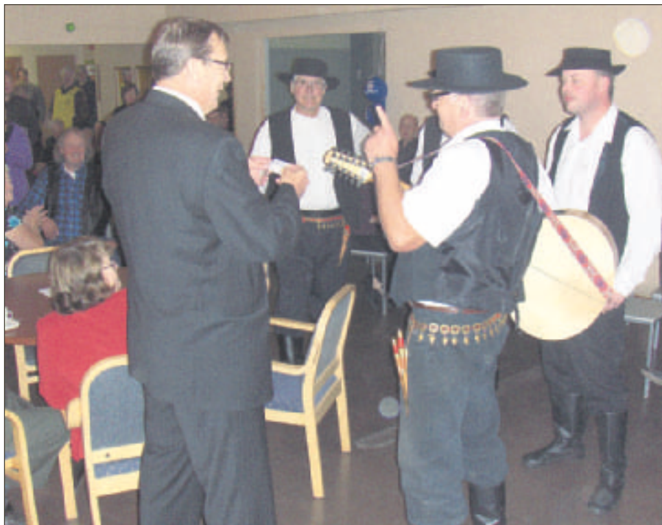
Raimo saa häjyyttä ohohojhia:

Puronvarren Martin johorolla salihin asteli komia joukko Härmälääsiä ja Kauhavalaasia miähiä, joka alako jo siinä tullesnansa laulamahan. Laulusta kuuli ja miähistä näki, notta ny o voimaa takana. Häjyt ei sen kummemmin ruvenneet