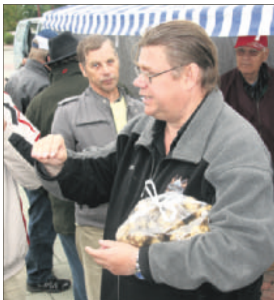
Someron torilta löytyi perunapussi kotiin vietäväksi.