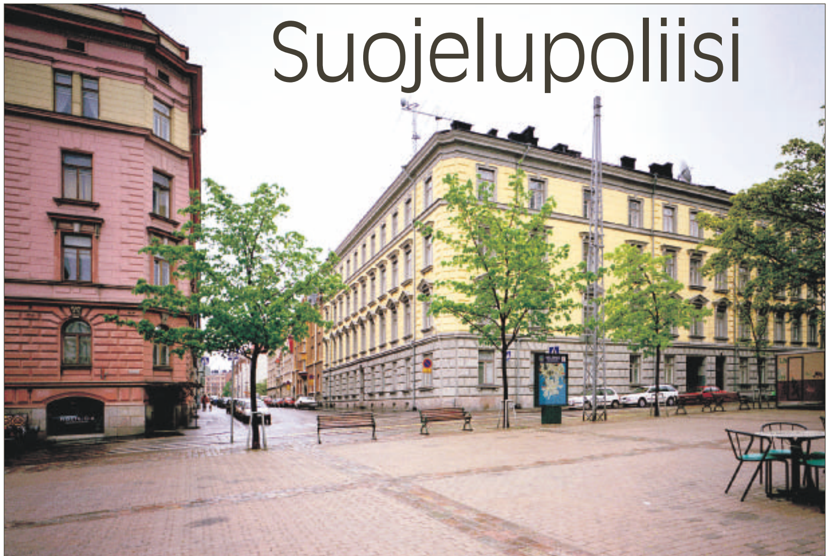
Suojelupoliisi torjuu valtion yhteiskuntajärjestystä sekä sisäistä ja ulkoista turvallisuutta vaarantavia hankkeita. Tällä hetkellä ei suuria uhkia ole näköpiirissä.

Yleisesti on paljon keskusteltu myös esimerkiksi