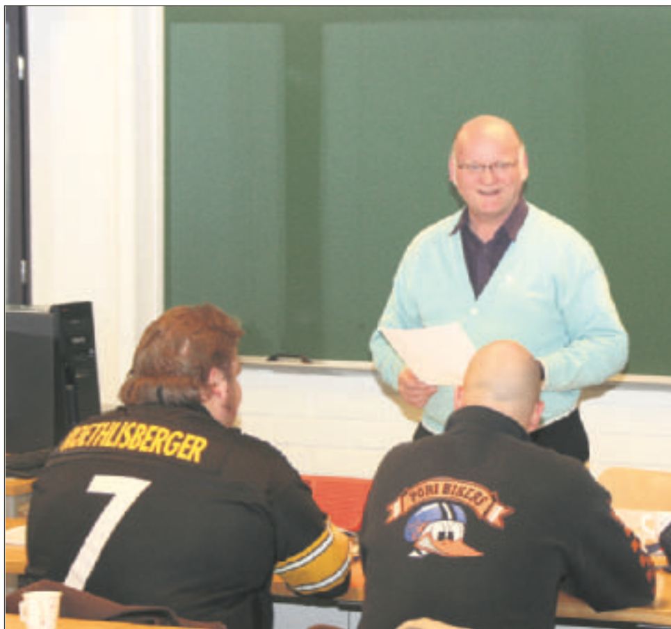
Jos kunnolla yleistetään, niin tämän syyskokouksessa otetun kuvan perusteella Porissa perussuomalaisen jäsenistö on epäilyttävää sakkia.