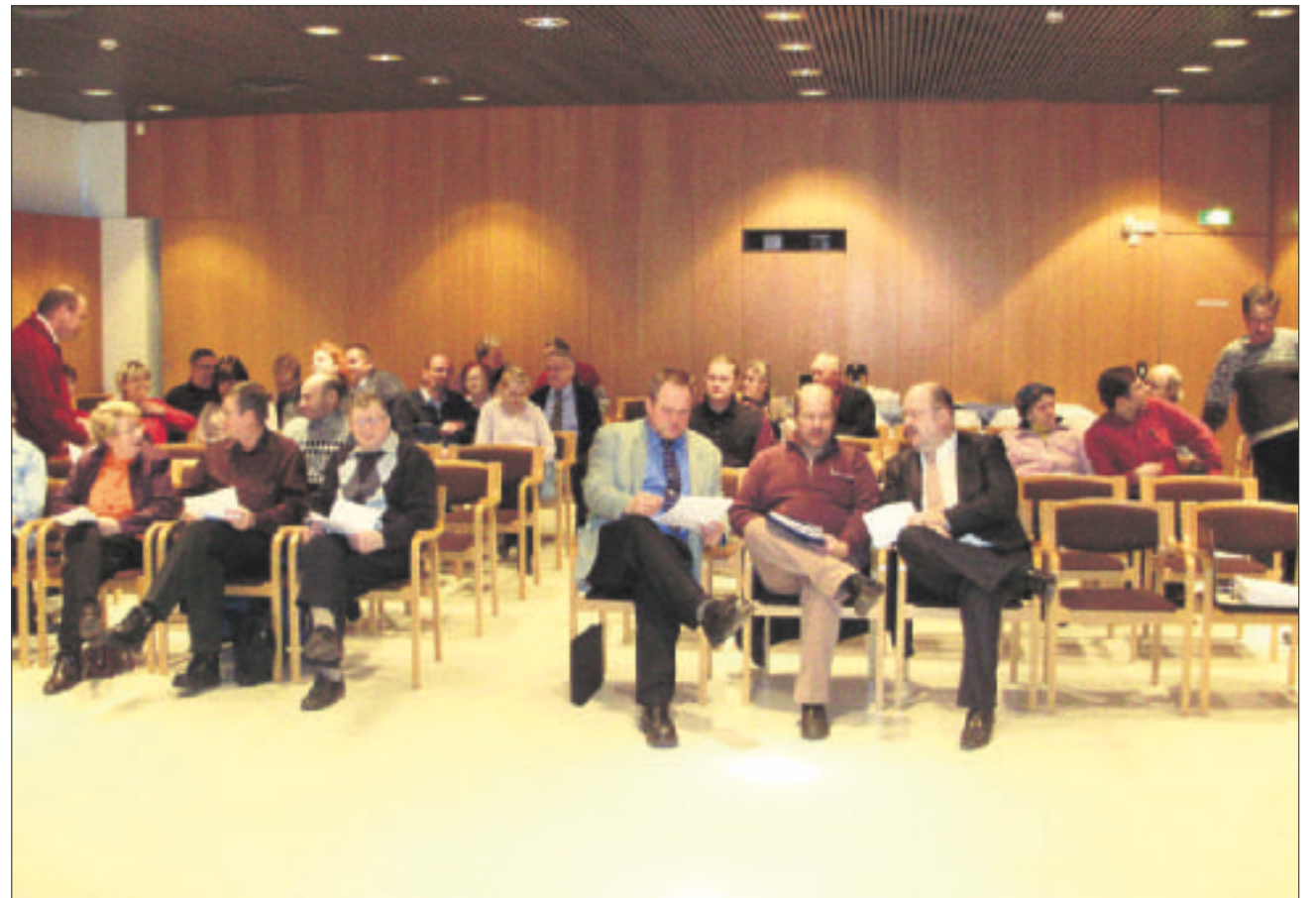
Kuopion kirjaston varattu tila täyttyi aktiivisesta kokousväestä.

Edelleen Soini availi sanaista arkkuaan puhuesaan kokousväelle, että politiikka on ylä- ja alamäkeä. Ja nyt kun puolueella on