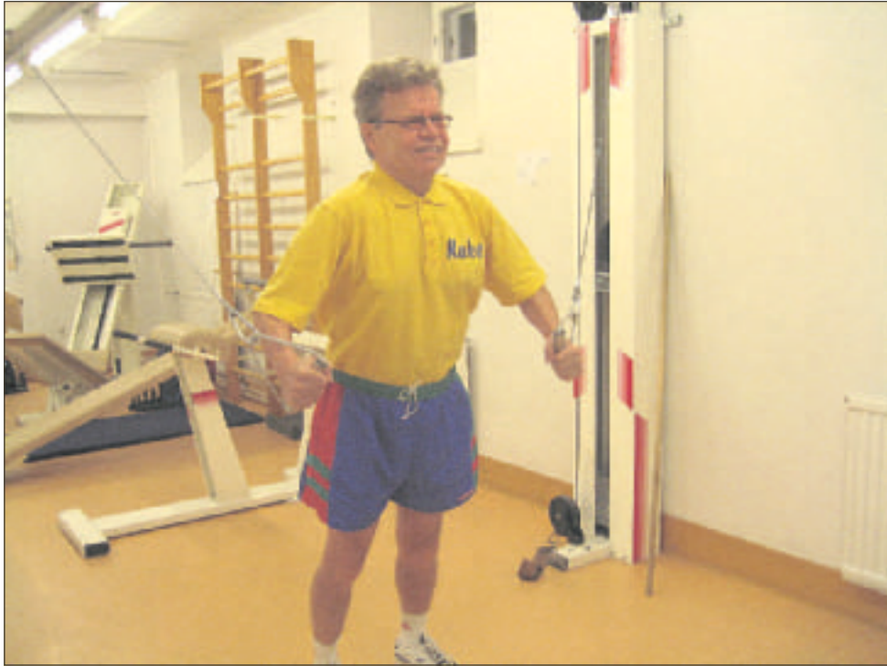
Kaken salikuntoiluun kuuluu kahdeksan erilaista liikesarjaa. Kuvassa vahvistuvat rintalihakset.