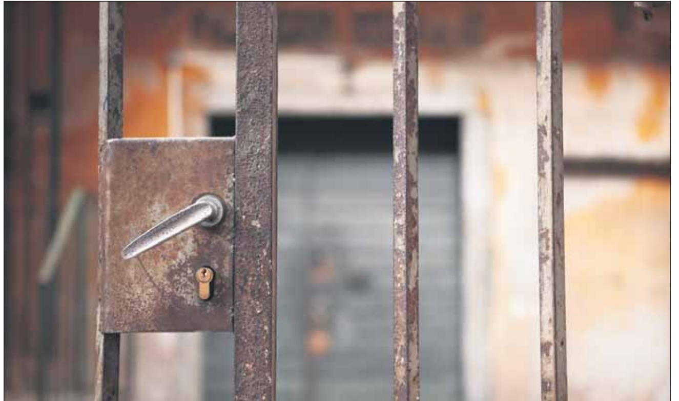
Konnunsuon vankilan lakkauttamisen ja Pelson vankilan paikkaluvun laskemisen taustalla on kustannussäästöjen lisäksi arvio vankiluvun laskusta tulevaisuudessa.

Pelson toiminta jatkuu supistetulla peruskorjauksella sekä vuosikorjauksella tyypillisellä korjauksella.