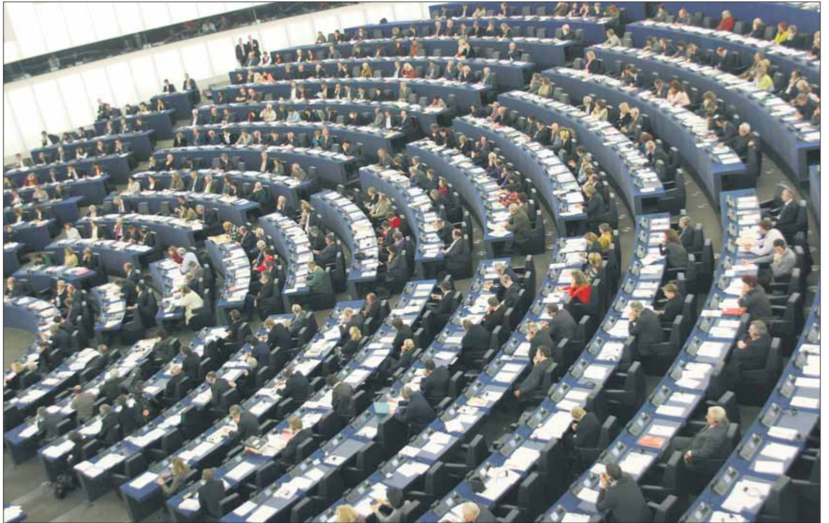
Euroopan Parlamentin jäsenet kuuntelivat presidentti Abbasin alustuspuhetta ennen parlamentin istuntoa.

Katukuvasta erottuu jättimäinen Euroopan parlamentin rakennus, joka