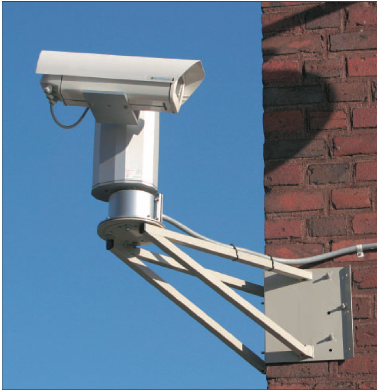
Totalitaarinen yhteiskunta oli esillä George Orwellin teoksessa "Vuonna 1984". Romaani tuntuu nyt ajankohtaiselta.

"Vuonna 1984" on George Orwellin 1949 kirjoittama romaani, joka kertoo totalitaarisesta virallisen totuuden yhteiskunnasta. Ihmisiä valvotaan lähes aukottomasti, historia kirjoitetaan uudestaan, hormonitkin hyrräävät Puolueesta innostuen. Alun perin romaania pidettiin kommunisminvastaisena puhevuorona.