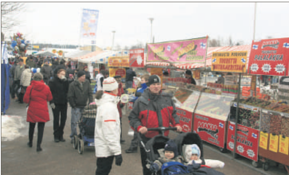
Markkinoilla oli tuhansia ihmisiä, lämpötila oli nollan tietämissä

EU-politiikka on myös sisäpolitiikkaa. Hallituksen politiikka on asetettava puntariin EU-vaaleissa. EU-vaalit ovat äänestäjille myös erinomainen mahdollisuus näpäyttää hallitusta kunnolla. Perussuomalaiset tuovat EU-vaalikeskusteluun vahvan yleispoliittisen näkökulman.