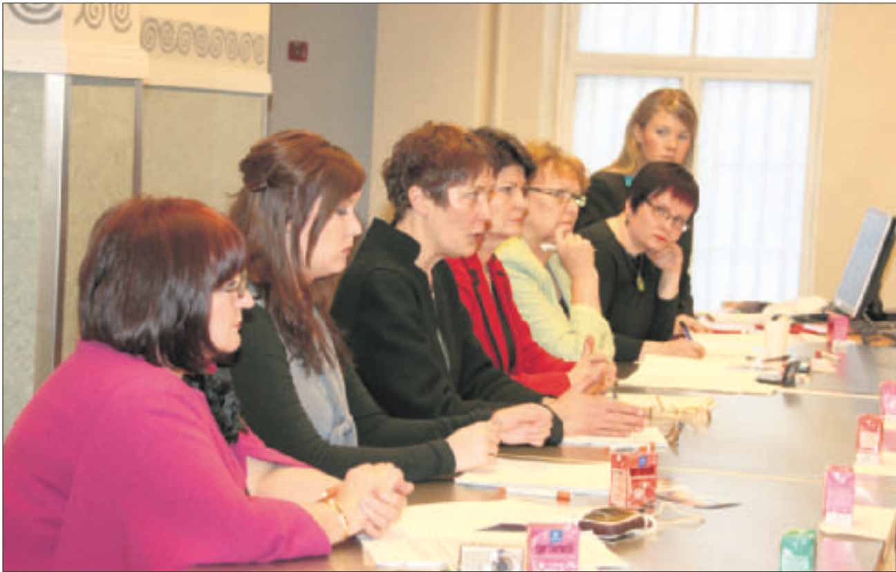
Panelisteja oli tasaisesti jokaisesta eduskuntapuolueesta keskustelemassa, Nytkiksen hengen mukaisesti.

Valtakunnallisena naisten päivänä 8.3. järjestettiin EU-paneeli Tampereella Pantin auditoriossa. Tilaisuuden järjestäjänä toimi Nytkis-järjestö.