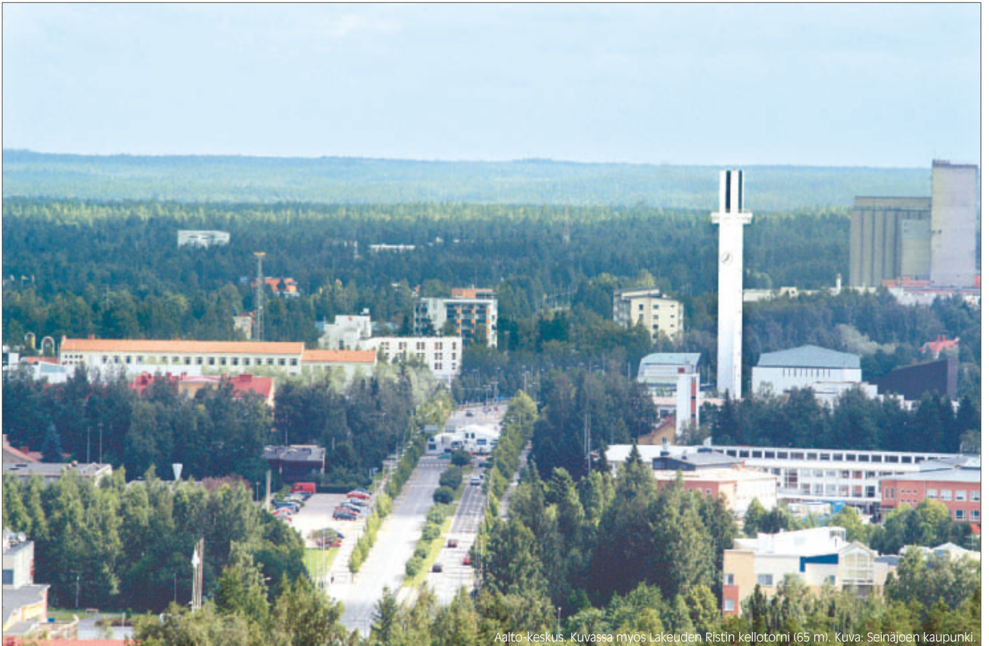
Aalto-keskus. Kuvassa myös Lakeuden Ristin kellotorni (65 m).