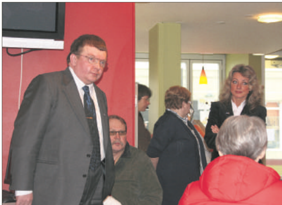
Hämeenlinnassa ehdokkailla oli hyviä keskustelukumppaneita.