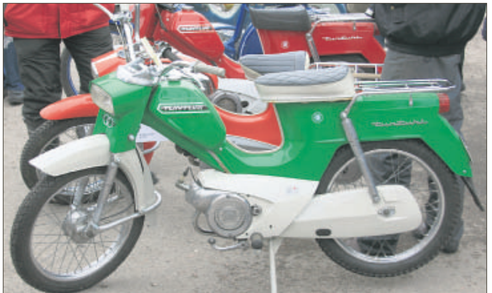
Moottoreista kiinnostuneille oli tarjolla nostalgjaa.