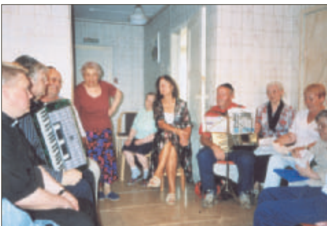
Suomalainen ryhmä vieraili myös juutalaisvanhusten paikassa. Paikan nimi on "Lämmin koti". Kuvassa musiikkiryhmäläisiä. Vasemmalla tulkkinä toiminut Viipurin Pietarin-Paavalin kirkon kirkkoherra.