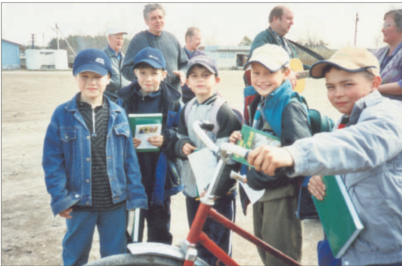
Nämä pojat tarvitsivat käsiineitä ja lippiksiä. He ottivat iloitin vastaan myös omalle kielelleen käännetyn ja värikuvitetun lasten raamatun. Taustalla mukana olleita avustustyöntekijöitä ja laulajia.

- Jalkine- ja vaateapua on jaettu aivan suoraan kaduille ja toreilla. Pääasiassa avustustavara viedään kuitenkin edelleen lasten ja vanhusten hoitolaitoksiin. Avustustyöntekijät ovat kuitenkin jalkautuneet myös kaduille ja toreille voidakseen auttaa myös yksineläviä