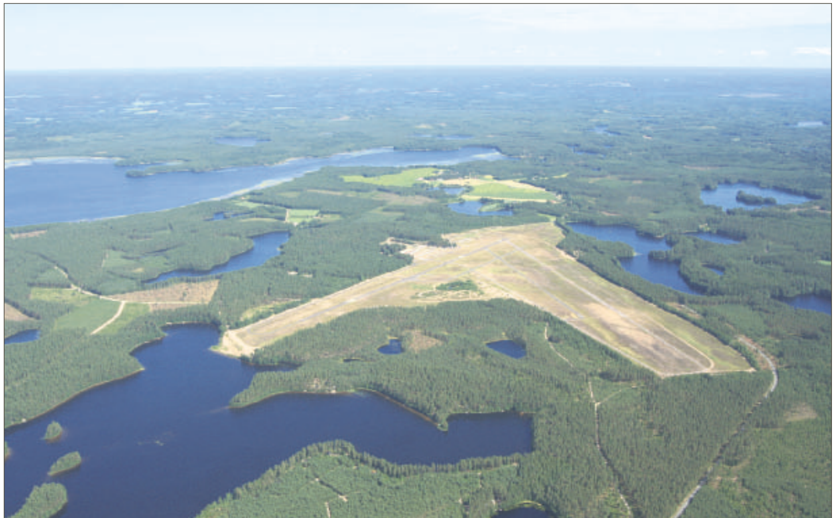
Räyskälä on pohjoismaiden vilkkain suomalaisen harrasteilmailun "korpikenttä" ja Suomen viidenneksi vilkkain lentokenttä operaatioiden määrässä mitattuna.

Mitä tulee valvomattomiin kenttiin, niin valtio lopetti silloisen Ilmailuhallinnon kautta ohjatut pienkenttäavustukset 90-luvulla, jonka jälkeen tukea kenttien kunnostamiseen ja ylläpitoon ei ole saatu. Sittemmin kenttien siirryttyä Puolustusministeriön alaisuudesta Metsähallituksen alaisuuteen, on kenttien ja/tai ainakin ns. teknisten alueiden käytöstä jouduttu maksamaan myös vuokraa. Viimeisten parinkymme-