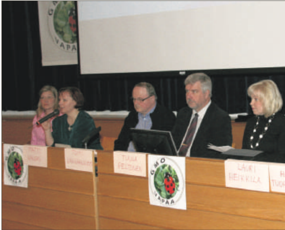
Geenimuunneltujen tuotteiden yleistymisestä pidettiin paneelikeskustelu Jyväskylässä lauantaina 4.4.2009.

Toinen hyvä esimerkki on Suomessa paljon käytetty maito. Lehmä, joka on