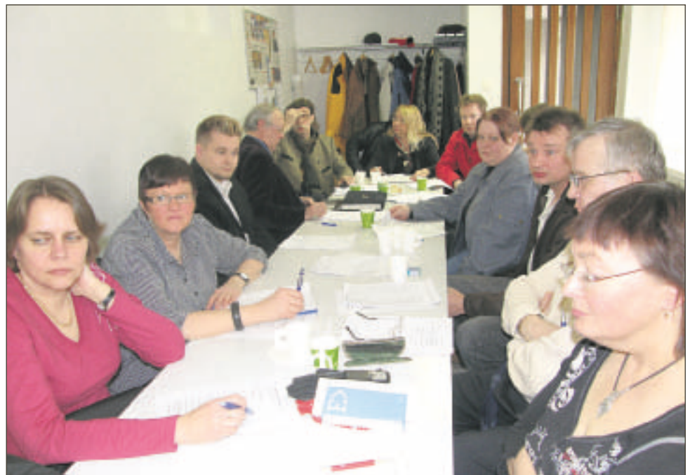
Pirkanmaan piiritoimisto alkaa käydä ahtaaksi kokoustilaksi jo pelkästään Tampereen osaston kokouksissa. Muutoin tila on oivallinen.