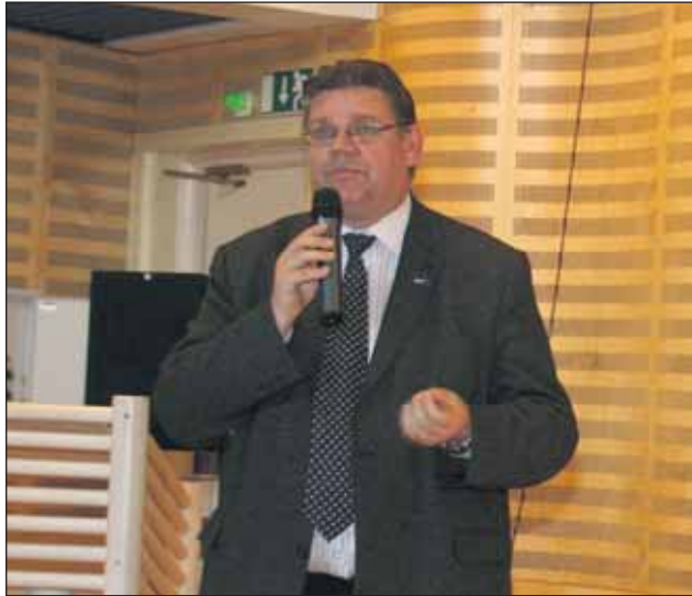
Perussuomalaisten puheenjohtaja Timo Soini puhui lauantaina 2.5. Perussuomalaisten Pirkanmaan piirin kevätkokouksessa Tampereella.

Perussuomalaisten tehtävä on olla vaihtoehto ja kanava niille suomalaisille kesäkuun EU-vaaleissa, jotka ovat tyytymättömiä Suomen EU-jäsenyyteen ja EU-politiikkaan.