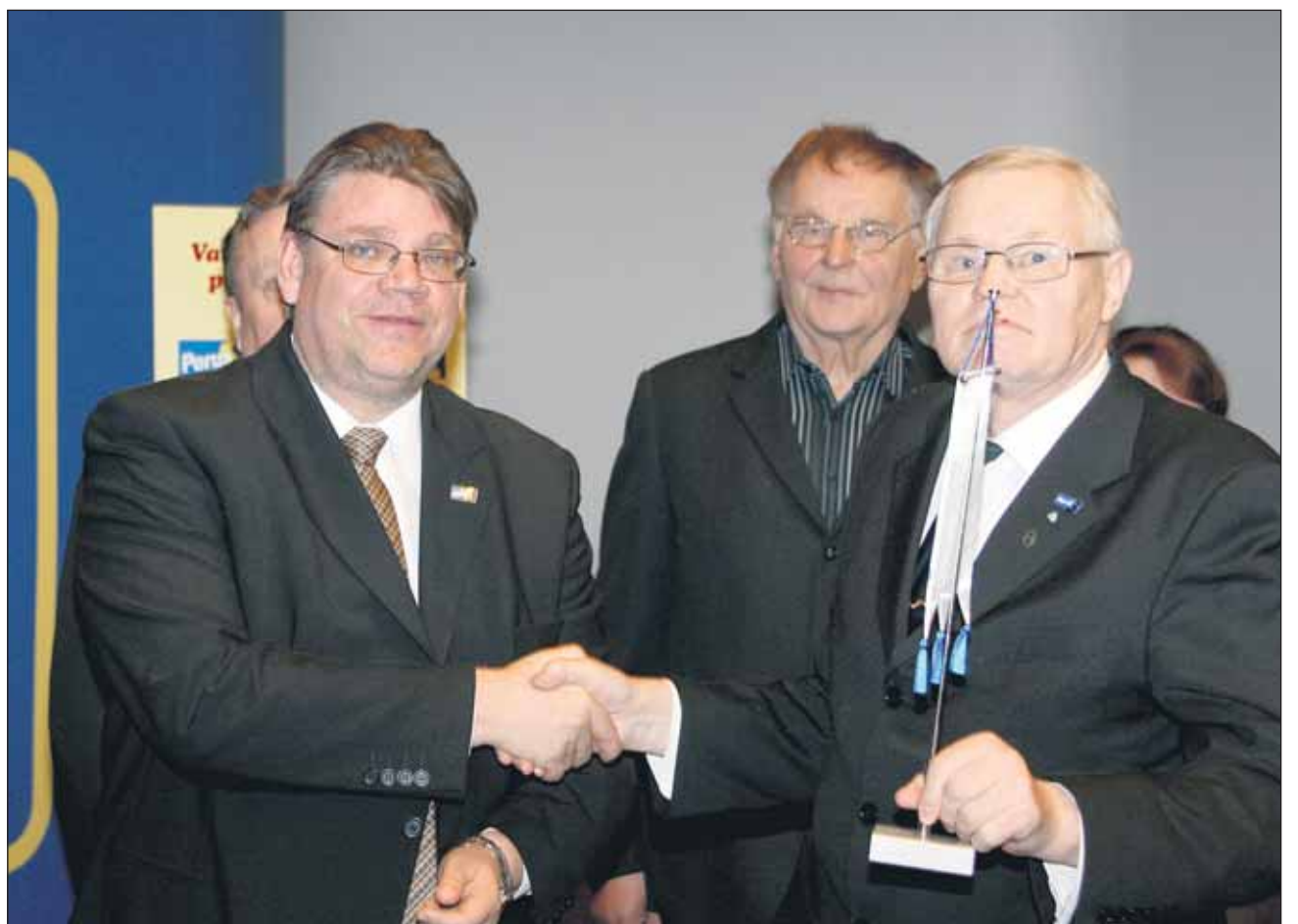
Oikeutta Eläkeläisille ry:n Helsingin jäsenyhdistys luovutti Yhdistyksen viirin puolueen puheenjohtaja Timo Soinille eduskunnan auditoriossa 18.4.

Omasta puolestani toivotan teille kaikille hyvää veteraanipäivän ja -juhlan jatkoa.