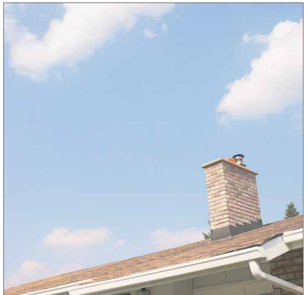
Kotinsa voi nykyään lämmittää hyvin monella eri tavalla. Lämmitysjärjestelmän valintaan vaikuttavat monet eri tekijät, joita kannattaa harkita tarkkaan.

Uusiutuviin energialähteisiin siirtymistä pyritään myös valtiovalan taholta tukemaan, jotta niistä saataisiin hintakilpailukyky-