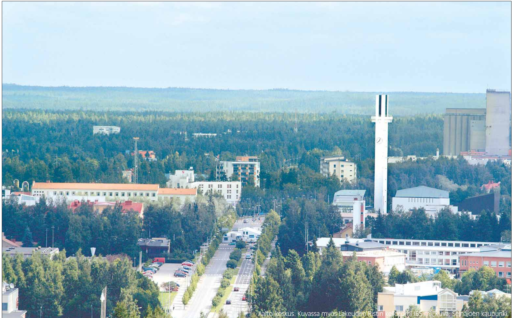
Aalto-keskus. Kuvassa myös Lakeuden Ristin kellotorni (65 m).