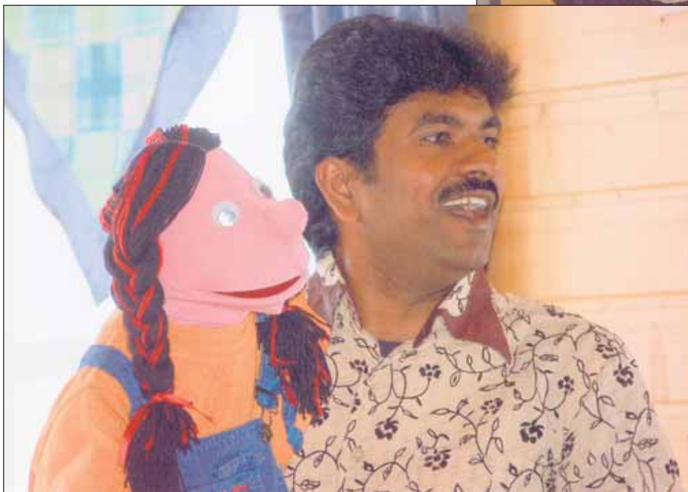
Vatsastapuhuja "keskustelee" kaverinsa kanssa.