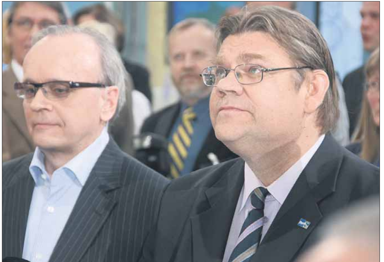
Timo Soini seurasi tyytyväisenä vaalituloslaskennan edistymistä.