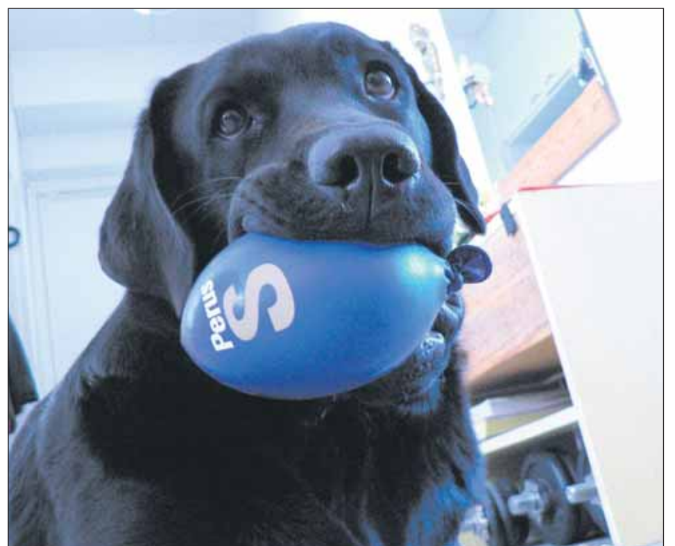
Perussuomalaisten mainontaa puree.