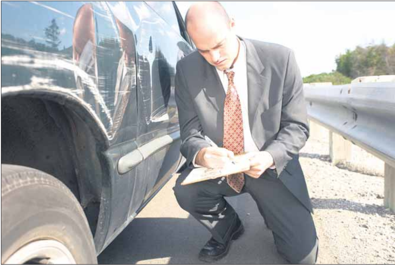
Jos suunnittelee käytetyn auton ostoa, on ostajalla velvollisuus varmistua itse auton kunnosta.

Käytetyn auton ostamisessa on aina omat riskinsä, ja myös ostajalla on velvollisuus tarkistaa, että auto on päällisin puolin kunnossa, tarkistaa paperit ja suorittaa koeajo. Sikaä säkissä ei kannata ostaa. Kun käytetyn auton ostaa liikkeestä, suojaa ostajaa kuitenkin kuluttajansuojalaki.