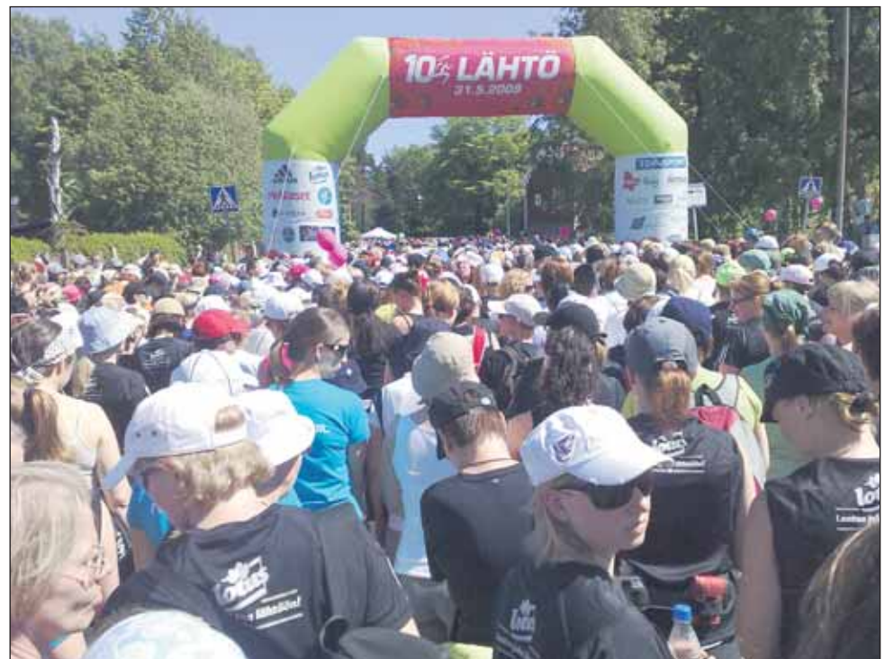
Lähtöportilla. Yli 18.000 naista osallistui liikuntatapahtumaan 31.5.09.