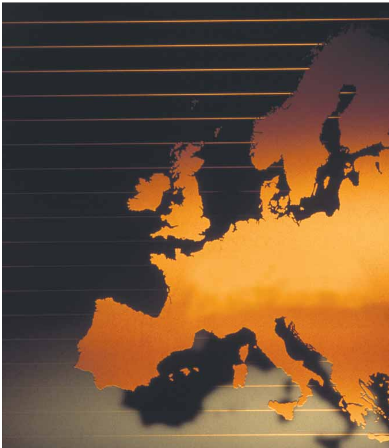
Euroopassa asuu 9-10 miljoonaa romania. Koko maailmassa heitä arvioidaan olevan noin 20 miljoonaa.

Hankaluus työpaikkojen saamisessa aiheuttaa