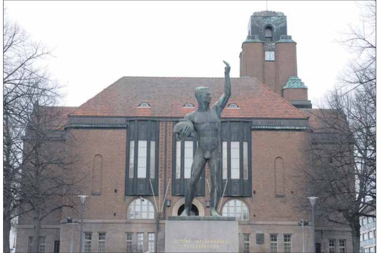
Lahdessa tuhottiin veroeuroja yli kaksi miljoonaa sähköiseen hankkeeseen, eikä mitään saatu käytännössä aikaan. Perussuomalaiset moittivat kaupunginvaltuustossa puutteellista valvontaa ja ihmettelivät, miksi tyhjää jauhavaa hanketta ei heti keskeytetty. Kuvassa vapausoturipatsas ja kaupungintalo.

Fenix-hankkeesta tähän asti saadut tulokset on tar-