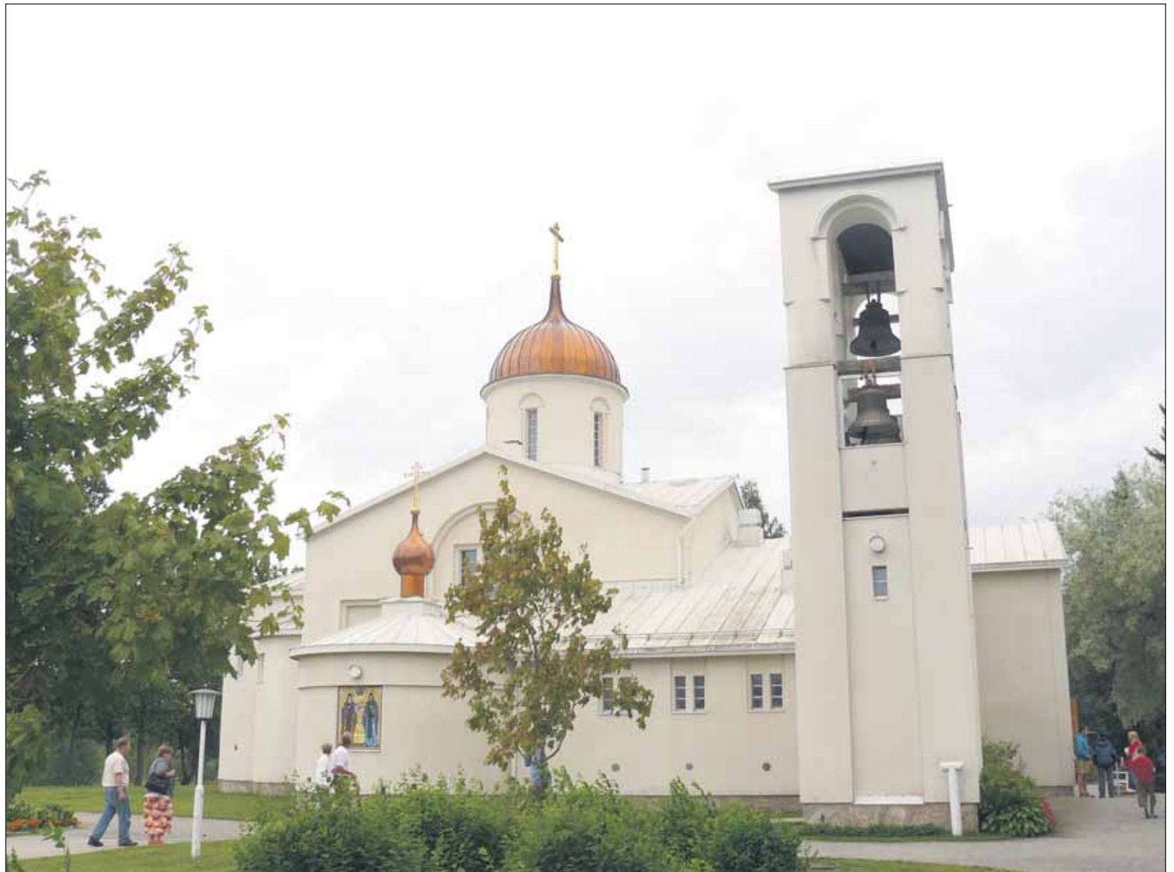
Valamon luostarin pääkirkko eli uusi kirkko vihittiin käyttöön 1977. Se edustaa pohjoisvenäläistä kivikirkkoarkkitehtuuria ja muoto on kolmiosisainen. Kirkon osat ovat alttari, kirkkosali ja eteinen. Tyypillistä on myös yksikupolisuus ja erillinen talvikirkko.