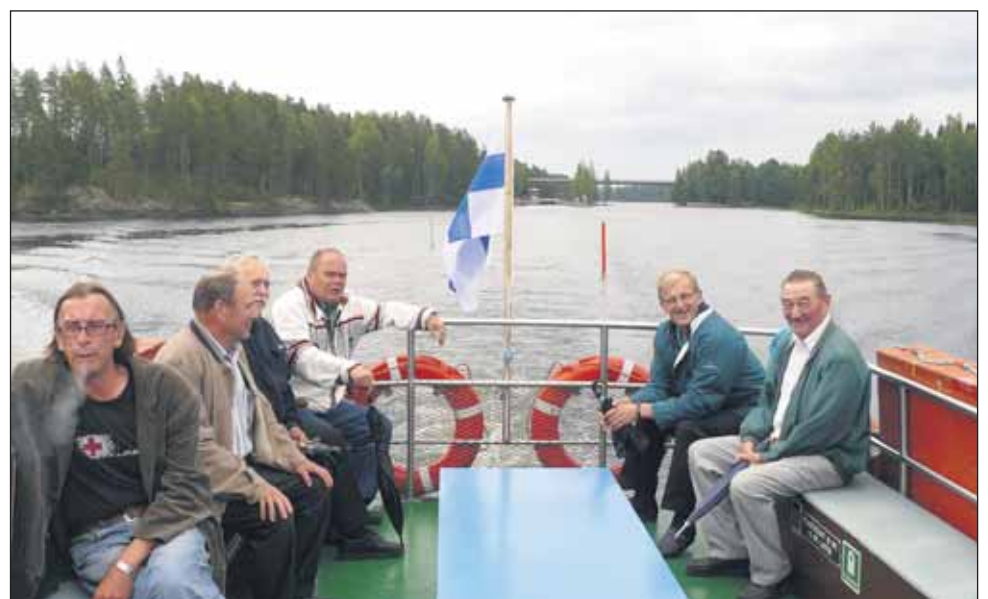
Perussuomalaisia miehiä perussuomalaisessa maisemassa M/S Sergein lähdettyä.

Vuosisatojen kukoistuksen ja toiminnan jälkeen toiminta siellä hiljeni, mutta säilyi. Toinen maailmansota muutti kuitenkin historian dramaattisesti täälläkin.