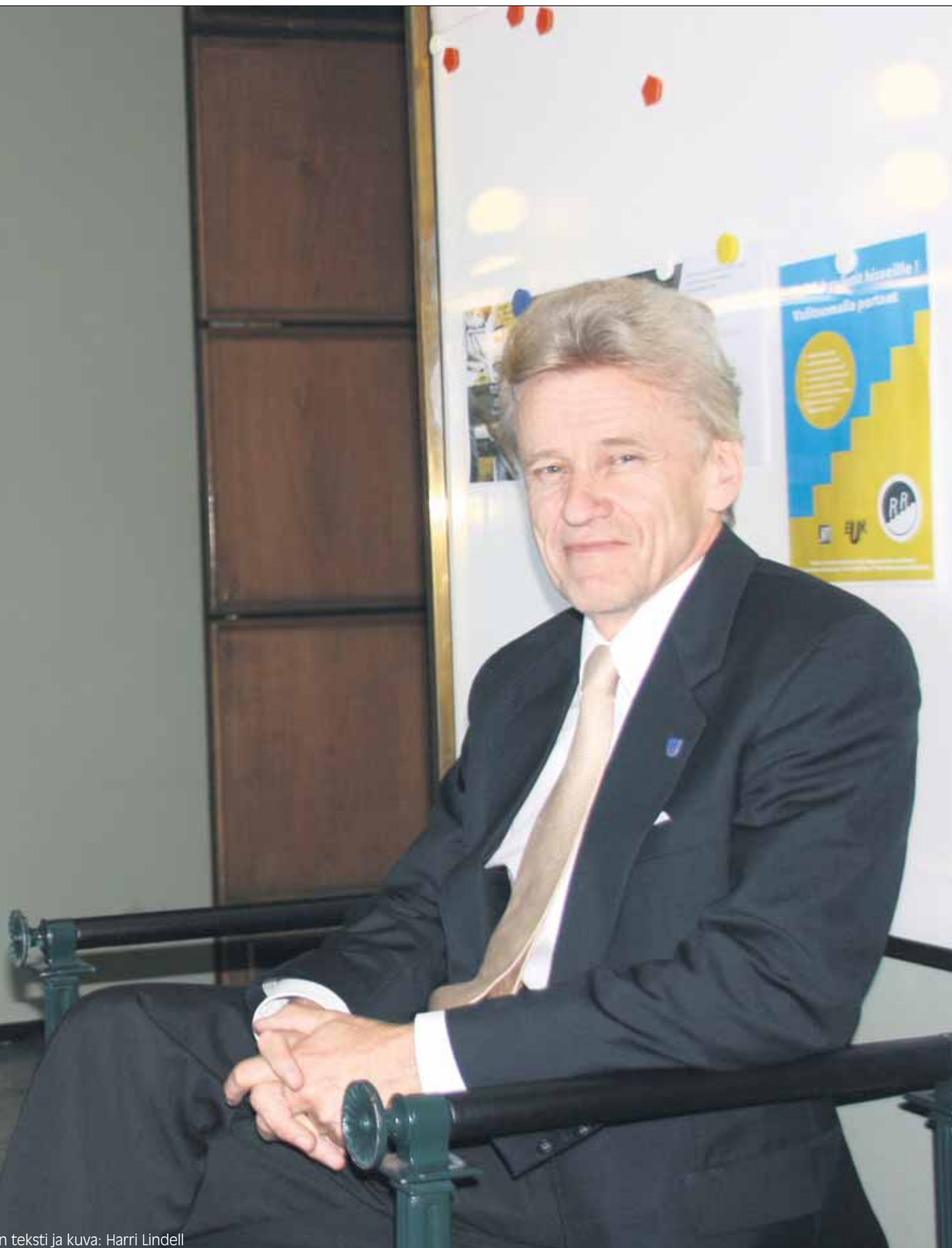
h teksti ja kuva: Harri Lindell