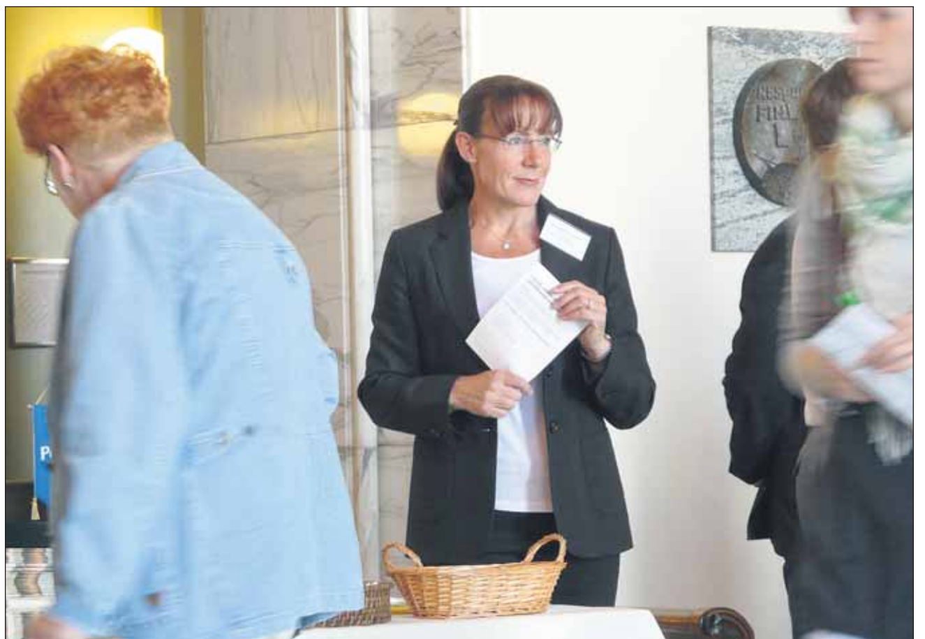
Kansanedustaja Pirkko Ruohonen-Lerner oli kansalaisten tavattavissa eduskunnan avoimien ovien päivänä.

Maanantaina 7.9. olivat avoinna Eduskuntatalon lisärakennuksen Pikkuparlamentin ovet. Siellä sai tutustua atriumin lisäksi muun muassa suuren valiokunnan huoneeseen. Ulkopoliittinen instituutti esitteli omaa toimintaansa ulkoasiainvaliokunnan huoneesta. Auditoriossa esitettiin valiokuntatyöskentelystä kertova palkittu Liikkumavara-dokumentti ja Kansalaisinfossa oli mahdollisuus katsoa eduskunnan esittelyvideo. Pikkuparlamentissa kävijöitä oli 742.