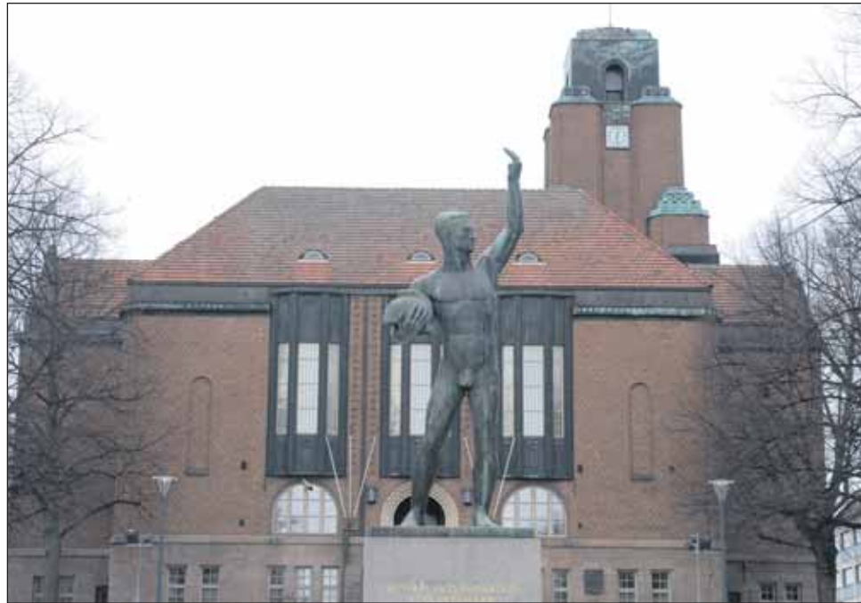
Kuvassa Lahden vapaussoturipatsas ja kaupungintalo.