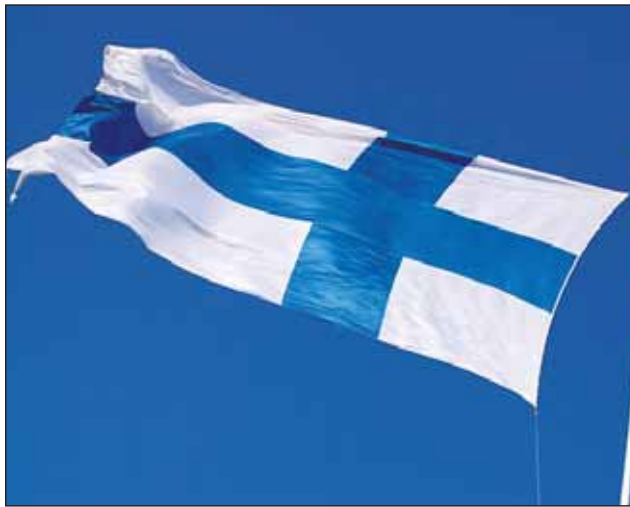
10.10 vietetään myös Aleksis Kiven ja suomalaisen kirjallisuuden päivää.