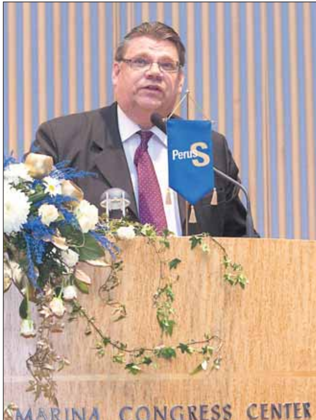
Vanhojen puolueiden housut tutisevat perussuomalaisten nousun edessä, totesi Timo Soini.

Vuosi vaaleihin -risteilyn pääseminaari alkoi lauantai-iltapäivänä 6.3. Grand Marinan kongressikeskuksessa. Puolueväkeä virtasi paikalle niin Lapin tuntureilta kuin Suomen eteläisimmästä Hangostakin. Paikalle oli saapunut noin kolmesataa henkilöä kuulemaan mielenkiintoista seminaaria.