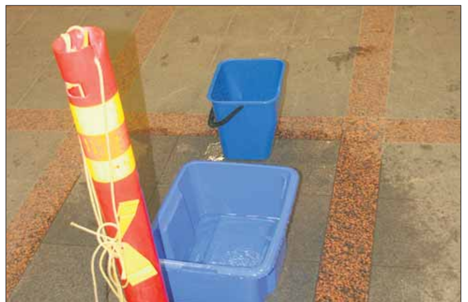
Helsingin rautatieasemalle ei enää vuoda rikkoutunut vesijohtoputki. Aseman käyttäjien harmiksi ja ihmetykseksi vettä tulee katosta aseman lattialle.