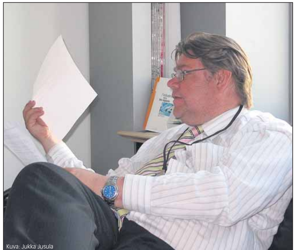
Kuva: Jukka Jusula

Perussuomalaisilla on nyt tarkan harkinnan ja