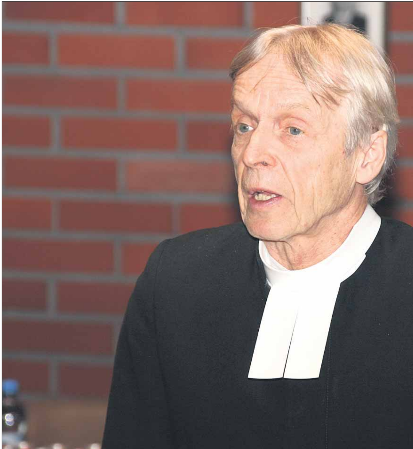
Rovasti Anssi joutsenlahti pyrkii takaisin eduskuntaan ensi vuoden vaaleissa.