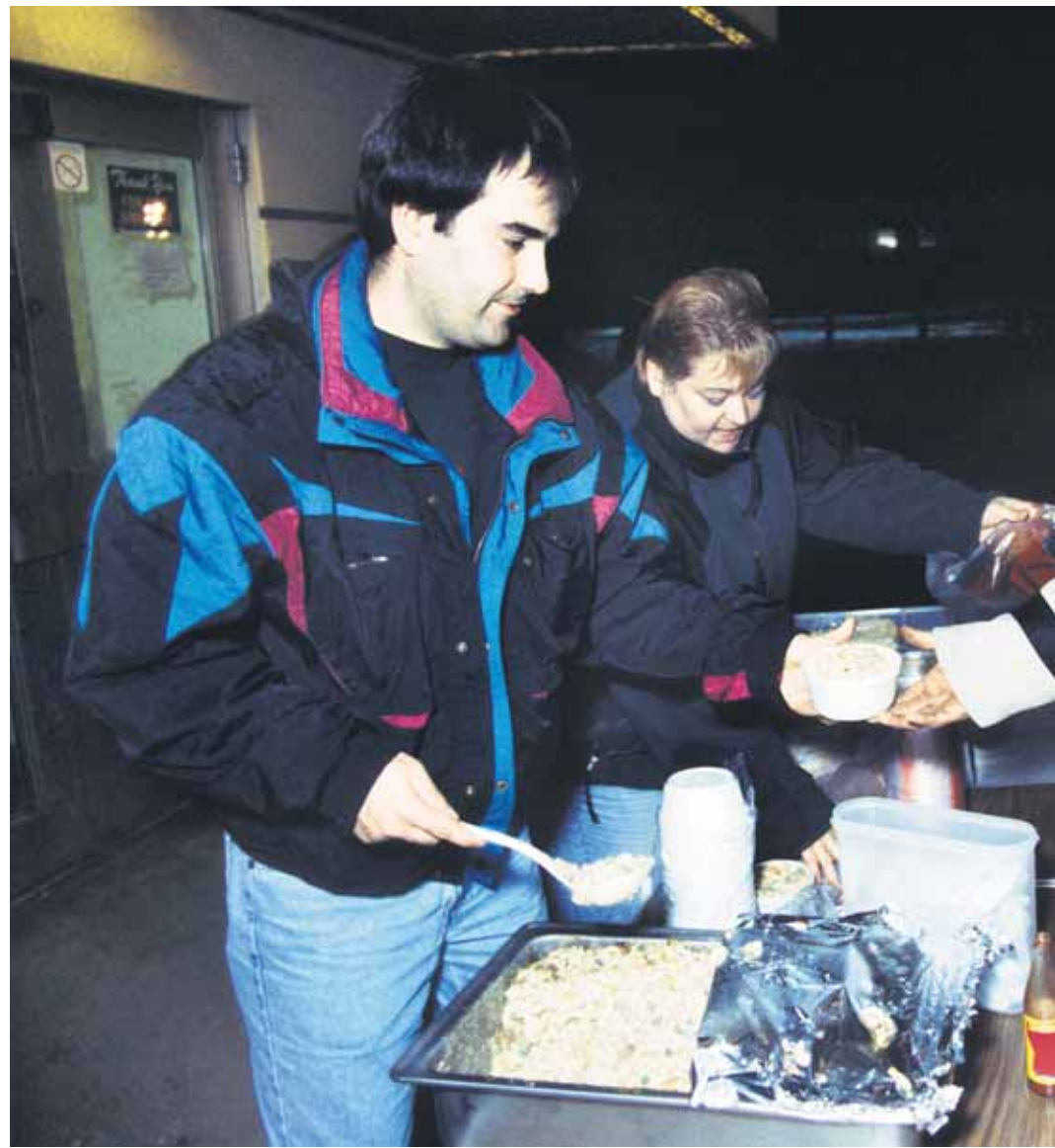
EU:n sisäinen köyhyys siirtolaisuus on vakava ongelma, joka on jätetty hoitamatta liian pitkään. Seurauksista joutuvat maksamaan kaikki.

Vastaanottajamailla on kässissään toisenlainen ongelma. Niiltä puuttuu selkeä vastaanottojärjestelmä, jonka johdosta maahan saapuneet usein jäävät yhteiskunnan turvaverkkojen