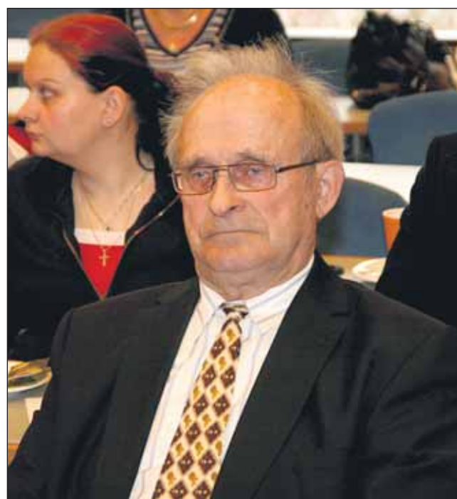
Matti Vattulaisen mielestä Eero Heinäluomalle ja Urpilaiselle pitäisi lähettää ruusuja, he kun tekevät maahanmuuttopuheillaan Perussuomalaisille hyvää vaalityötä.