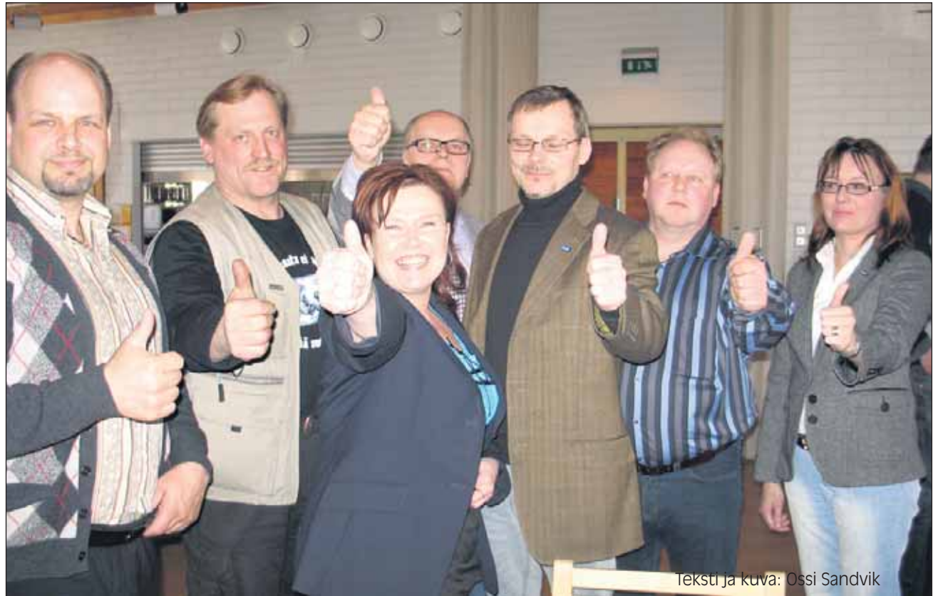
teksti ja kuva: Ossi Sandvik

Pohjois-Karjalassa ehdokkaat odottavat innoissaan vaalityön alkua.