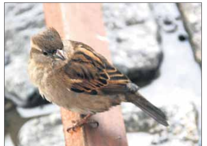
Sadetta tuli pitämään yllätysvieras.