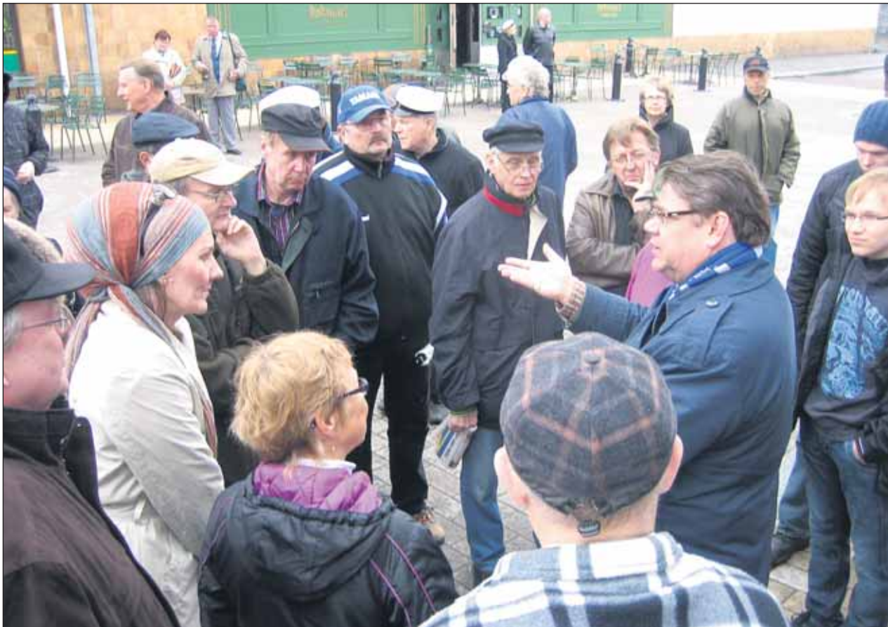
Soini Imatralla Kävelykadulla vappuna 2010.