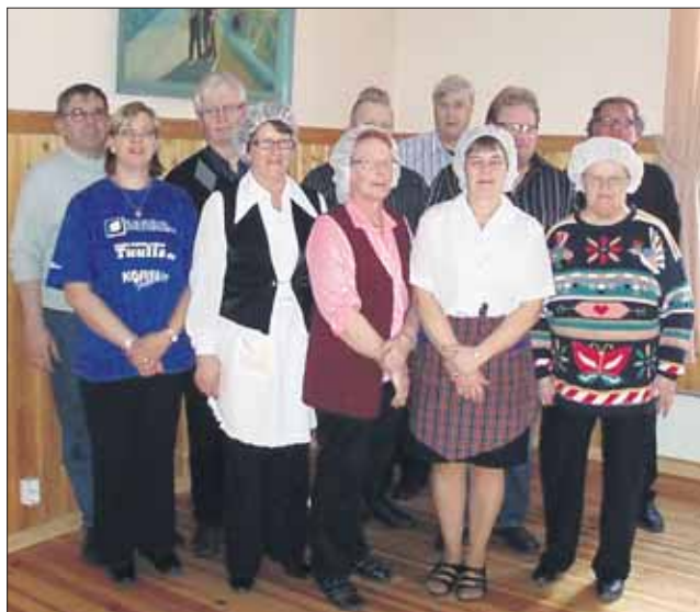
Järjestäjät yhteiskuvassa hyvin onnistuneen päivän jälkeen.

Kauhavan Perussuomalaiset järjestivät sunnuntaina 18.4. päivälliset Mäenpään kylätalolla. Tarkoituksena oli tarjota monipuolinen valikoima laadukasta lähiruokaa niin aikuisille kuin