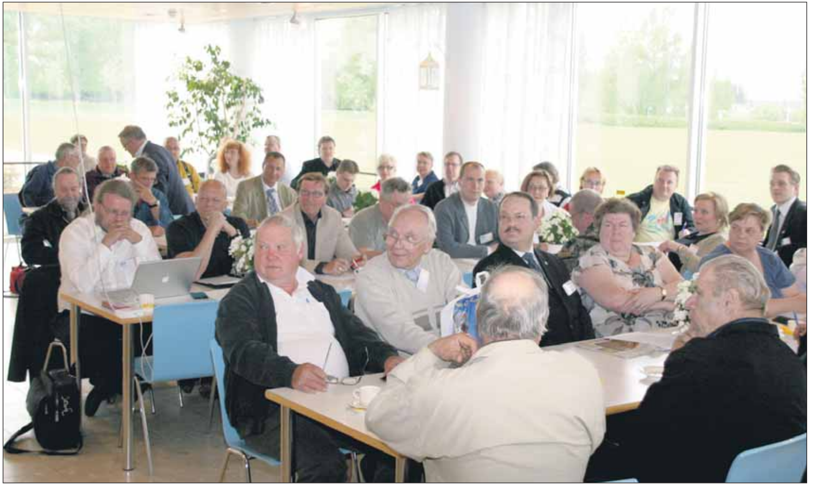
Kokousväki keskusteli ja otti kantaa innokkaasti.

Kokouksen lopuksi puheenjohtaja kiitti osanottajia hyvästä kokouksesta ja siitä, ettei tarvinnut ihan tosissaan