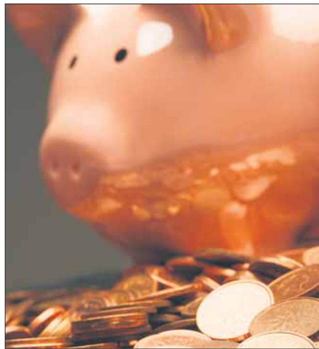
Keskustanuorten saama tukipotti ihmetyttää PS-nuoria.

Perussuomalaiset Nuoret epäilivät kannanotossaan 3.6., että keskustanuoret ovat kojanneet opetusministeriötä jäsenmääränsä osalta ja saaneet näin liian paljon tukea vuosittain. Tie keskustanuorten jäseneksi voi olla puolueen erikoisten jäsenyyskäytäntöjen takia hyvinkin yllättävä. Jäsenek-