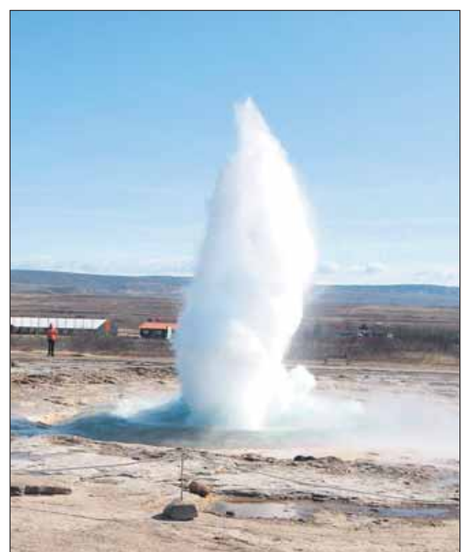
Geysir, mielenkiintoinen ja hieno ilmiö, jonka kuvaaminen oli hankalaa. Sen rytmi on niin arvaamaton.