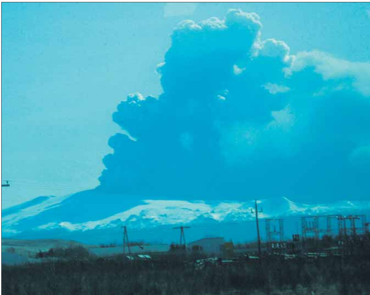
Oli unohtumaton kokemus seurata Eyjafjallajökull-tulivuoren purkausta livenä. Tunnelmaa tuolloin, 17.4.2010, ei voi sanoa kuvata. Savu, höyry ja tuhka kohosivat ilmaan ja niistä muodostui hienoja kuvioita taivaalle. Istuva enkeli?

Pian selvisi, ettei saarelta päästä lähtemään ihan heti. Pahimmat arviot olivat, että Euroopan kentät pysyvät suljettuina viikkoja, ellei kuukausia. Joku pelkäsi jopa vuoden tai kahden taukoa koko lentoliikenteelle! Hilpeät tunnelmat vaihtuivat vähemmän hilpeisiin ja matkanjohtajan elämä muuttui melkoiseksi mylerrykseksi, kun piti yrittää selvittää tilanteesta kunnialla. Kaikki asiat tuntuivat olevan ihan levällään...ei tiedetty, missä ollaan yöttä, milloin lennetään, kuka maksaa hotellin vai maksaako kukaan. Kysehän oli