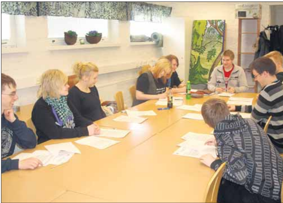
Kuva Kainuun nuorisojaoston perustavasta kokouksesta.

Perussuomalaisten Kainuun piirin nuorisojaosto on toiminut kaksi kuukautta. Jaostoa johtaa johtokunta, joka on kokoontunut toimintansa aikana jo viisi kertaa. Nuorisojaosto toimii yhteistyössä Kainuun piirin piiritoimikunnan kanssa.