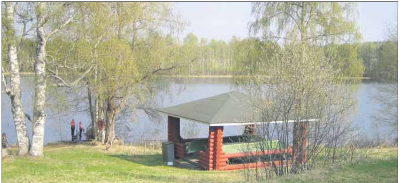
Lomakeskus Rauhala on viihtyisä ja rauhallinen lomaviettäpaikka Keski-Suomessa, Karstulan ja Saarijärven lähellä.