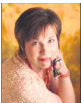
Itsekkyyks on tuhovoima

Harrastuksiani ovat metsästys ja kalastus. Suurin huolenaiheeni on lasten ja nuorten pahoinvointi, sillä kuluvan vaalikauden aikana on tapahtunut hirvittäviä tapahtumia koulumaailmassa. Nykyhallitus syyttää aseita kaikesta, eikä ole tehnyt mitään parannuksia varsinaisen syyn korjaamiseen.